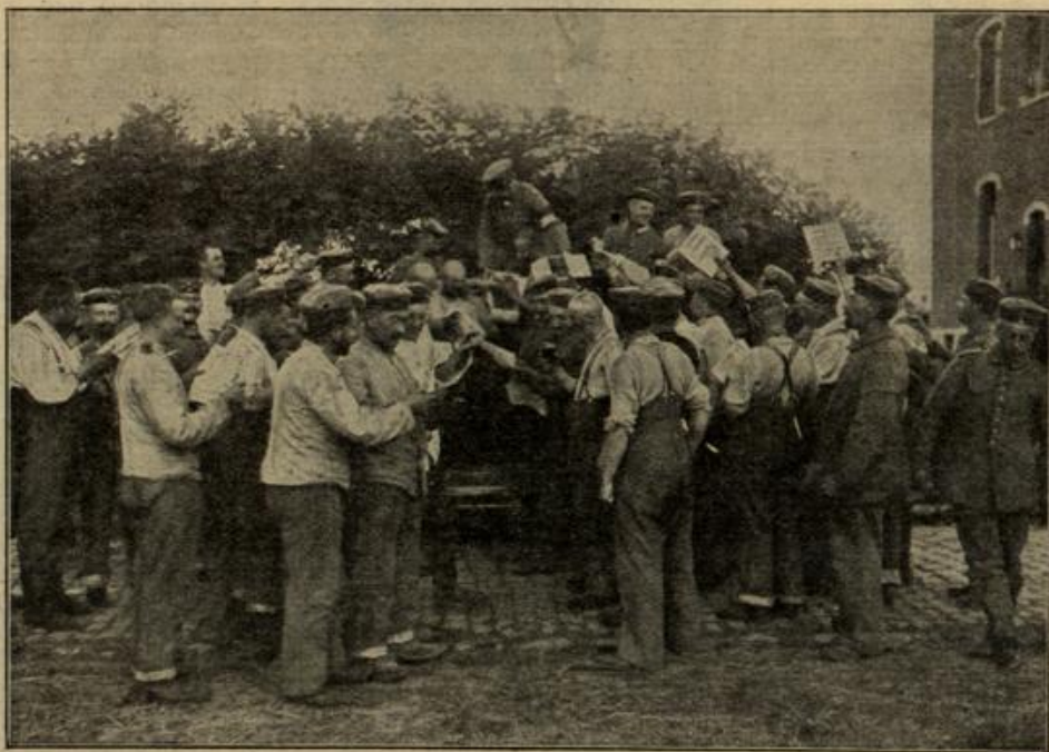
Vom Kriegsschauplatz in Frankreich: Verteilung von Liebesgaben. Phot. A. Grohs.