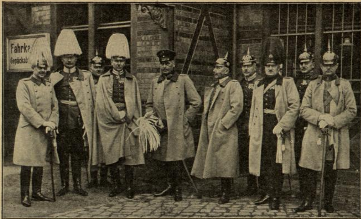
Die deutsche Offiziersmission, die im vorigen Jahr in türkische Dienste trat. (Mit Text.)

Zu den Kämpfen vor Toul. Wir zeigen in unserem Bilde eine von den Franzosen zerstörte Eisenbahnbrücke bei Thiancourt-Toul, an der noch die Eisenbahnschienen in der Luft schweben.