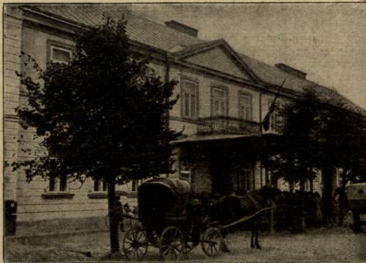
Das deutsche Gouvernementsgebäude in Suwalki. (Mit Text.)

Damit jagte er seinen Leuten voran in saufender Karriere.