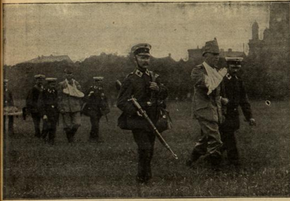
Hinter der Kampflinie: Abführen von Verwundeten nach den Lazaretten durch Mitglieder des Roten Kreuzes.

die Männer, die es zur Einführung brachten. Scharnhorst war sein geistiger Schöpfer, jener Mann, von dem ein E. M. Arndt bewundernd sagen konnte: „Schlichteste Wahrheit in Einfachheit, geradeste Kühnheit in besonderer Klarheit: Das ist Scharnhorst!“ Das, was Scharnhorst in Gedanken trug, brachte die Kunst K. Fr. Schinckels in Form und Ausarbeitung zur vollendetsten Wiedergabe.