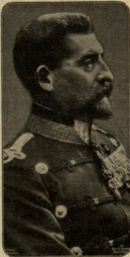
König Ferdinand von Rumänien, Nachfolger und Neffe des verstorbenen Königs. (Mit Text.)

Eilig jagten die Stabsoffiziere zu ihren Bataillonen. Der Leutnant aber mußte nun, neben dem Oberst reitend, eingehend berichten. Als er fertig war, drückte jener warm seine Hand und sagte freundlich: „Sie sind und bleiben ein Tollkopf. Aber Ihr Wunsch betreffs des Kreuzes dürfte sich erfüllt haben!“