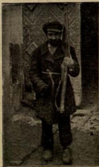
Ein russischer Wasserträger in Zuwalli.

Böllig hypnotisiert, ohne irgendeine Bewegung, starrten die Kosaken den heranlaufenden Husaren entgegen. Da waren diese auch schon bei ihnen. Hastig, einer plötzlich auf ihn eindringenden Eingebung Folge gebend, riß nun aber der Leutnant sein Pferd herum und jagte in die Straße hinein, in der die erste Kosakenabteilung verschwunden war. Seine Husaren folgten natürlich. Was er aber damit eigentlich beabsichtigte, ob er die Straße bereits frei von Kosaken wählte, wußte er im Augenblicke wohl selber kaum. Und was nun geschah, folgte alles so blitzschnell hintereinander, daß er hernach selber nicht mehr zu sagen vermochte, wie die einzelnen Phasen aufeinander gefolgt waren: