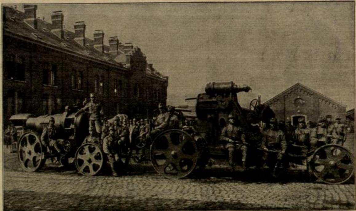
Ein österreichisches Motorgeschütz in der Brüsseler Artillerietaserne. (Mit Text.)

Eisenerne war die Zeit, die es erstehen ließ, und eisenerne