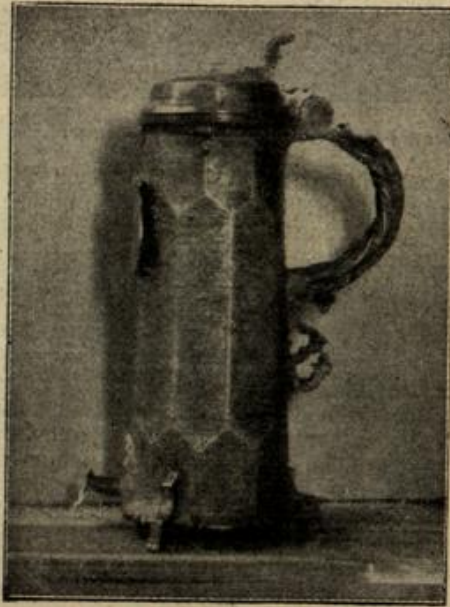
33 000 Mark für einen Zinnhumpen.

Geräuschlos zog der draußen stehende Diener die Tür hinter dem Davoneilenden zu; der Schlossherr aber wandte sich zum Fenster. Eben trat die Gestalt seines stattlichen Neffen aus