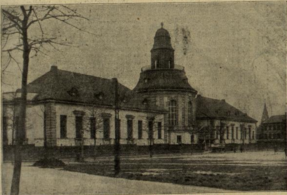
Das neue König-Albert-Museum in Zwickau i. S. (Mit Text.)

Eben waren die Vorhänge von Sma- ragdas Boudoir hin- ter dem Doktor zu- gefallen, da schritt aus der tiefen Fen- sternische des Vor- zimmers eine hohe Gestalt. Es war der Schloßherr. Sein Gesicht war bleich, und in den Augen glühte es festsam, wie Schmerz und Groll. Der schwere Teppich machte sei- nen Schritt lautlos, er näherte sich hastig dem Vorhang. Atem- los bog er sich zu dem kleinen Spalt hernieder, und seine glühenden Augen starrten in das vor ihm gelegene Gemach. Dort, nicht weit von