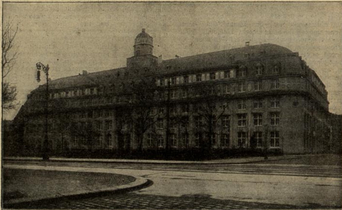
Der Neubau der Dresdener Oststrassenkass. (Mit Text.)

eilten sie in scharfem Trabe davon. Gräfin Smaragda