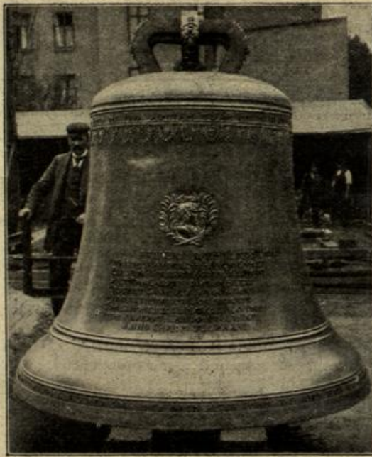
Die Brandenburger Glocke des Agl. Doms in Berlin. (Mit Text.)

deuten?“ „Nichts, dich interessir könnte“, erwid