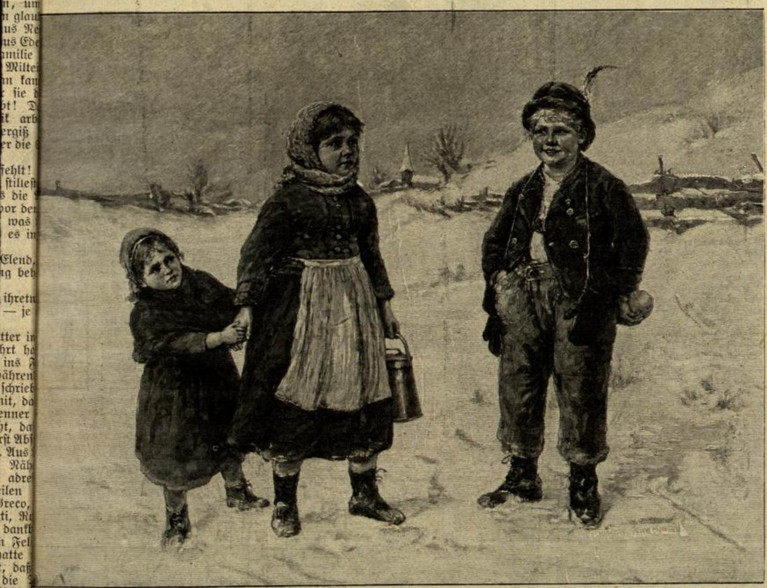
Hinterlistig. Nach einem Gemälde von Müller-Vingte. (Mit Text.) Photographieverlag von Franz Hanfängl in München.

In seiner Abhandlung über die deutsche Literatur 1780 kommen die merkwürdigsten Äußerungen vor, die wohl zeigen, wie er die bedeutenderen Erscheinungen nicht über sah. "Erst seit kurzem gewinnen die gebildeten Männer den Mut, in ihrer Muttersprache zu schreiben; sie erröten nicht mehr, Deutsche zu sein." — "Man bahnt sich den Weg zum Parnas wie zum Tempel der Wissenschaft." — "Wir werden unsere Klassiker haben, jeder wird sie lesen, sich danach zu bilden, unsere Nachbarn werden Deutsch lernen; denn wohl mag unsere Sprache, in ihrer einst vollendeten Ausbildung, sich durch guter Schriftsteller Ruhm von einem Ende Europas zum andern verbreiten."