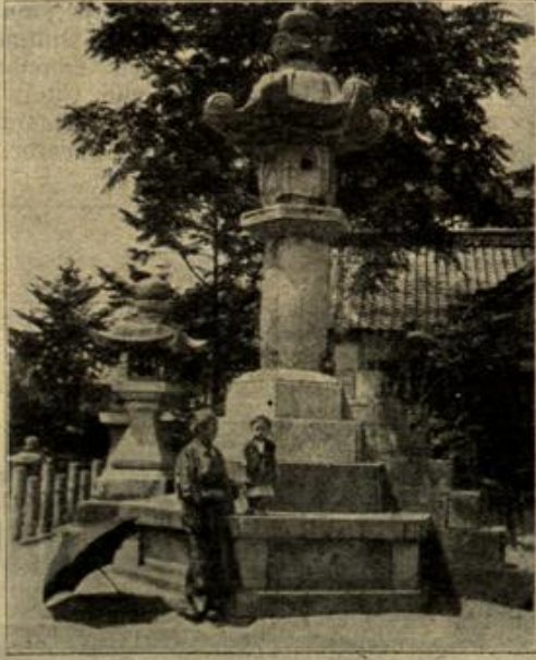
Tempellaterne im Hof eines Schintotempels in Japan. (Mit Text.)

Ob er gewillt war, von jetzt ab nur noch der Pflicht zu leben? —