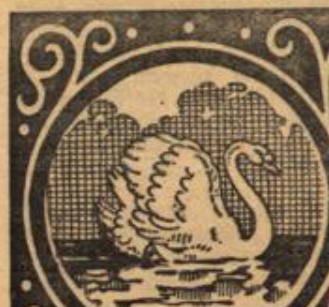
Kaufst du „Seifix“ ein zum Bleichen, achte auf den Schwan als Zeichen.

In diesen Betrachtungen wurde Lusi plötzlich irgendjemand zupfte an seinem Kittel. Er fuhr er hoch und griff zum Revolver.