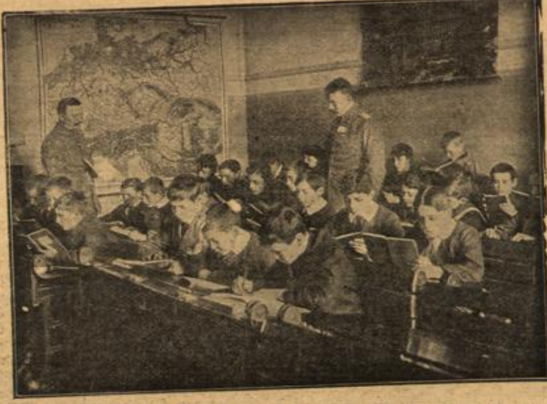
Die erste deutsche Schule in Brüssel, in der deutsche Offiziere deutschen Sprachunterricht erteilen.