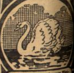
Kaufst du „Seifix“ ein zum Bleichen, achte auf den Schwan als Zeichen.