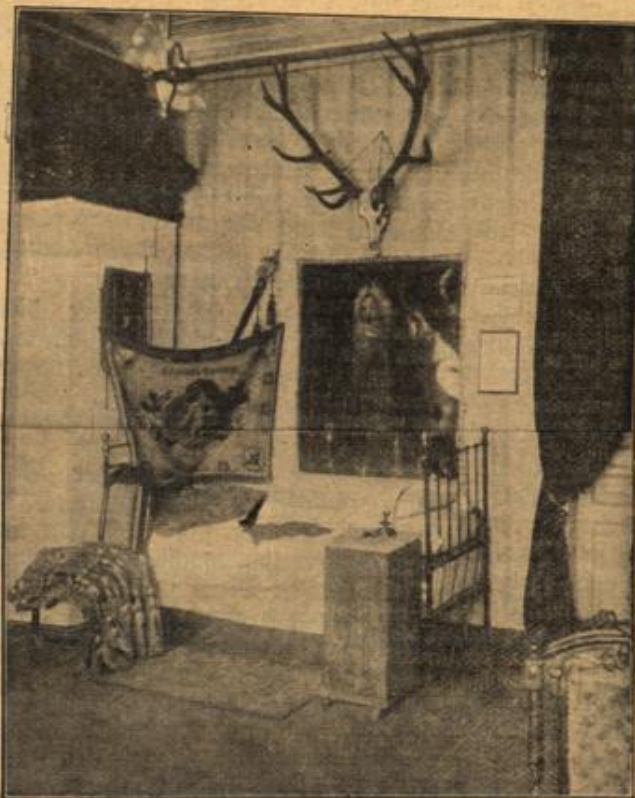
Die hervorstechendste „Eigenart“ unserer russischen Feinde.

„Liegt etwas anders. Ich weiß es und will Ihnen die Beichte erlassen. Sie hielten meine Zunge für wenig urteilsfähig und bauten darauf einen festen Plan. Meine Zunge aber beehrte mich sofort, daß der Wein derselbe geblieben und nur das Etikett geändert war. Das müßte bestraft werden - einfach dadurch, daß ich eine Mög- lichkeit verwirklichte, an die Sie bei Ihrem Plan nicht gedacht hatten.“