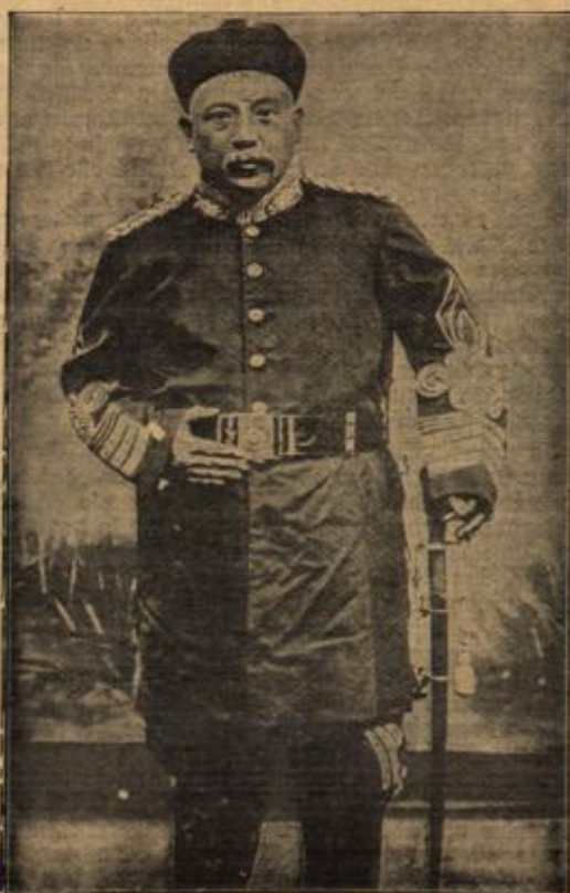
Präsident Yuan Shikai.

das Staatsoberhaupt der Republik China, gegen die Japan augenblicklich mobilisiert.