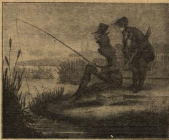
Satire vor hundert Jahren.

„Er könnte vielleicht genügend Nahrung in dieser großen Kiste mit sich führen. Aber ich glaube, das braucht er gar nicht. Sie sind doch auch schon im Osten gewesen! Erinnern Sie sich nicht