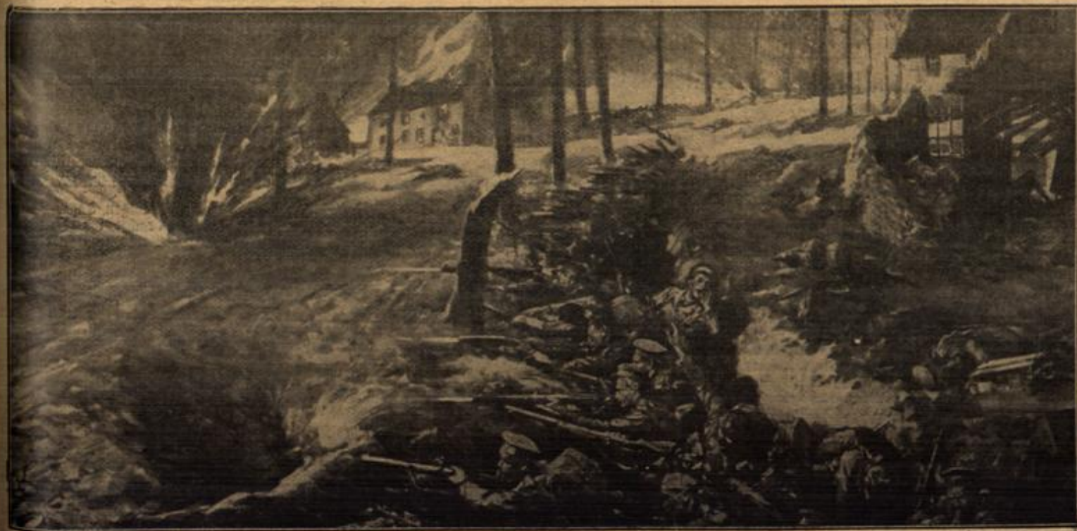
Englische Soldaten im Schützengraben unter deutschem Granatfeuer bei der Verteidigung eines Dorfes. Nach einer englischen Zeichnung.

Der Gelehrte fing an mit der alten Frau Hurlig, erzählte, was er von ihrem Leben wußte, und wie sie zu- leht an Dr. Gosewisch gelangt sei. Daran knüpfte er eine eingehende Darstellung der Pflichten und Bezüge