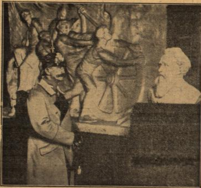
Der belgische Generalgouverneur Excellenz von Bissing im Museum der schönen Künste in Brüssel.