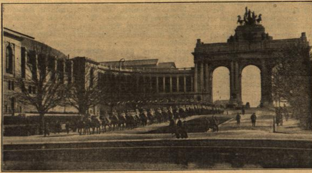
Deutsche Kürassiere in Brüssel am Bogen des Cinquantenaire.