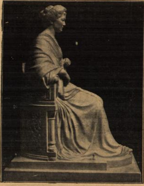
Kaiserin Auguste Viktoria, Schutzherrin des Roten Kreuzes.

Den besten Beweis dafür bildet die Einladung, die Herr Durand und ich soeben erhalten haben, wir möchten unsere Flitterwochen auf Darlington Manor verbringen. Der alte Herr aber, der mich zum Untersuchungsgefängnis führte, um meinen Bräutigam bei seiner Entlassung als erster zu beglückwünschen, war Herr Grey, dem ich es verdanke, daß mein Gatte vor aller Welt gerechtfertigt dasteht.