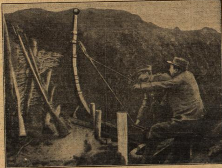
Französische Soldaten mit einem Katapult,

Als der junge Gelehrte hierauf in der offenen Droschke bei dem prächtigen Frühjahrsweber in den frischgebaudten Wäutern dahinfuhr — die untergehende Sonne umwob alles mit einem goldenen Schimmer und ließ selbst das griesgrämlichste Gesicht in einem freundlichen Lichte