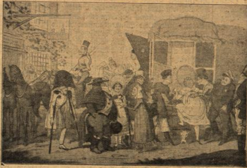
Cruikshank: Satire auf die Reifewut vor hundert Jahren.

"O, ihr Feiglinge!" rief Palmer ärgerlich. "Bieten Sie das Doppelte," flüsterte ihm der Halbblut-Seemann zu. "Und schnell. Sinabans Leute machen mir einen sehr verdächtigen Eindruck."