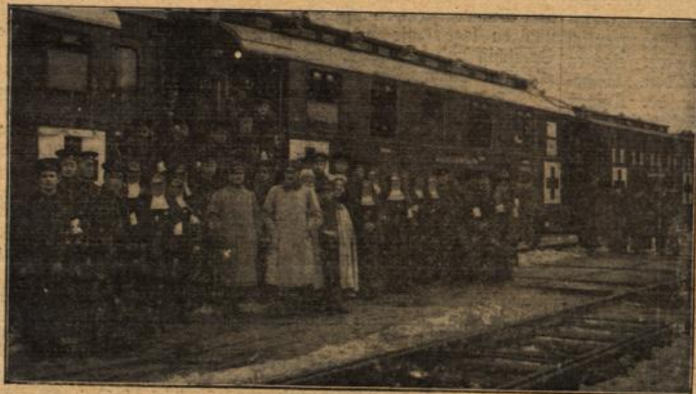
Das Pflegepersonal eines Malteser Lazarettzuges.

"Nein," erwiderte der Halbblut-Maori und schob sie rauh beiseite. "Ich will weder dich noch ein anderes Weib heiraten. Aber ich gehe hin zu dem weißen Manne und laß mir die vierzig Dollars und zehn Kisten Zwieback geben!"