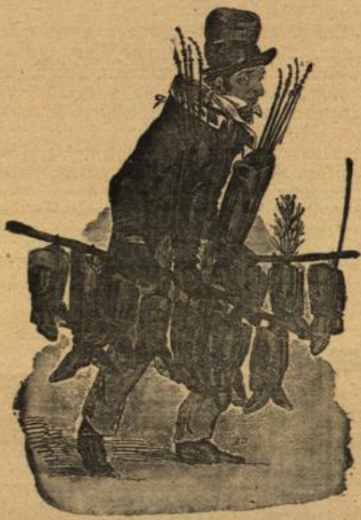
Berlin vor 75 Jahren. Stiefelpußer.

Aber mit einer Frau ist's wahrscheinlich auch nicht schwerer auszukommen als mit Wirtschaf- terinnen. Ich hab' genug von der Sorte. Kann- test Du nicht meine Herbstflora?" "Gewiß! Was ist ihr denn zugestoßen? Hat Deine letzte Zuflucht auch versagt?" "Die Herbstflora ist schon lange futsch! Aber sie ist schuld, daß ich heiraten werde," fügte er resigniert hinzu. "Ich kann Dir ja die Geschichte erzählen, wenn Du willst. Sie war meine dritte Wirtschafterin in dem Jahre. Die erste war die Frühlingsmarie, die ich entlassen mußte, weil sie im Frühling lieber spazieren ging als vor dem Herd stand. Ihr