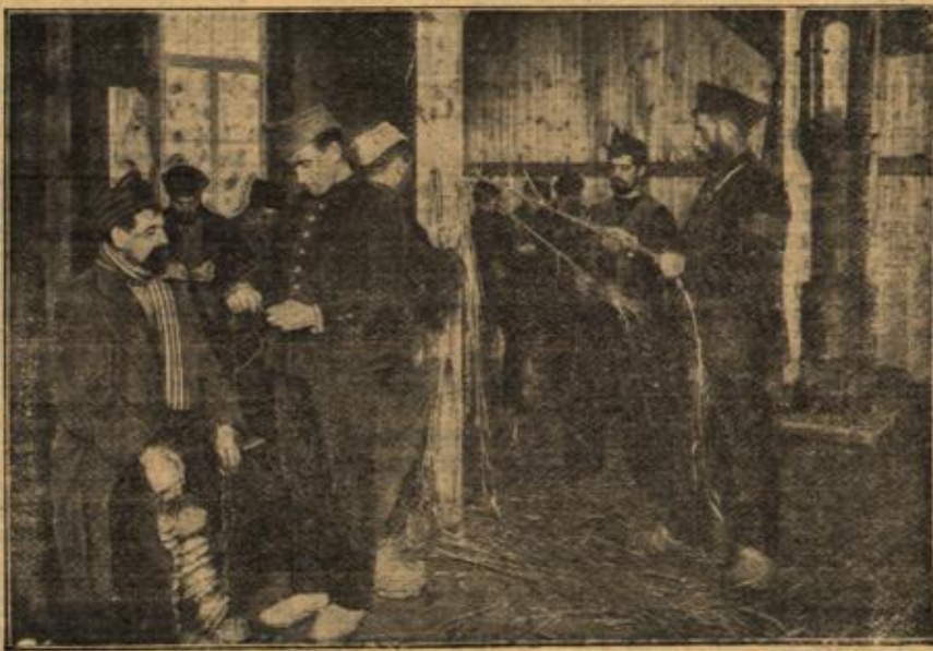
Antreten zum Kaffeholen im Zoffener Gefangenenlager.