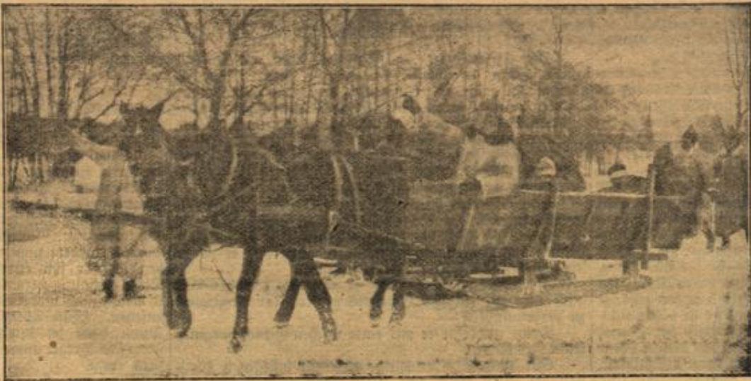
Verwundetentransport im Schlitten.

Der Herzog nickte grimmig. „Nehmen wir einmal an, ich würde, anstatt Ihnen den Inhalt dieses Leinenbeutels zu überreichen, Sie beim Kragen nehmen und Ihnen den Hals umdrehen!“