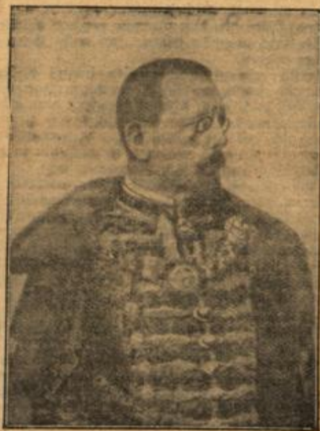
Baron Stephan Burian v. Rajecz, der neue österreich.-ungar. Minister des Innern.

Du hast das Recht dazu, sagte er, außerdem ist Schwäche zu einer solchen Zeit und unter solchen Um-