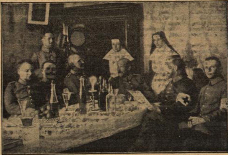
Ein deutsches Offiziersquartier in einem französischen Nonnenkloster.

Sagte sich Dvor: Dieser wohlherzogene, ange- elegante junge Mann war vielleicht gerade ein