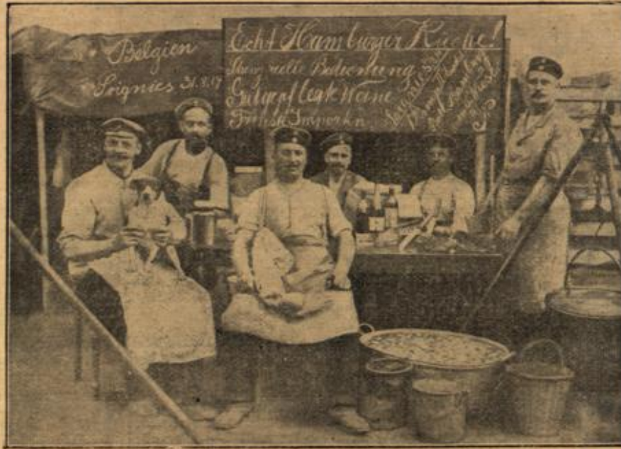
Echte Hamburger Rüche.

„Seien Sie bloß vorsichtig! Und wenn Sie durch eine Schneewehe nicht durchkommen, machen Sie kehrt!“ Eige