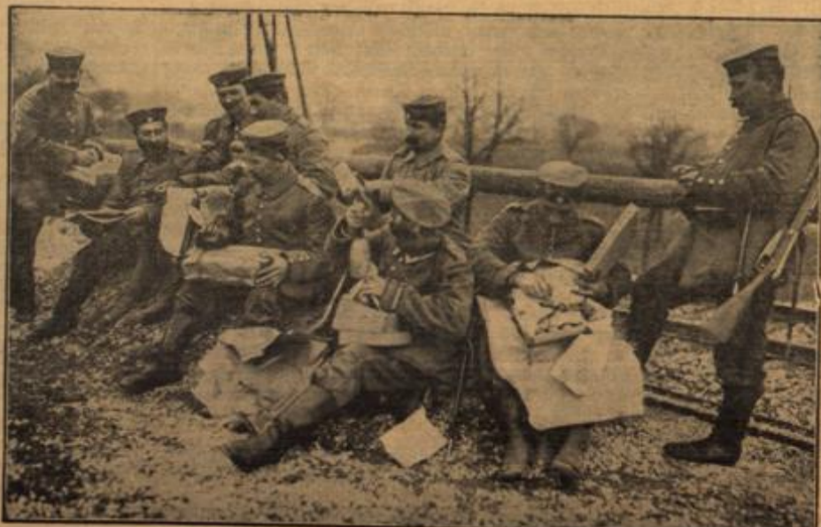
Die Ankunft der ersten Weihnachtspakete im Felde.