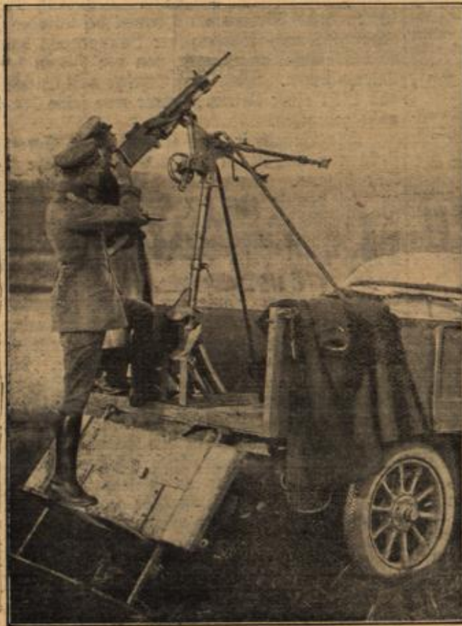
Ein erobertes französisches Maschinengewehr.

Wie wir in unserer Bilde zeigen, benutzen wir ein erobertes französisches Maschinengewehr zur Beschließung von feindlichen Häusern. Wir haben das Maschinengewehr fertig zum Feuer auf französische Häuser gerichtet.