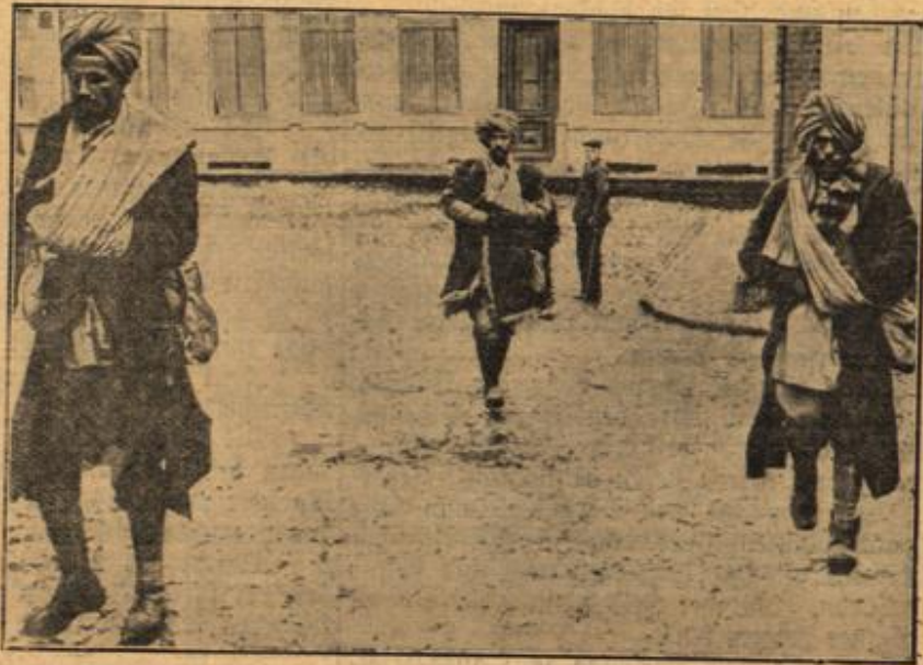
Verwundete Inder auf einem Spaziergang in einer französischen Stadt.

die f. St. durch österreichische Instruktionsoffiziere ausgebildet wurden und jetzt der persischen Armee sehr gute Dienste gegen England und Rußland leisten werden. Leider waren in den letzten Jahren Instruktoren aus andern Ländern in Persien durch den Einfluß Englands und Rußlands tätig und werden wohl auch dort nicht gerade gegen diese beiden Länder gearbeitet haben, so daß Persien hart auf die Hilfe der Türkei rechnen muß.