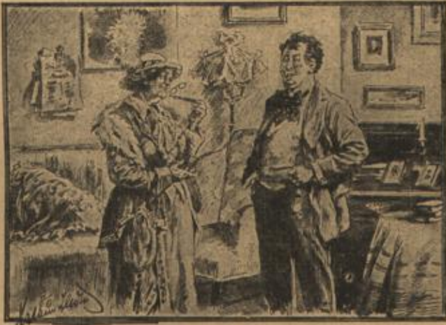
Die Naive. Eine Schauspielerin will bei einem Direktor Anstellung suchen. Auf die Frage, für welche Rollen, entgegnet sie: „Für jugendliche Naive!“ Der Direktor fragt vor Entsetzen in die Höhe: „Jugendliche Naive?“ fragt er, „wie wollen Sie die denn spielen?“ „Na,“ entgegnet ziemlich lässig die Angeredete, „nachdem ich sie nun fünf- undzwanzig Jahre lang gespielt habe, werde ich doch wohl wissen, wie!“

Sie störe ihm das Zusammenspiel. Hans von Bülow war bekanntlich der reizbarste Kapellmeister, den man sich denken kann. Ein Nichts genügte, um ihn zum Ausbrausen zu bringen. Das erfährt eine vornehme Dame in Hannover, wo Herr von Bülow eine Zeitlang das Orchester leitete. Es war heiß im Konzertsaal, und die Dame sächtete sich energisch Kühlung zu. Auf einmal bemerkt sie, daß der Dirigent sich wütend im Saale umsieht, endlich bei ihrer Loge halt macht und ihr drohende und sehr ärgerliche Blicke zuwirft. Sie wundert sich darüber, begreift aber den Sinn dieser Blicke nicht und schüttelt ruhig weiter. Da schrat sie auf einmal nicht wenig zusammen. Herr von Bülow schlenkerte seinen Taktstock zur Erde, die Musik schwieg still, und angelichts der ganzen Versammlung brüllte der Konzertmeister sie an: „Madame, wenn Sie sich schon lächeln müssen, dann richten Sie sich wenigstens mit Ihrem höflichen Lärm nach dem Takt!“ C. D.