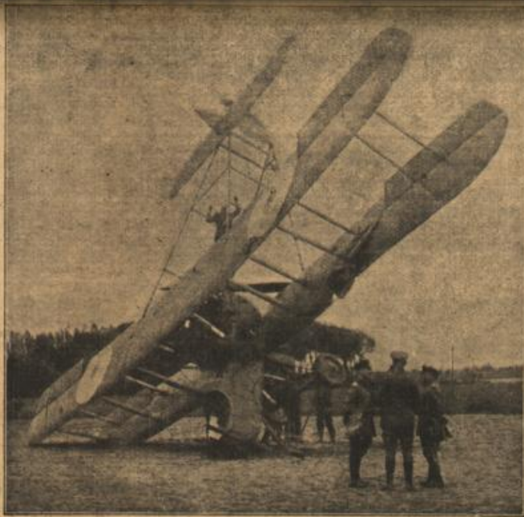
Ein in der Nähe von Lille zum Landen gezwungener englischer Vaders-Doppeldecker.

ihr Blut schneller pulsieren, daß die Schläfen nur so hämmerten, und als der Akt beendet war, konnte sie ihre Erregung kaum noch bemeistern.