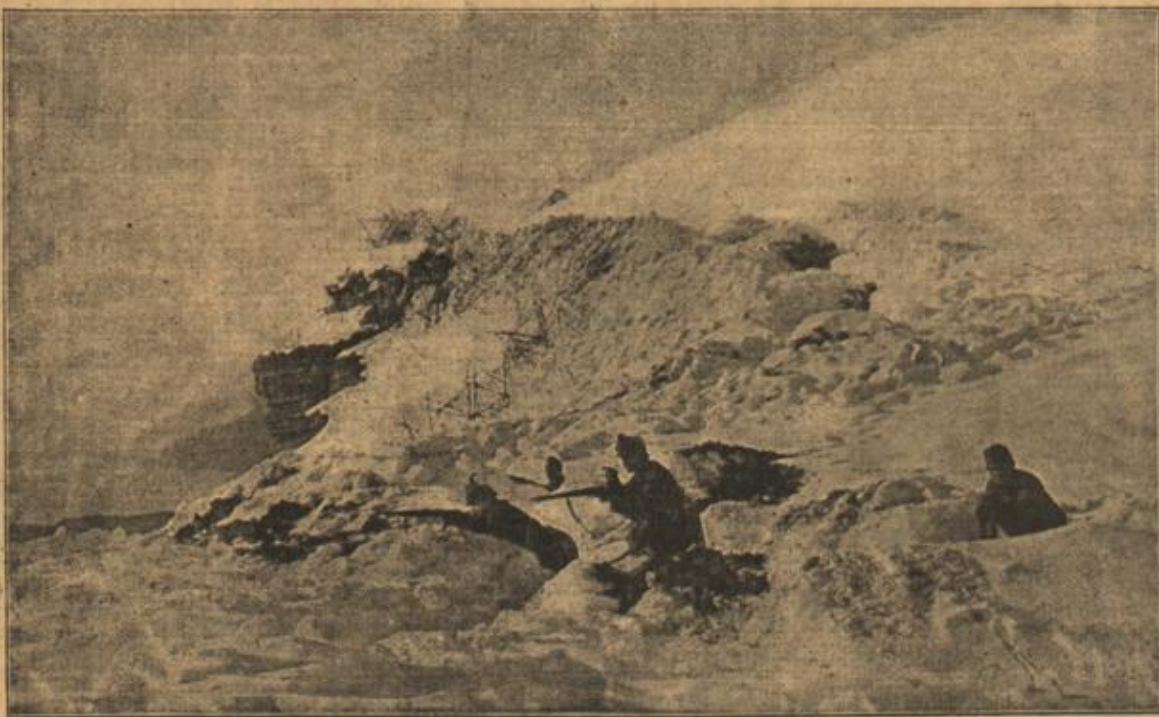
Österreichisch-ungarische Infanterie in einer schwer erlämpften Stellung in den Waldkarpathen.