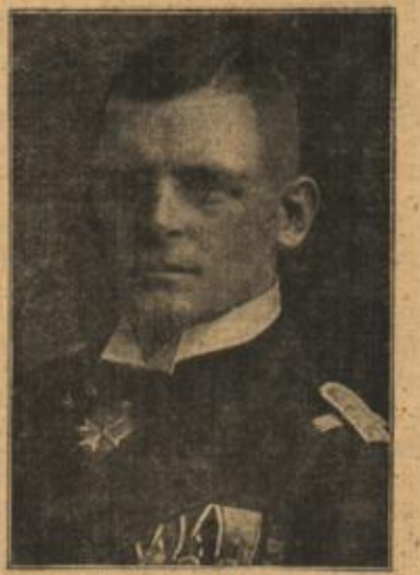
Kapitänleutnant Valentiner. (Mit Text.)