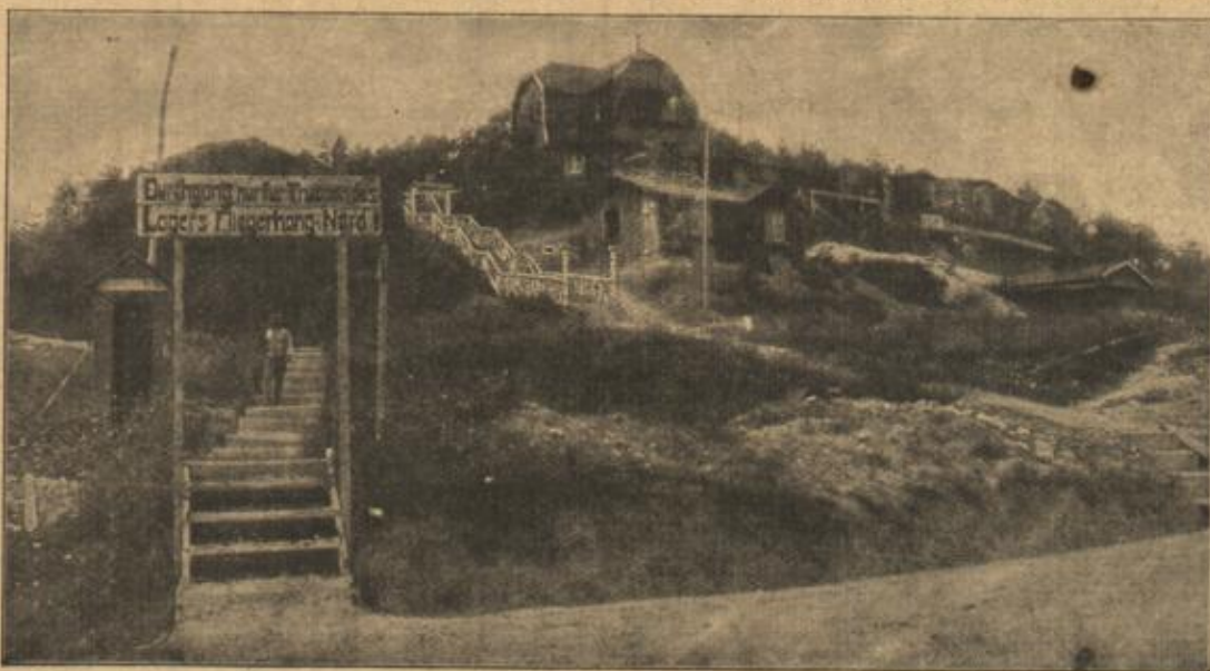
Ein von Feldgrauen Baukünstlern errichtetes Lager einer Feldfliegerabteilung auf dem westlichen Kriegsschauplatz.

Deutscher, französischer und englischer Soldat bei Verteilung der Post unter Aufsicht eines Schweizer Soldaten.