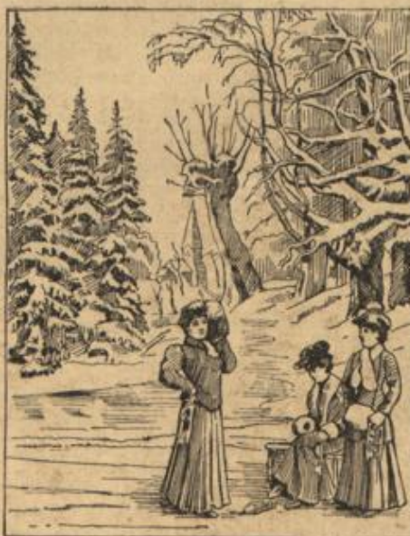
Wo ist denn der Fährbahnfeger?

dannen. Nur der Abschied von dem alten Haus, von den lieben, alten, traulichen Räumen, in denen man so viel Lust und so viel Weh erlebt hatte, er wurde allen drei schwer. (Fortsetzung folgt.)