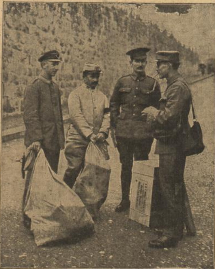
Die Post der in der Schweiz internierten Kriegsgefangenen verschiedener Staaten:

Sie hatte den guten Friß Jensen ganz vergessen und aus dem