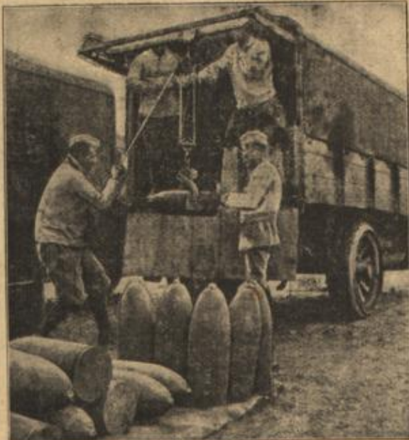
Französischer Transportwagen für schwere Geschosse. Das Verladen der Geschosse.