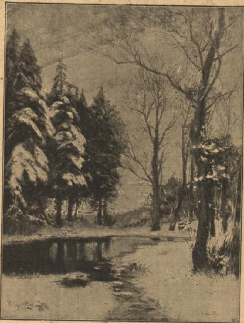
Winterabend. Von F. Hoffmann-Fallerleben.

Eine große Anzahl überseeischer Montanaktien, die im Besitz