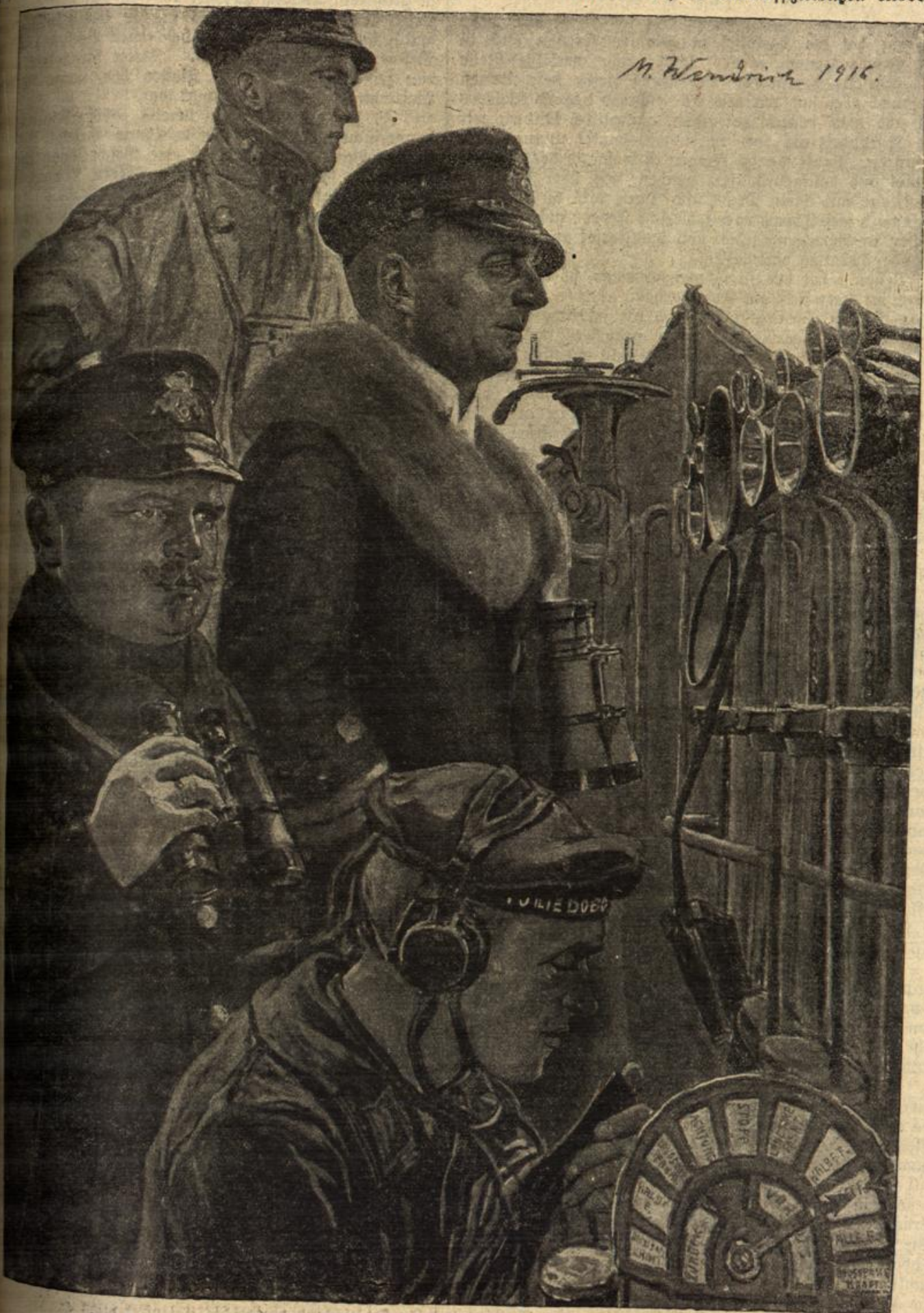
Von der Deutschen Kriegsmarine: Auf der Kommandobrücke eines Torpedoboots-Zerstörers.

ans Land, keiner ist zurückgekommen. Das Eis hat | furjus zugelassen und habe mir in jener Nacht, als ich so darüber dann wieder geschlossen, der anhaltende Frost | glücklich entronnen war, die Unteroffizierslizen erworben.