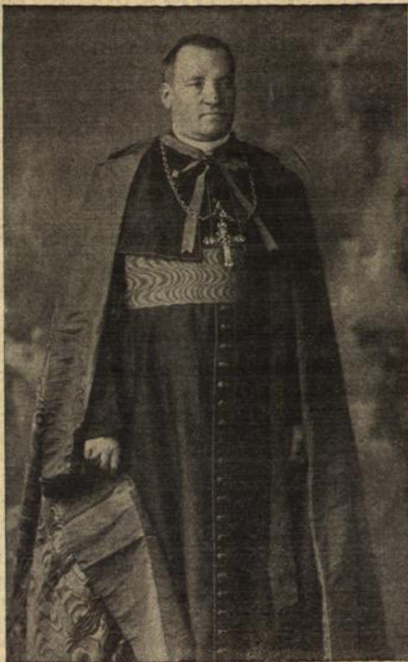
Kardinal Dr. Franz von Bettinger, Erzbischof von München-Freising, †.

„Ist es nun gut, daß ich Malerin geworden?“ dachte Lydia. „Ein Beruf, der nur wenigen wirkliche Erfolge brachte.“