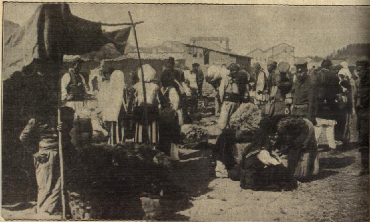
Vom Balkan-Kriegsschauplatz: Unsere Feldgrauen auf dem Wollmarke in Uestüp.

Augen Alexander voll warmem Interesse auf Ihr war wie einem Kinde dem brennenden Weihnachtszinnute. Ihre ivo Freude an kleinsten machte auf verwöhnten, chen Mann es günstigen Ent Der Vater ihm zwar die Braut stimmt, die ter seines pagnons, die che Brasilianer