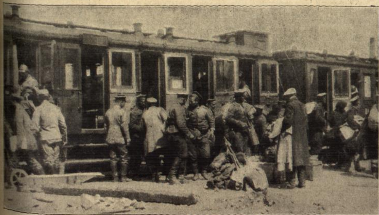
Vom rumänischen Kriegsschauplatz: Ankunft deutscher und bulgarischer Soldaten in einer Etappenstation der Dobrudscha.

ersten Tage unserer Anwesenheit in Berlin Majestät die Deutscher Kaiser in der Nähe.“ Freude über die Kaiserin. „Vielleicht ist der Kaiser nur Thret- er Hofe gekommen.“ „Wir wollen so arrogant sein und dies annehmen,“ sagte den,“ der Kaiser lachte, daß seine weißen Zähne zu sehen. „Ein bißchen Arroganz schadet nichts. Mit Bescheiden- heit kommt man heute nicht weit. Oder glauben Sie, Kaiserin? Schauen Sie meinen Vater an. Wäre er