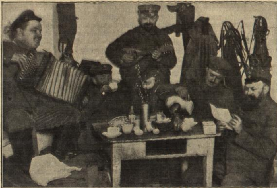
Osterfeier hinter der Front: Unsere Feldgrauen am Ostersonntag.

Lydia errötete leicht, dann sagte sie, den Assessor voll anschauend: „Danke, es geht allen gut. Vater und Mutter sind immer auf dem Posten gewesen, nur unsere Ilse hat die Eltern heftig erschreckt.“