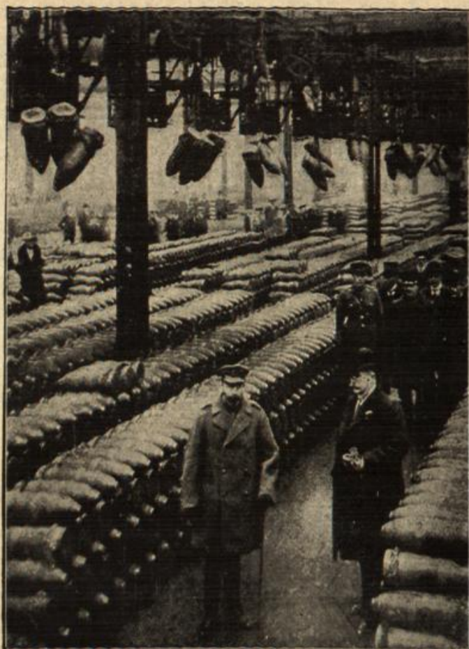
König Georg V. von England besucht eine englische Munitionsfabrik. (Nach einer englischen Darstellung.)