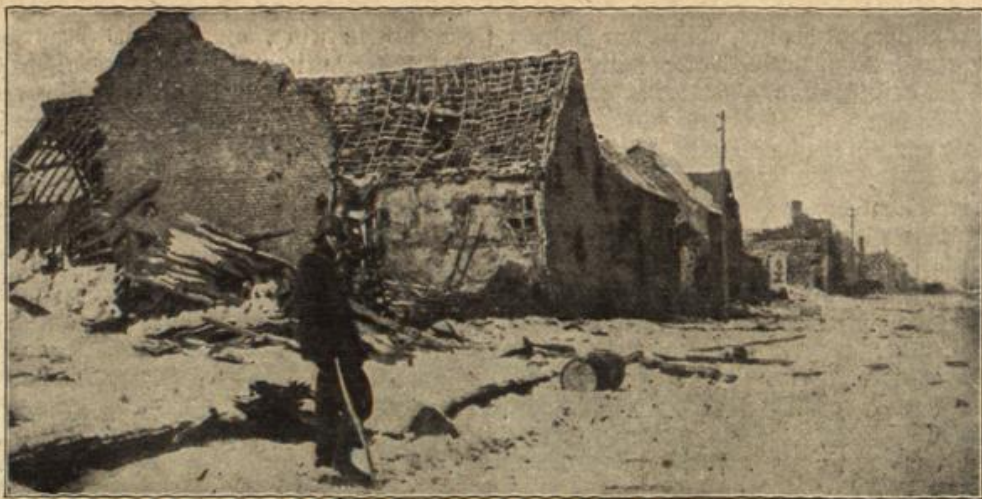
Vom westlichen Kriegsschauplatz: Vom Somme-Kampfgebiet: Zerschossene Häuser in Le Transloy an der Straße Bapaume-Peronne.

„Ein echter Mann vom besten Schrot und Korn,“ so hatte der alte Onkel seinen Aeltesten bei Margot eingeführt. Diese mußte ihm recht geben. Es war so schön, neben ihm zu sein, dabei die wunderbare Musik zu hören und zuweilen die braunen