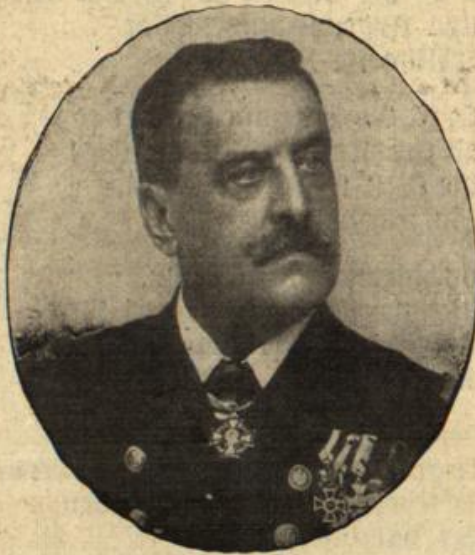
Vizeadmiral von Kaiser

der Nachfolger des Admirals Haus als Chef der Partitions- sektion des österreichisch-ungarischen Kriegsministeriums.