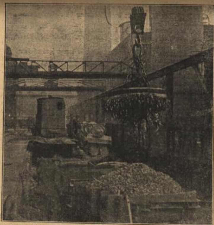
Elektrischer Magnetkran beim Beladen von Eisenspänen. (Mit Text.)