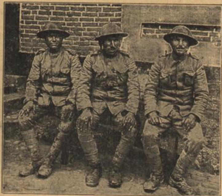
Die ersten an der Westfront gefangenen Portugiesen. (Mit Text.)

Die Kommerzienrätin hatte sich natürlich schon vorher mit den Herren in Verbindung gesetzt, damit nicht durch Eifersüchtlichen Unzufriedenheit oder gar Streit entstände. Ubrigens sollten die Herren in der Reihenfolge ihrer Anfangsbuchstaben wählen. Für den jungen Doktor hatte Frau Isa natürlich Ilse bestimmt. Büßing hatte hierbei seiner Gönnerin die Absicht mitgeteilt, sich bei dieser günstigen Gelegenheit Ilse zu erklären. Mit Bruno hatte seine Mutter am Morgen dieses Tages einen