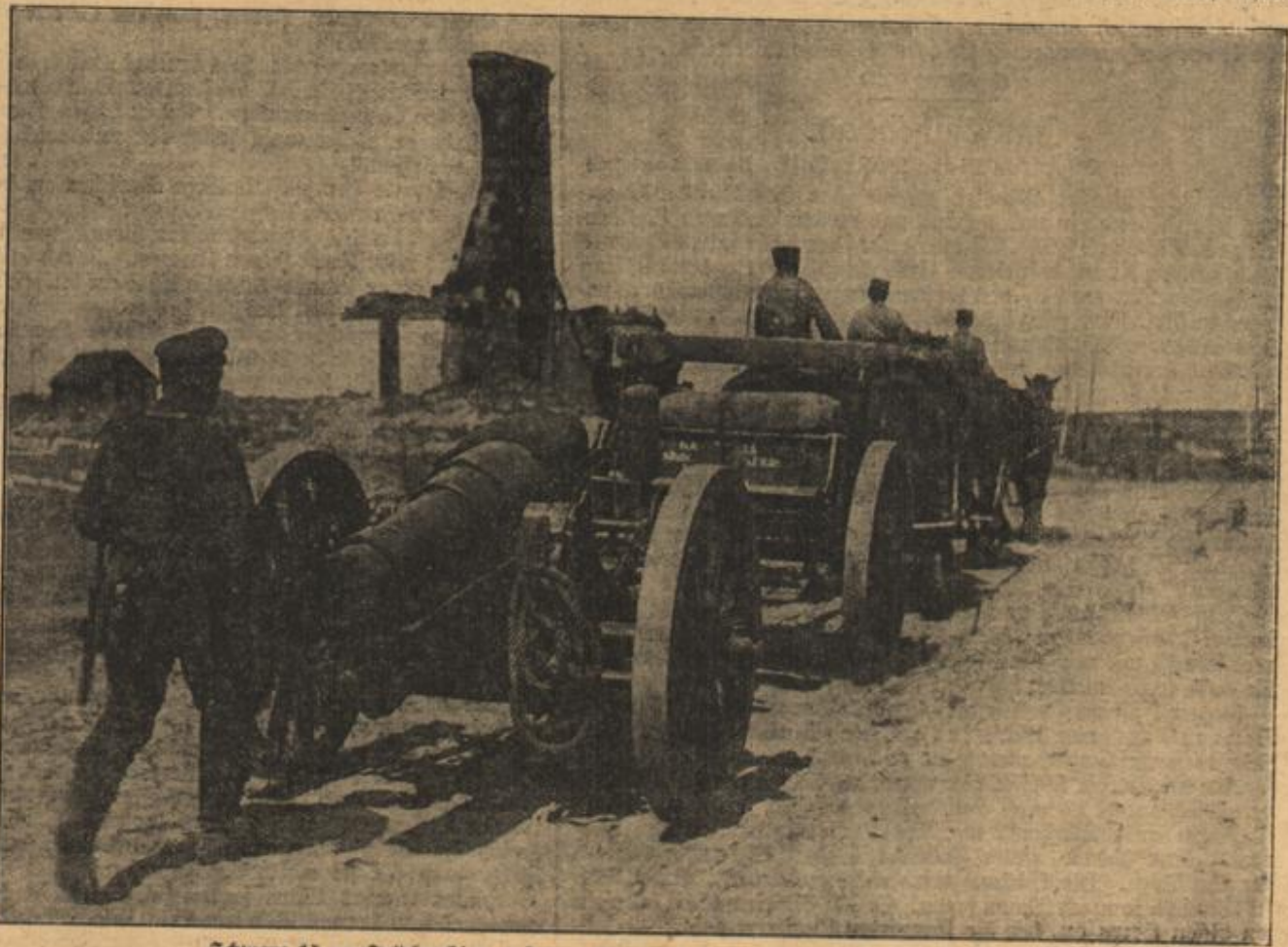
Schwere 15 cm-Feldhaubitz auf dem Wege zur Front.

kleinen Strauß ausfechten müssen. Bruno war nämlich der Ansicht, daß hierbei die beste Gelegenheit sei, sich mit Ilse auszusöhnen, die nichts mehr mit ihm spräche und die verschiedensten Versuche, die alten, freundlichen Beziehungen wieder anzuknüpfen, entschieden abgelehnt hätte. Frau Isa hatte ihm aber in recht entschiedener Weise ihren