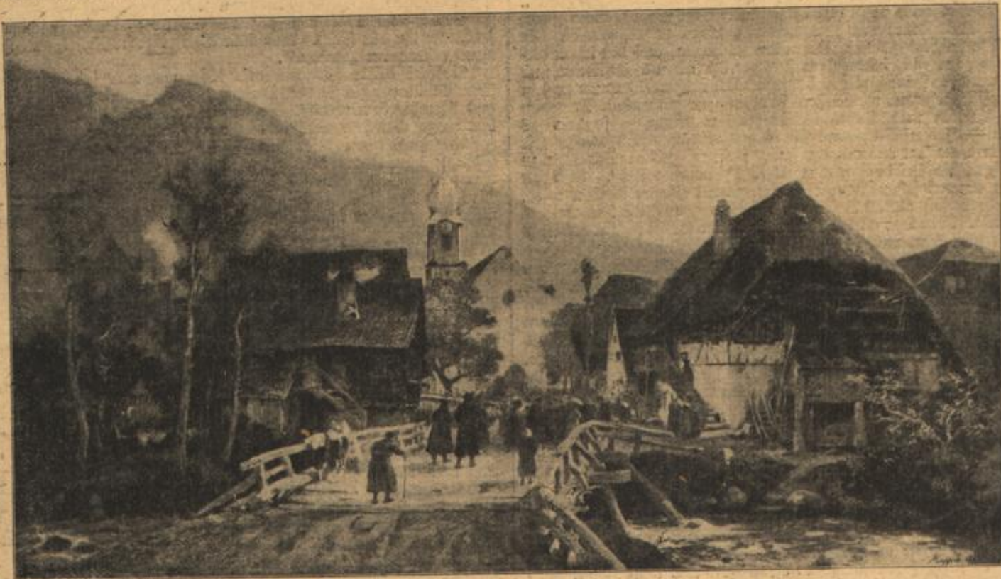
Gutach im Schwarzwald. Nach dem Gemälde von A. Kappis. (Mit Text.)

„Oh, das wissen Sie ganz gut, mein Fräulein. — Ich wünschte,