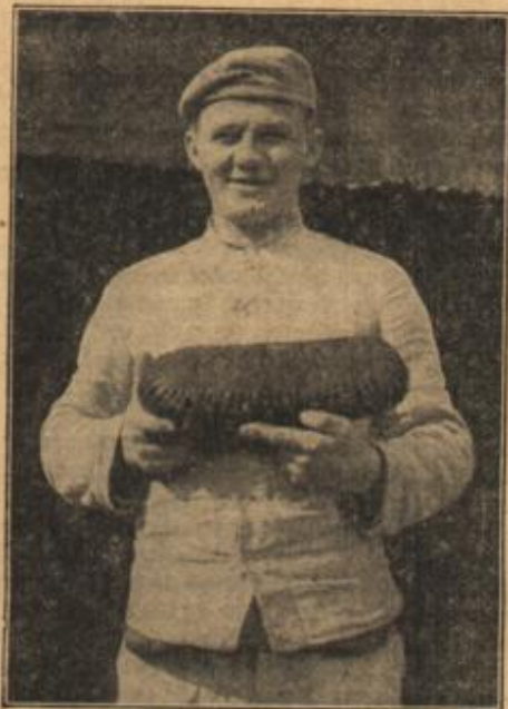
Das 7000 000. Brot einer Feldbäckerei-Kolonie an der Westfront.

Ja, er hatte das Leben frühzeitig ohne Illusionen ansehen gelernt und sich sehr bald von den wenigen frei gemacht, die seine Jugend mit sich brachte. Zuerst hatte er natürlich Jus studiert. Aber seine Nei-