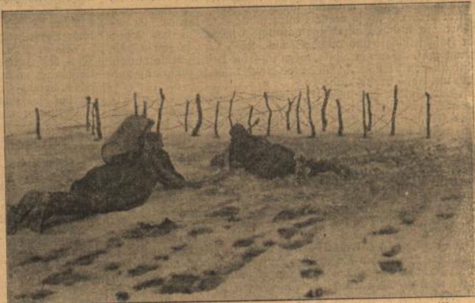
Kammener-Schlepppatrouille bei der Zerstörung feindlicher Trabthindernisse.

Ganz nahe trat sie nun zu dem Alten und kniete vor ihm nieder, seinen Kopf zu sich heranziehend. „Du, Vater, ich weiß ja nicht, wie