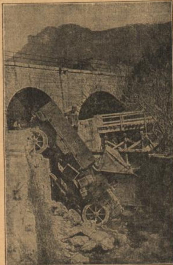
Ein Opfer des Gebirgskriegs: Abgestürztes Automobil auf dem italienischen Kriegsschauplatz.