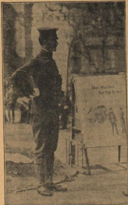
Ein Soldatenwerber in den Straßen Neuports. (Mit Text.)

steller, zjubeln und sich glücklich preisen, daß er sie nicht für