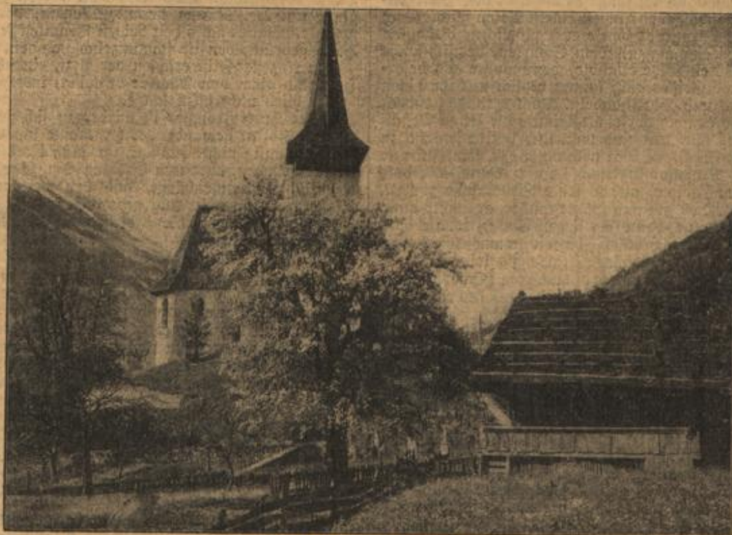
Frühling in Frutigen. (Mit Text.)

Der Professor schüttelte den Kopf und antwortete, er habe den alten Thomas deutlich gesehen, genau so gekleidet, wie auf dem Bild im Direktorenzimmer.