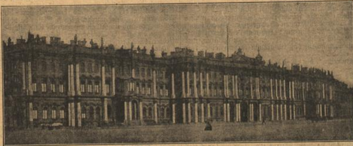
Der Winterpalast des abgeleiteten Jaren in Peterburg. (Mit Text.)

ihrer Kunst gelang, den Inhalt des Stückes voll auszuerschöpfen. — Wenn es ihr gelang! Es mußte gelingen! Ihr ganzes Glück hing davon ab. Berühmt würde sie dann werden und Glanz würde sich um den Namen Ada de Ruyter legen.