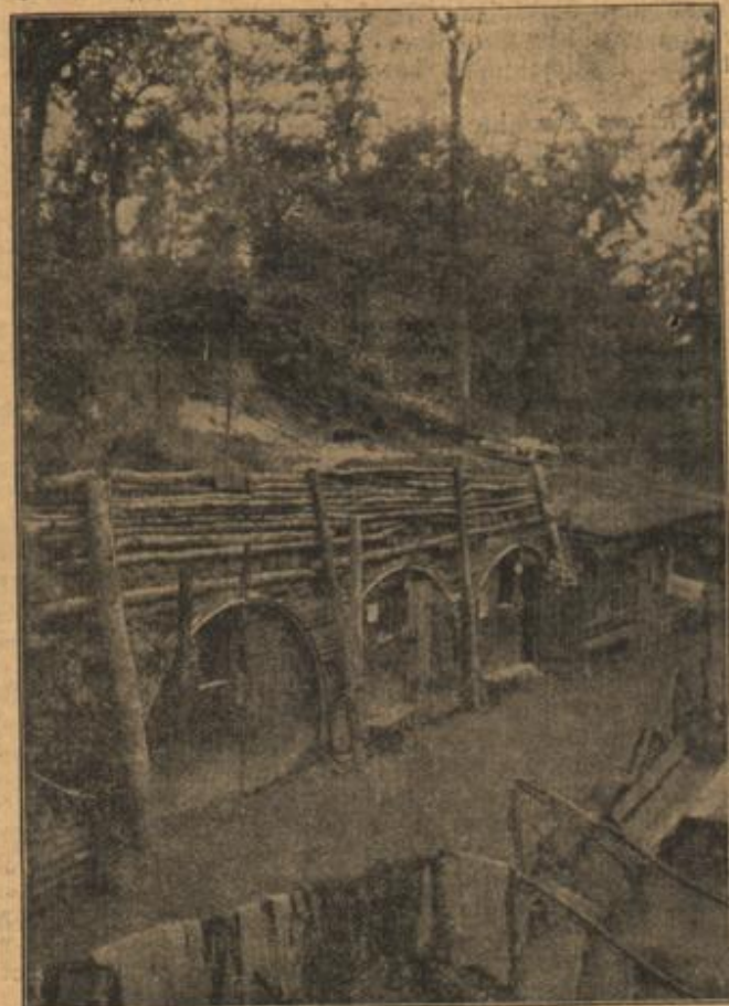
Unterhandobanten im Walde: Die Villa des Stabes.

„Wir gehen aber bald wieder nach Holland zurück“, hatte sie hinzugefügt und Welschmann nahm die Bedingung gerne an, ein so unbeschreiblich schöner Kopf würde ihm doch niemals wieder im Leben begegnen.