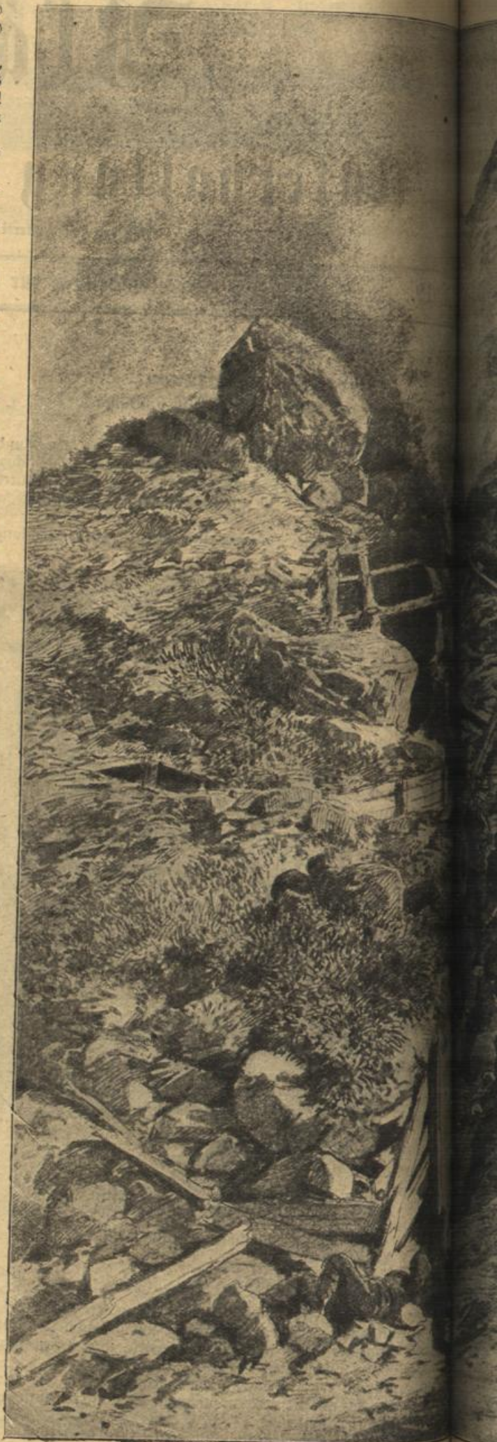
Originalzeichnung von H. Kargl.

Heilwig suchte ihr zu besänftigen; aber je später es wurde, ohne