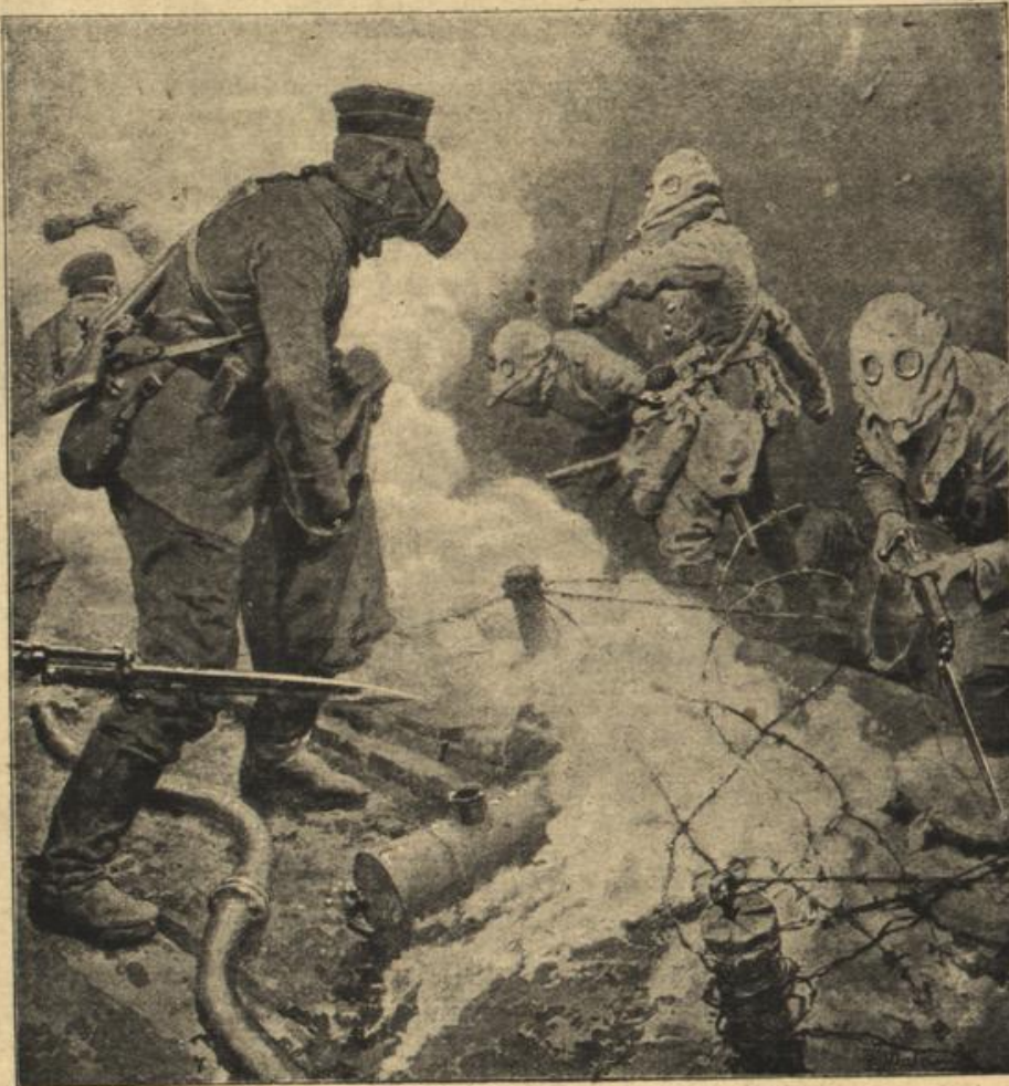
Mit Gasmasken und Handgranaten.

„Sie wissen auch über mich Bescheid, Prinzessin. Ich bin froh darüber. Als ehrlicher Mann hätte ich Sie sonst ausführlich in Kenntnis setzen müssen von dem, was war. So bedarf es nur der Ergänzungen, und die sind schnell gegeben und kommen aus offenem Herzen. Ich habe geliebt, das wissen Sie. Ich wollte eine Vereinigung erzwingen, und es wäre mir auch gelungen, denn wer durfte mich hindern, meinen Willen durchzusetzen, wenn ich auf die Vorteile meines Standes verzichtet hätte. Da redete mein Bruder, der König, mit mir ein offenes Wort. Was wir seien, verdankten wir denen, die vor uns waren, und das lege auch uns Verpflichtungen auf gegenüber dem Volke, das ein Recht habe, von uns zu fordern, daß wir nicht das Land aus Egoismus in Unruhe stürzten, wie es eine Erbfolge an ein anderes Geschlecht mit sich bringen müsse. Er habe nur einen Sohn, sagte der König, und es seien keine Aussichten vorhanden, daß er noch einmal Vater werden könne. Wenn der Kronprinz kinderlos sterben sollte — es sei doch keine Unmöglichkeit — was dann? Um des Landes willen dürfe ich keine morganatische Ehe eingehen, möge die Dame, um die es sich handle, noch so ehrenwert sein. Dies, Prinzessin, betone ich besonders. Die Pflicht ruft. Sie fordert mit Fug und Recht. Ich habe hart mit mir kämpfen müssen, nervös war ich geworden, gab nicht acht, stürzte mit dem Pferde, brach mir eine Rippe und ging nach Baden-Baden. Allmählich,