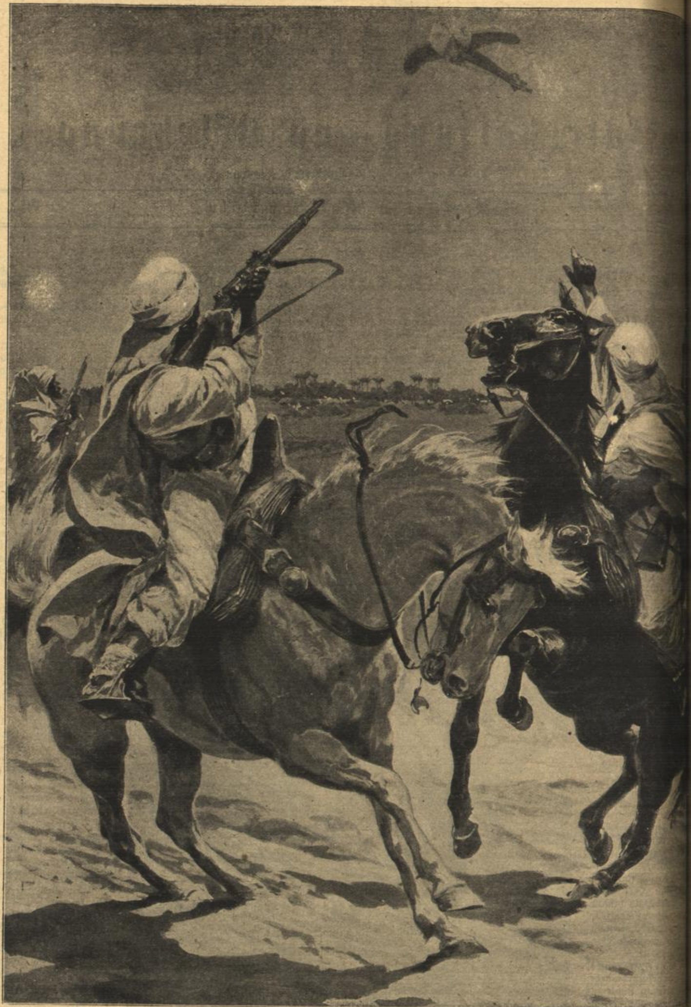
Beschießung eines englischen Kampfflugzeugs durch Araber.

so rück zu jener die Ad leichter fennen dürfen Ihnen und di Tag fo Prinz und weiß, Prinze Der nur die Da Erüber gemütl vor ihr Sie ho Da eine M Sie Dann f an. B glänzte Hände noch in Bei tadel ve Stoffe lobung nicht, Jemgar Prinzen