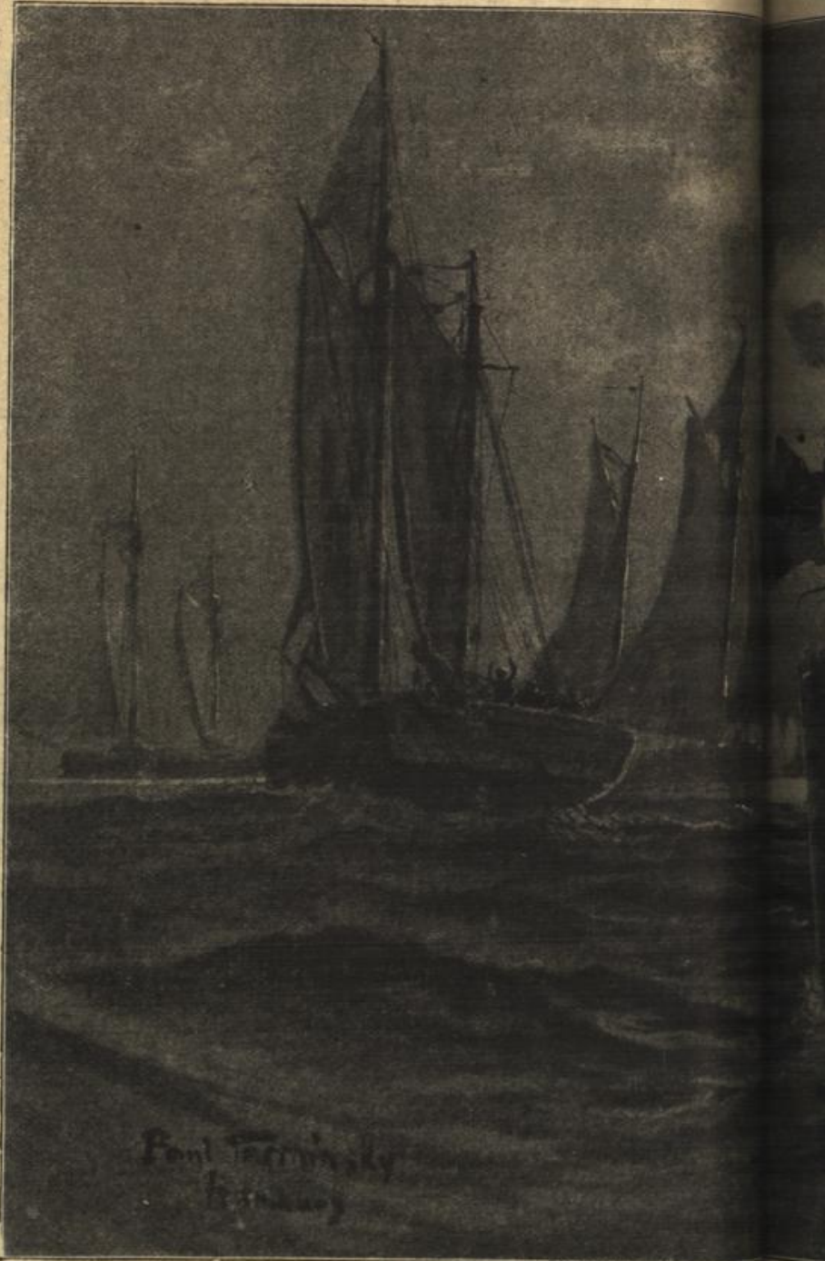
Störung englischen Fischfangs nördlich von Island Nach einer Originalzeichnung

„Was!“ Prinz Karl Ernst richtete sich hoch auf. Er sah, wie leicht es der Dame war, die Angeberin spielen zu müssen, aber es war ihre Pflicht, er verstand sie und hatte ihr nur zu danken. Mit einem Male sah er klar. Wer hatte ihm denn immer mit diesem Batlaw in den Ohren gelegen? Irmgard! Die Einladung zum Frühstück war auch auf sie zurückzuführen. Aber immer noch wollte er nicht recht an die Tatsache glauben. „Sind Sie Ihrer Sache ganz sicher, Fräulein v. Kanzlow?“ fragte er.