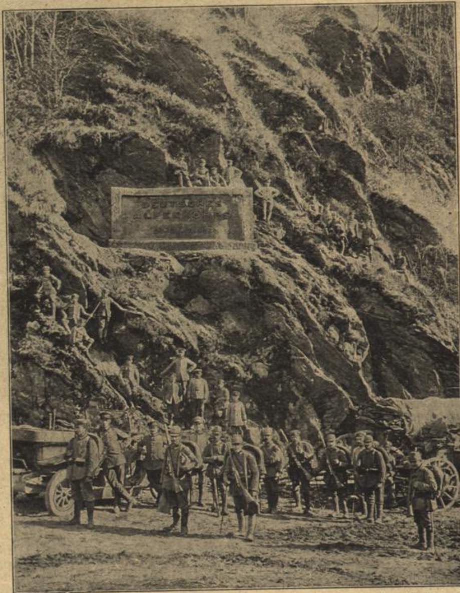
Gedenktafel des deutschen Alpenkorps am Eingang des Roten-Zurms-Passes.

Watlaw schlug nur die Hacken zusammen. Er ärgerte sich immer mehr, daß er sich zur Vorstellung bei Hofe hatte breit schlagen lassen. Nun wurde er in den Trubel hineingezogen und kam aus ihm nicht wieder heraus. Das stand fest, daß sich der Prinz noch in diesem Winter bei ihm zur Jagd anbot, er wurde dafür in den intimen Kreis Seiner Großherzoglichen Hoheit gezogen, mußte dann bei Pontius und Pilatus Besuche machen. Das waren Aussichten, die Watlaw als ganz schauerhaft empfand.