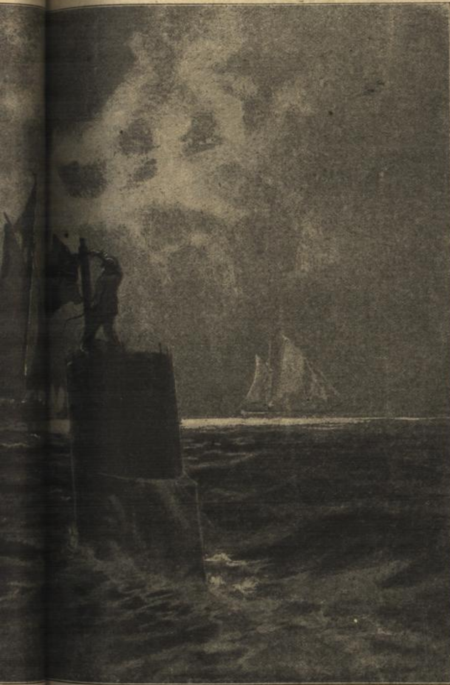
ein deutsches Unterseeboot (S. 28).

Großherzogliche Hoheit wollen geruhen — Die Hofdame stand dicht neben der dem Zug wie geistesabwesend