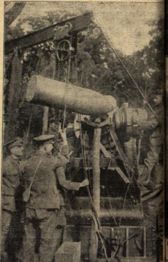
Munitionszufuhr für ein englisches 38-cm-Geschütz an der Westfront. (Mit Text.) (Genstert Generalstab.)