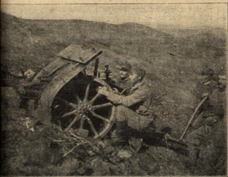
S. u. f. Gebirgshaubige auf dem Balkankriegsschauplatz.

...st du ihn etwa als Mottenfutter im Spind hängen lassen? | Na kurz und gut, — nach einer Viertelstunde war so ein Tröbler