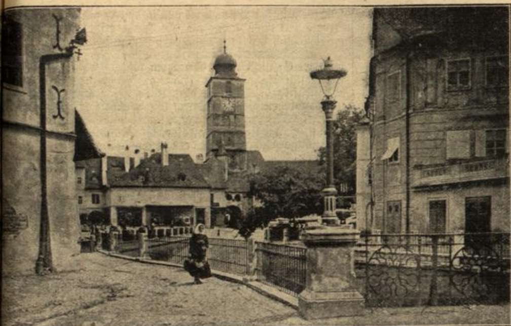
Die von den Rumänen befreite siebenbürgische Hauptstadt Hermannstadt.