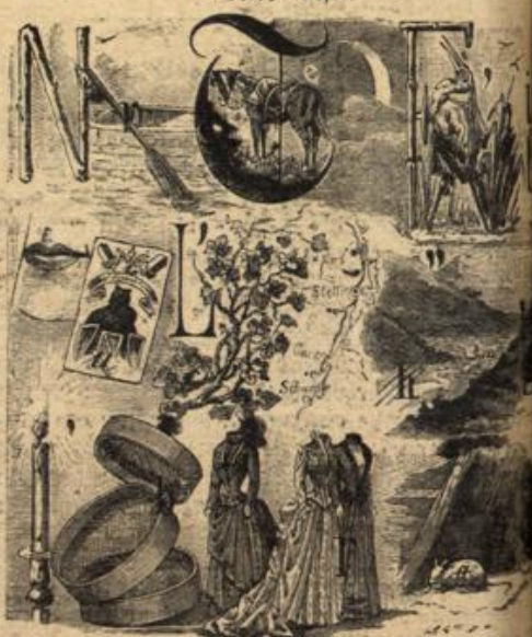
Auslösung folgt in nächster Nummer.