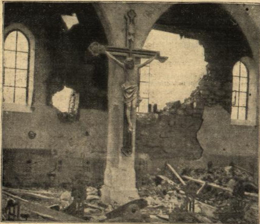
Eine Kirchenruine im Kampfgebiete der Somme.