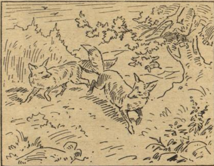
Der Förster ist heute weit weg, da können wir spazieren gehen!

Für den Anfänger kommt verständlich eine Masse in Nacht, die schnell wächst, beste Fähigkeit besitzt und äußerst reuchlos ist. Alle diese Nut- schaften setzen eine gute Gesundheit voraus; denn nur Tier, das die nötige Lebens- befeht, kann leistungsfähig produktiv sein. Es können also nur Rassen Frage kommen, die sich in erster Zeit körperlich hoch ent- wickeln, also möglichst groß wer- und, um der Mastfähigkeit umung zu tragen, viel festes Fleisch ansetzen. Ferner solche, in bezug auf Wartung und Pflege außer regelmäßiger rätlicher Fütterung und ordent- licher Stallreinigung keine wei- chen Ansprüche erheben. Als solche ausgesprochenen Leistungsmerkmale gelten deut- lich, das russische und das bel- gische Rieskaninchen, sowie das französische Widderkaninchen. — Die Tiere sind alle schnellwüchsig und erreichen ein Gewicht von sechs bis sieben Kilo. Ein Gewicht, das sich annehmen läßt. Hat man nun von einem Zuchtpaar im Laufe des Jahres eine Würfe mit durchschnittlich fünf Jungtieren, die im schlacht- mäßigen Alter von fünf bis sechs Monaten auch nur sechs Pfund Fleisch abgeben, so hat man über einen Zentner Fleisch äußerst geringen Kosten produziert, von dem die Familie einen Teil selbst verbraucht und den andern zu guten Preisen absetzen kann. (Schluß folgt.)