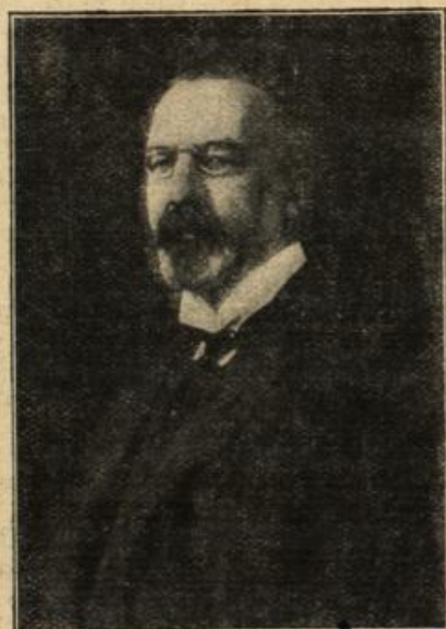
Graf Saurgh, österr. Ministerpräsident. (Mit Text.)

...st du ihn etwa als Mottenfutter im Spind hängen lassen? | Na kurz und gut, — nach einer Viertelstunde war so ein Tröbler