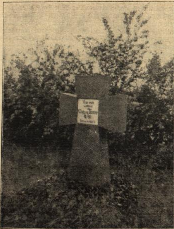
Von der deutschen Heeresverwaltung seit kurzem angeschaffte Kreuze aus Beton für Soldatengräber. (Mit Text.) (Genstert Generalstab.)

Es zuckt mir in allen Fingern. Gar zu gern möchte ich meinen alten Freund ein wenig streicheln, oder mal meinen Kopf an das weiche, schöne Futter anlehnen, — aber nein, es geht nicht, — der eckhafte Kerl nebenan stört mich, — diese stahlgrauen, harten Augen, die mich so von der Seite her anstarren, sie erschrecken