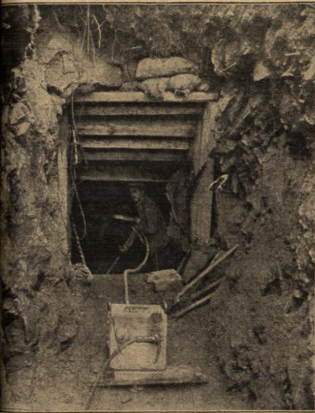
Minenkämpfen in den Vogesen: Elektrischer Gesteinsbohrer am Felsen. (Zensiert Generalstab.)

nen vergarn rückte tarrte in ein url, s am Das ge er, die mit alle Nutt Nicht das in, u lein, b eine achte elt. S cau B Berg sie e Arben von J ch dem dem hre J