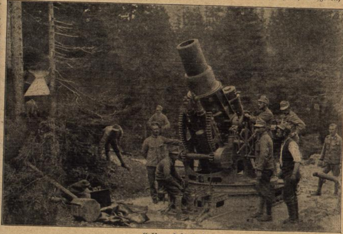
Grüße nach Italien!

einer öffentlichen Verlobung! Das ist mein letztes Wort!" hörte Susi ihren Vater mit erhobener Stimme sagen, zugleich entstand droben ein Stührrücken und eilig trat Susi den Rückweg an. Das Aufwärtsklettern war viel leichter und eine Minute später stand sie atemlos im Wohnzimmer und schlüpfte eilend in den Kleiderrod. „Mutter kann jeden Augenblick kommen“, rief sie hervor und eilend nahm man die Arbeit auf. „Referendar Luzius war's! Es scheint faul zu stehen, Erna! Aber es wird sich schon deichseln, großartig ist er Vatern gegenübergetreten! Nachher erzähle ich dir alles!“ flüsterte sie hastig; denn man hörte Frau Eltens Stimme im Vorplatz und gleich darauf das Aufschließen der Stubentür. „Erna! Vater wünscht dich zu sprechen! — Deine Verlobung entwickelt sich ja ganz so, wie wir gefürchtet haben!“ fügte sie mit einem vernichtenden Blick hinzu. „Ich komme sofort, Mutter!“ sagte das Mädchen leise und legte das Wäschestück in den Korb. Da bog sich Susi über sie: „Nicht nachgeben, Erna! Er sagte, er würde nie von dir lassen!“ klang es flüsternd an ihr Ohr. „Vater wartet, Erna!“ rügte nun die Mutter, und Erna folgte dieser mit einem zuversichtlichen, glücklichen Lächeln in den ihrer wartenden Kampf. Im Zimmer des Vaters hatte ihrer eine Enttäuschung, Manfred Luzius war bereits fort. Die Eltern, besonders aber der Vater, sah so feierlich aus, daß sich ihr Herz sofort ängstlich zusammenschloß.