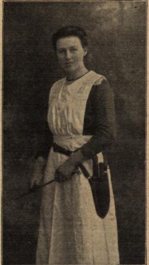
Der erste weibliche Fleischergehilfe in Deutschland. (Mit Text.)

In aller Eile holte sie ihre Brille herbei und löste, so schnell es ihren vor Aufregung zitternden Händen gelingen wollten, den mit einem Siegel verschlossenen Umschlag. Dann nahm sie das Schreiben heraus und ließ den vollen Schein der Lampe darauf fallen.