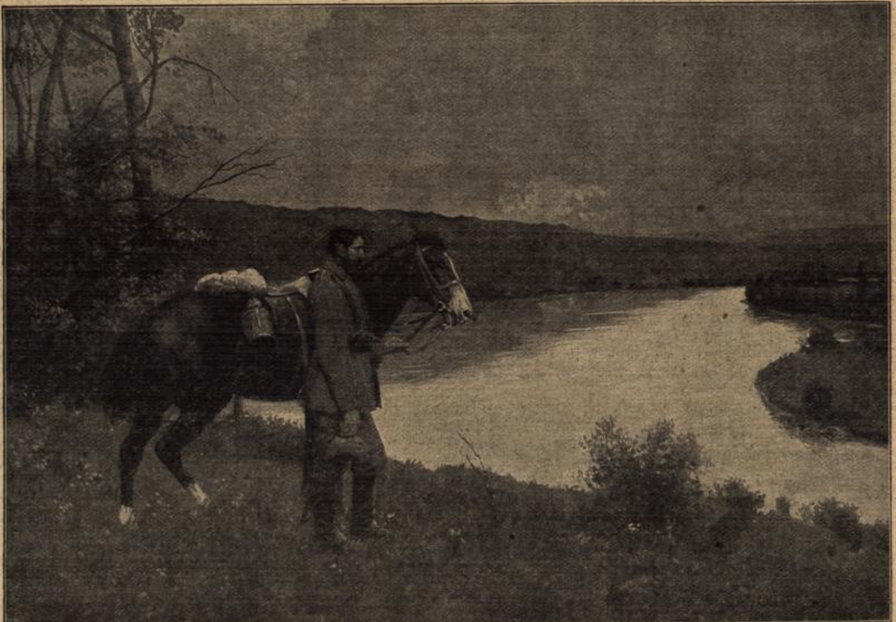
Abendgebet in Feindesland (Ave Maria). Von Prof. M. Baraschudts. (Mit Text.)

phil. m Gründ er im Baum ste, so wurde ig ihm ch ein hr je inge der sein Arb Söhne Bren Sen war. wo sein men los hatte er je all Tod trag unter legte orquel bethe anen — daß Welt zu zige ihm lehre, leite er nicht wie am ver werden, wieder am igeb m, von d san stehen flam be-