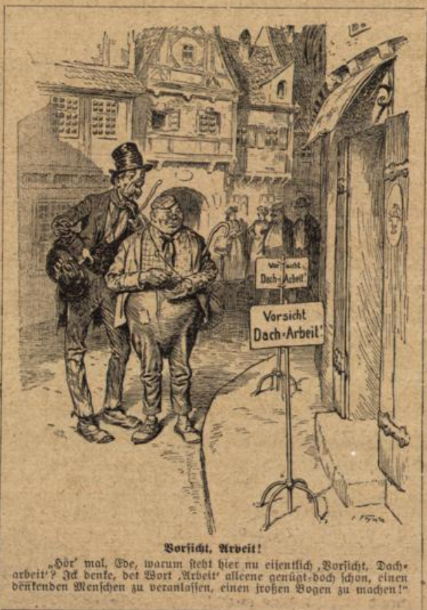
Vorsicht, Arbeit! „Hör mal, Ede, warum steht hier nu eigentlich ‚Vorsicht, Dacharbeit‘? Ich denke, der Wort ‚Arbeit‘ allene genügt, doch schon, einen denkenden Menschen zu veranlassen, einen trosten Hagen zu machen!“

Der höchste Gebirgssee Nordamerikas. Der höchste See Nordamerika ist der Chicago Lake in Colorado. Er liegt 15 Meilen an der Denver- und Rio Grande-Eisenbahn gelegenen kleinen Ortschaft. Die ersten 8 Meilen von Idaho nach dem See können als Fährweg zurückgelegt werden; von da ab beginnt aber ein sehr steiler Bergpfad, auf dem jedoch ein Reiter ein Pferd benützen kann. Eine Tour erfordert sich eine Reihe von Naturbildern. Der Chicago Lake liegt 11 Meilen über dem Meeresspiegel. In der Nähe befindet sich der 14 340 Fuß hohe Mount Elbert, der ewigem Schnee bedeckte Mount