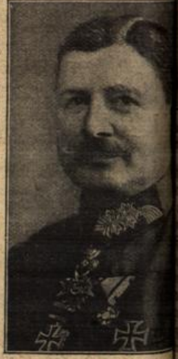
Generalmajor Dr. phil. Wilhelm Gröner, der militärische Vertreter im Reichsernährungsamt.

Schmerzes, der ihre Haare gebleicht hatte, überkam sie eine Schwäche, als ob auch ihre letzte Stunde angelautet hätte. Frau Braunhofer taumelte zurück vom Fenster und sank in den alten Kochkessel, der in der dunklen Zimmerede stand.