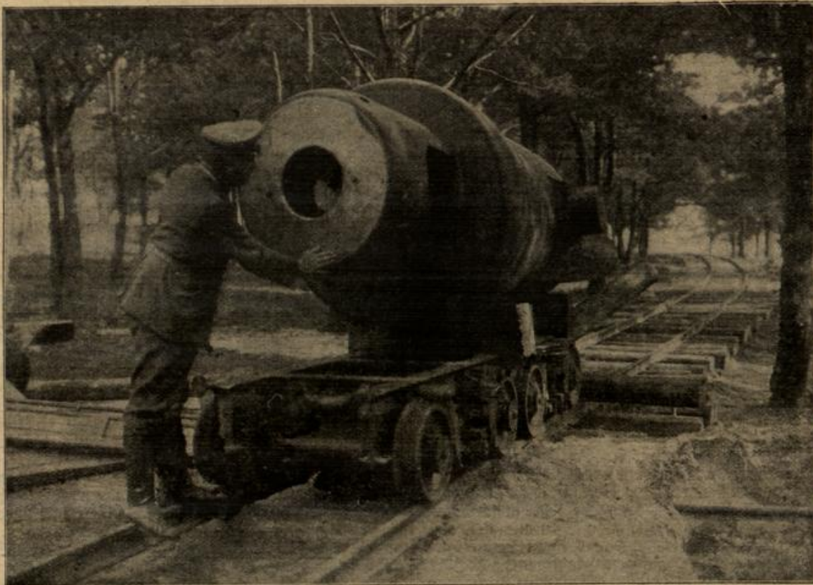
Deutsche Kriegsbeute: Riesenrohre russischer 28-cm-Geschütze aus der Festung Nowo-Georgiewsk. Die zerlegten Geschütze befanden sich auf dem Transport nach einem Festungswerk, als die Feste in deutsche Hände fiel.

Zu den Veranstaltungen der Kurverwaltung erschien sie nur selten. Und Einladungen aus den Kreisen der Gesellschaft zu Ausflügen und dergleichen lehnte sie stets kühl, wenn auch höflich ab. Dafür sah man sie jeden Morgen in aller Frühe ihre Wohnung verlassen und die Richtung nach dem Walde