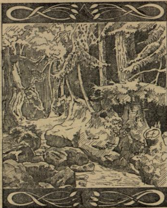
Wo ist der Landschaftsmaler?