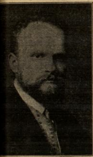
Ein Kriegsgefangener als Nobel-Preissträger. (Mit Text.)