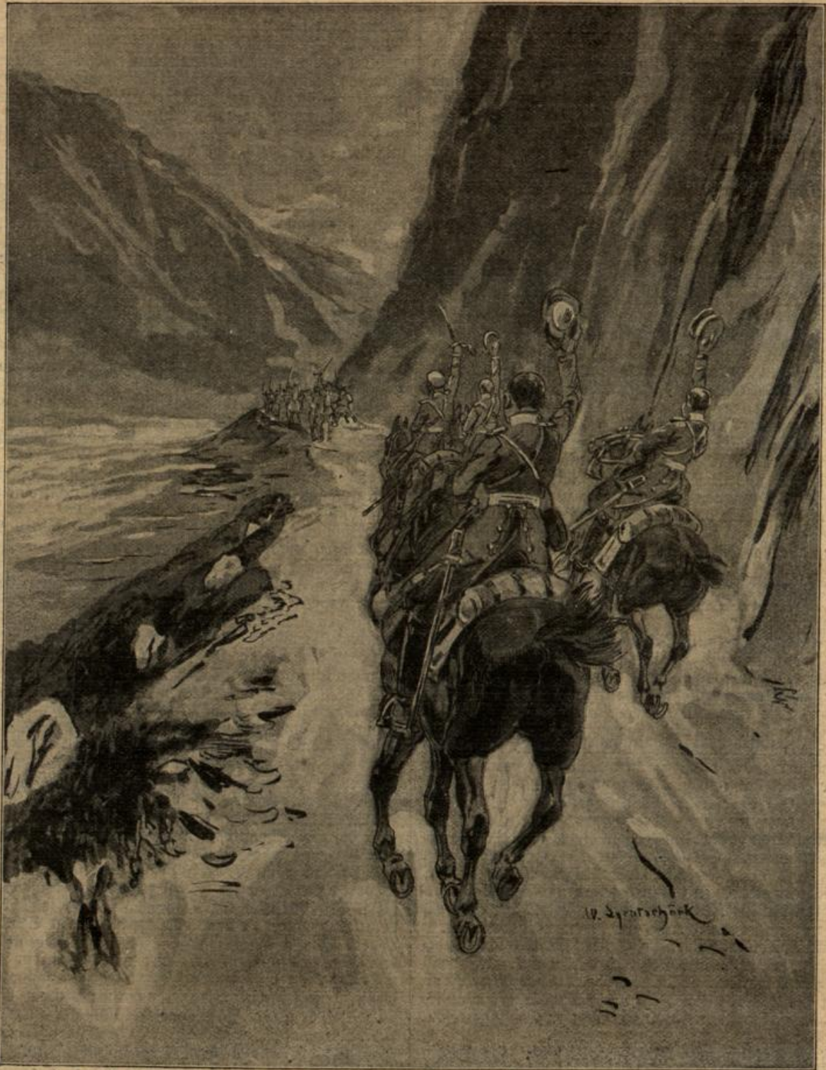
Das erste Zusammentreffen mit den Bulgaren. Gezeichnet von Walter Strytchöck. (Mit Text.)

Sie hatten sich beide erhoben während der letzten Worte und schritten nun nebeneinander durch den Wald, der Stadt. Und Frau von Zellberg dachte bei sich, daß sie hier vielleicht den passenden Leiter ihrer Fabrik gefunden habe, denn ihr Protokoll hatte keine Neigung, diesen Posten zu übernehmen. Er war schon vorgerückten Jahren und gedachte sich bald ganz zur Ruhe zu setzen. Aber sie vermied es feinfühlig, jetzt schon zu ihrer Begleiter darüber zu sprechen. Sie wollte nicht den Eindruck erwecken, als biete sie ihm die Stellung aus Mitleid an. Ne-