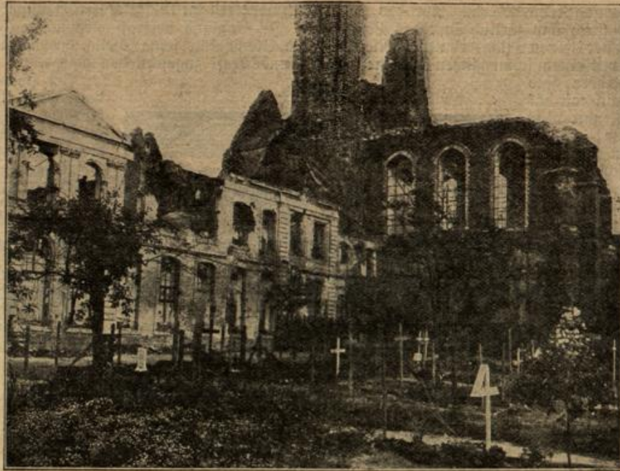
Das zerstörte Kloster Melk. Im Vordergrund deutsche Soldatengräber.

Alpenweiden werden in warmen Räumen feucht gehalten. Man kann das Wasser vorteilhaft in die Unterseger. Sind die Pflanzen einmal trocken dann kommen die Alpenweiden nicht mehr weiter, sondern sterben in Knollengrunderde.