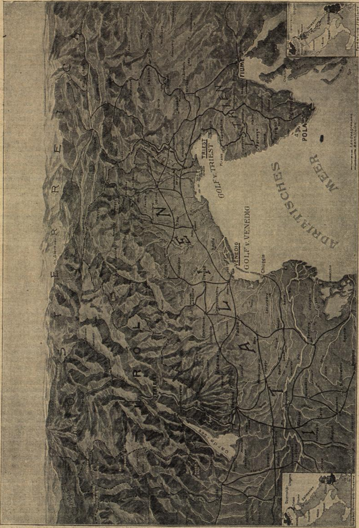
Der neue Kriegsschauplay im Süden. Gezeichnet von Walter Emmerleben.

mit denen er auf Leben und Tod kämpfen sollte. Und schön war das Land! Sapperlot! Hier Hopfengärten und da Hügel, mit Reben bepflanzt. Und das Obst! Und nun ging es an ein Marschieren. Hui, wie die Füße sumteten! Aber wenn da über die Köpfe hinweg etwas anders