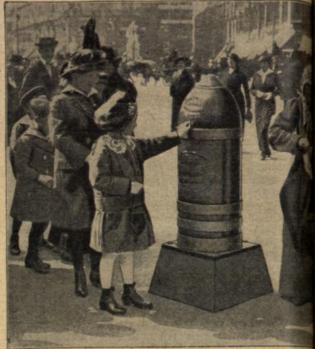
Liebesgaben-Zammelbüchsen in Budapest. (Mit Text.)