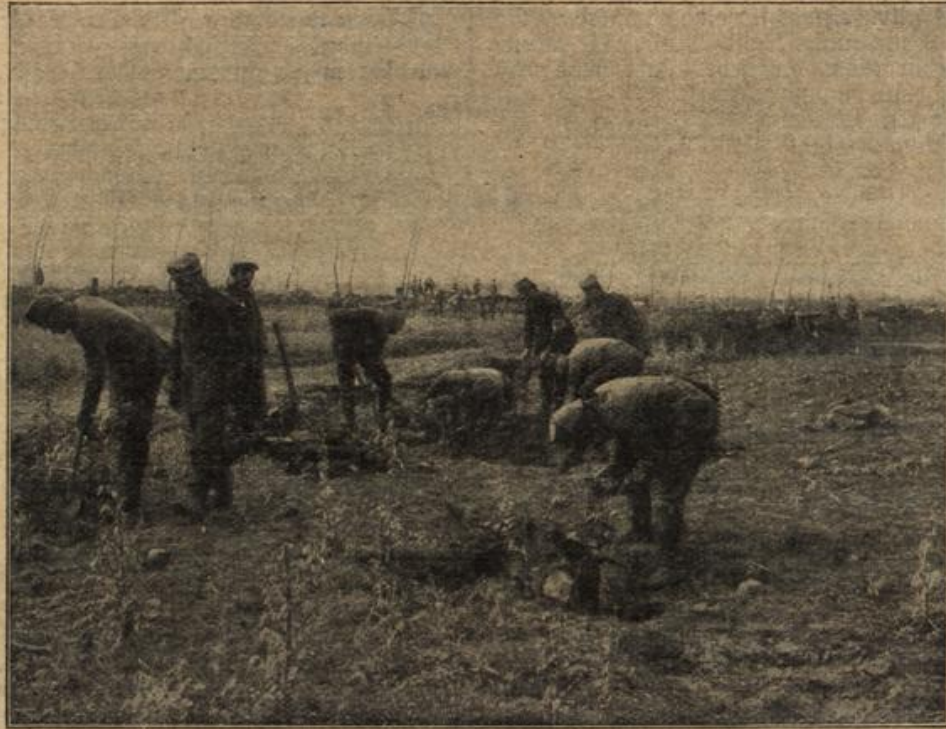
Von den flandrischen Schlachtfeldern. (Mit Text.)

Verantwortliche Redaktion von Ernst Pfeiffer, gedruckt und herausgegeben von Greiner & Pfeiffer in Stuttgart.