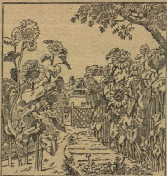
Wo steht der Gärtner?