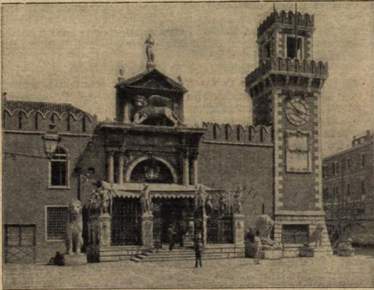
Das historische Eingangstor zum Arsenal in Venedig. (Mit Text.)

französisches Wörterbuch hatte er eine höllische Freude, aber wie er die zehn Taler entdeckte, war er betäubt. Er wußte, daß der alte Fridolin Scherer nicht auf Rosen gebettet war, und daß die zehn Taler mühsam erspartes Geld waren. Er schrieb daher flugs einen Zettel: „Mit Dank zurück, lieber, guter Magister. Ich fürchte, Petrus läßt mich nicht in den Himmel, wenn ich mit so sündhaft viel Geld angerückt komme!“ Und er legte den Zettel zum Geld, machte ein kleines Bündelchen und steckte es zu sich, hoffend, nachher beim Ausmarsch einen Bekannten an der Straße zu treffen, dem er das Bündelchen zur Rückbesorgung zum Magister nach Oberriedelbach anvertrauen könne.