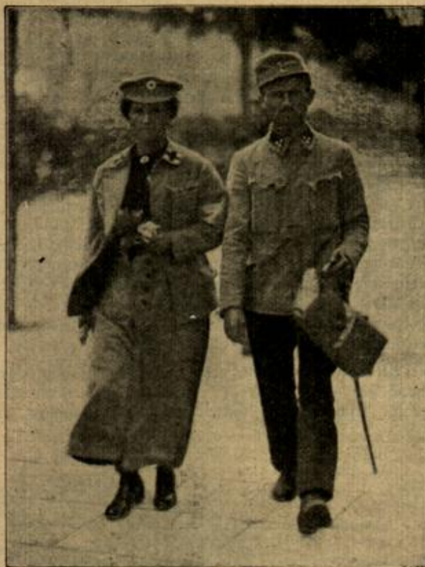
Strassenbild in Lublin.

Ich lächelte diesem Scheusal noch gezwungen freundlich zu, gab dem Dienstmann meine Börse zur Bezahlung und war