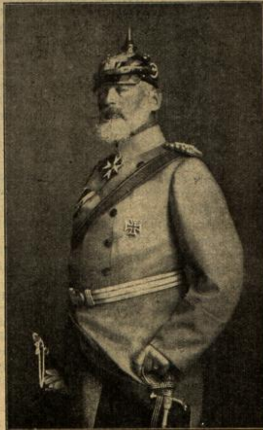
Prinz Leopold von Bayern, siegreicher Führer einer Armee im Osten, der Eroberer von Warschau.

Es war seit dieser Begegnung einige Zeit vergangen. Der Frühling war mit seiner Pracht nun vollständig ins Land gerückt. Und an einem solchen Frühlingstage, nachmittags, war es, als Dietrich, wie fast täglich, seine Promenade im