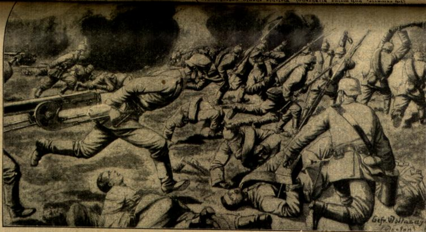
Sturmangriff der Deutschen auf eine englische Stellung bei Hooge. Nach einer Zeichnung von Witaszy.