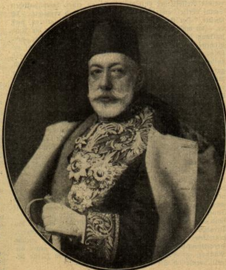
Sultan Muhammed V. Ghazi, Kaiser der Osmanen.

Auf der Straße hätte ich am liebsten vor Zorn geweint, aber nein! Ich mußte irgend etwas ersinnen, um zu meinem Recht zu kommen; und wie ein Blitz erschien mir der Gedanke: du kannst mit welchem männlichen Wesen du willst, das feine Café betreten; gut, also. — Und ich schritt auf den nächsten Dienstmann zu und fragte ihn: „Wollen Sie mit mir in ein Café gehen und ein Glas Absinth nehmen?“