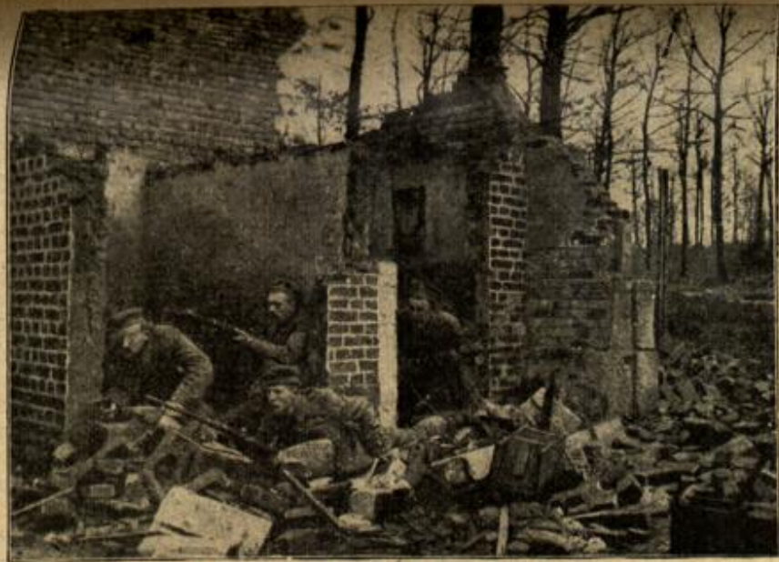
Zu den Kämpfen bei Arras. Eine kühne Patrouille.

Fragens und Kopfschüttelns, besonders unter den Kameraden Dietrichs, die an dergleichen bei der schönen, geheimnisvollen Wally nicht im entferntesten gedacht hatten. Die Nachricht kam ihnen im Gegentheil vielmehr allen wie vom Himmel gefallen.