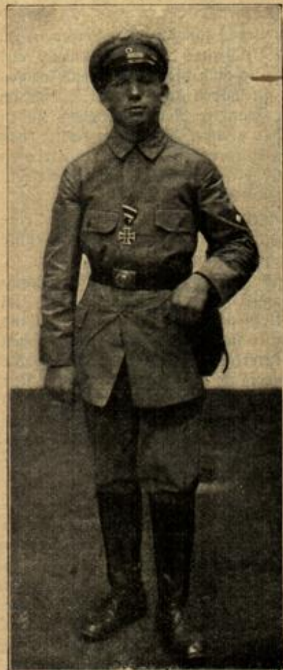
Ein heldenmütiger Pfadfinder.

Meine Augen wurden vor Verwunderung ganz groß, aber