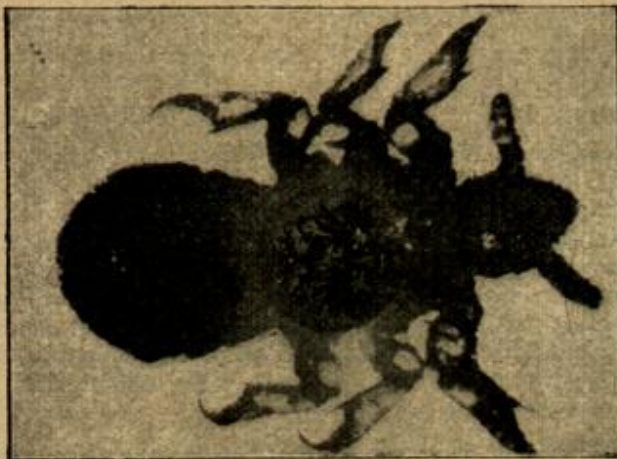
Ein kleiner Russe. Eine mikroskopisch 50fach vergrößerte Laus.