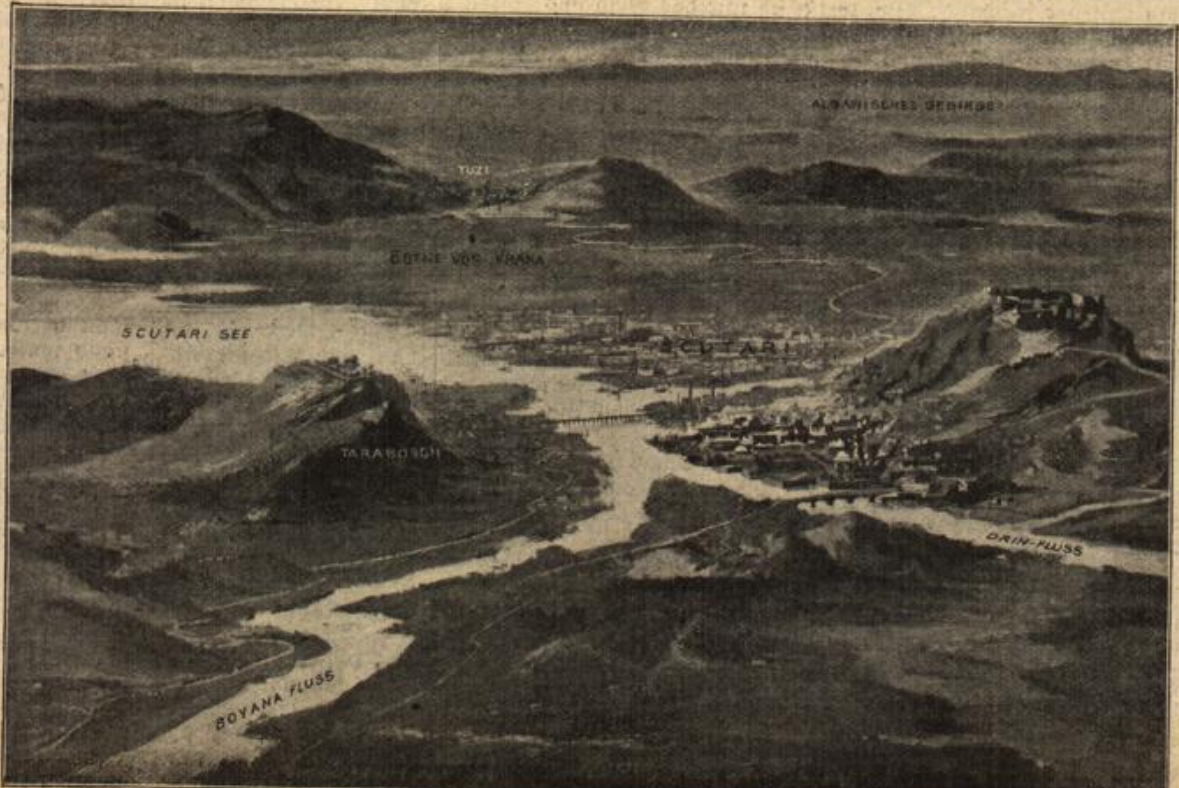
Das Tal von Skutari mit dem Tarabosch. (Mit Text.)