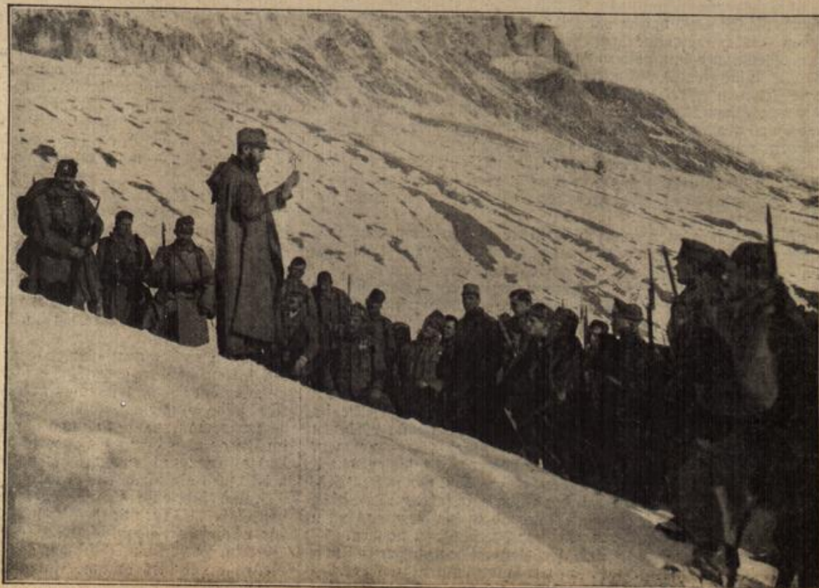
Vom Kriegsschauplatz an der italienischen Grenze: Gebet vor dem Angriff.