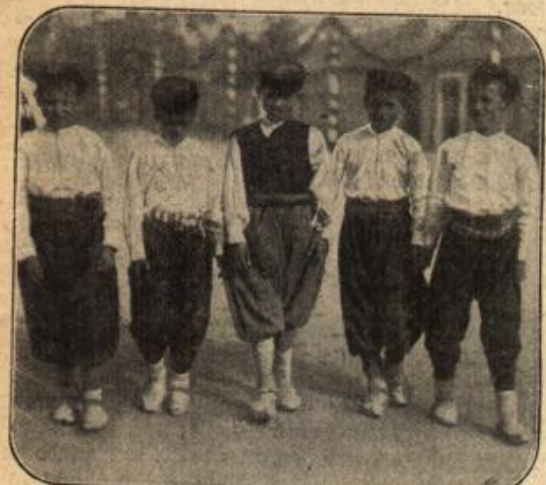
Montenegrinische Knaben in Nationaltracht.

Da überlegte er kurz. In der Zeit war er ja auch zu Hause, wenn er dort den Weg über das Gelände nahm. Gewiß und sicherlich, er kannte ja die Gegend. — Er hörte nicht mehr