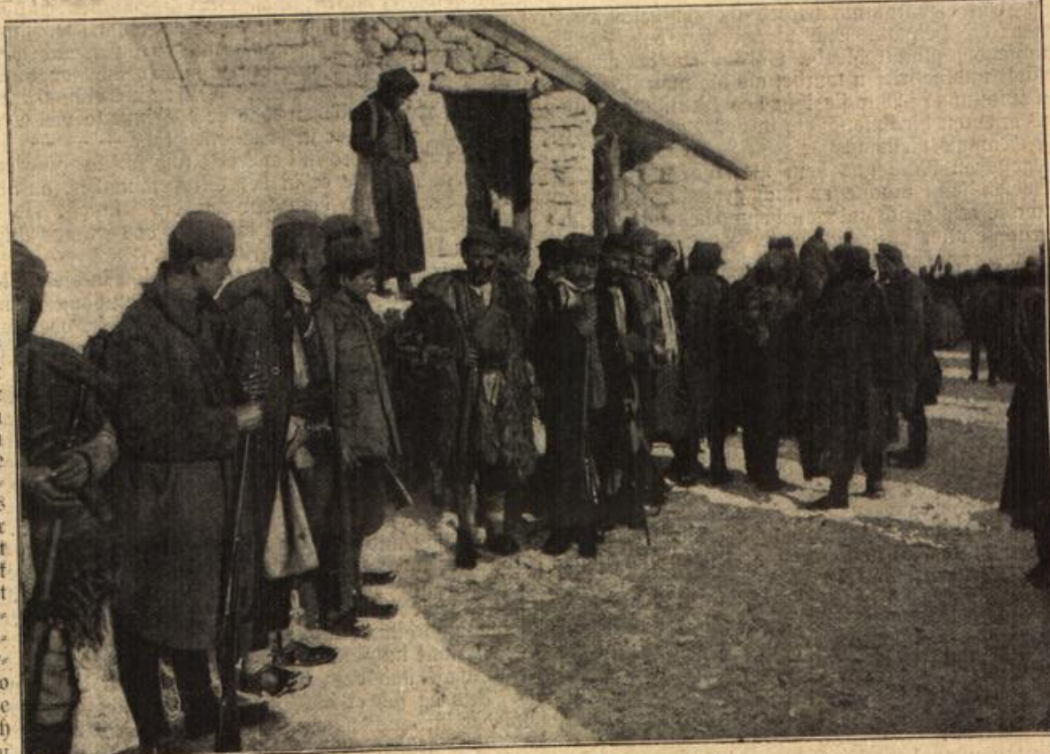
Die Waffenstreckung der Montenegriner,

und wenn Du gleich fremdes Gut gestohlen hättest, müßte ich Dir es verzeihen, mein Mutterherz ließe das schon nicht zu, aber es kränkt den Vater noch immer und jetzt, da er auch noch körperlich leidet, erst recht, daß Du gar nichts mehr hören läßt von Dir durch Jahre schon. Vielleicht macht er sich auch Vorwürfe, daß er zu hart mit Dir verfahren ist damals, wenn er's auch nicht gesteht, und daß Du ihm jeither noch nicht ein einziges Mal die Hand zur Veröhnung geboten hast, außer in dem Briefe, den