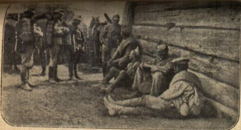
Von österreichisch-ungarischen Husaren eingebrachte russische Gefangene.

Da überlegte er kurz. In der Zeit war er ja auch zu Hause, wenn er dort den Weg über das Gelände nahm. Gewiß und sicherlich, er kannte ja die Gegend. — Er hörte nicht mehr