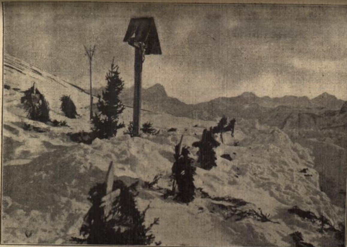
Ein Kriegsfriedhof im Hochgebirge.