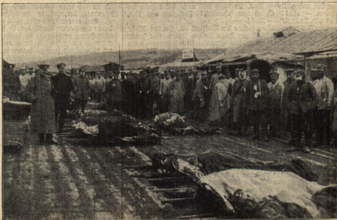
Verwundetenverbandstelle Bigneulles: Verwundete nach den Gefechten in der Woivre-Ebene.

der erste weibliche österr. Militärarzt. (Mit Text.)