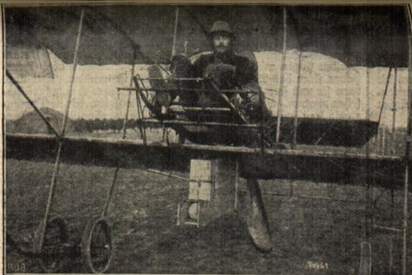
Ein Flugzeug mit Bombenwerfer. (Mit Text.)

Wilhelm kehrt zu seinem Gespann zurück, die zwei Eskadronen sind vorbei. In seiner Trainuniform kommt er sich plötzlich ganz bescheiden vor. „Ach, wenn er doch auch als Reiter ins Feld ziehen könnte.“