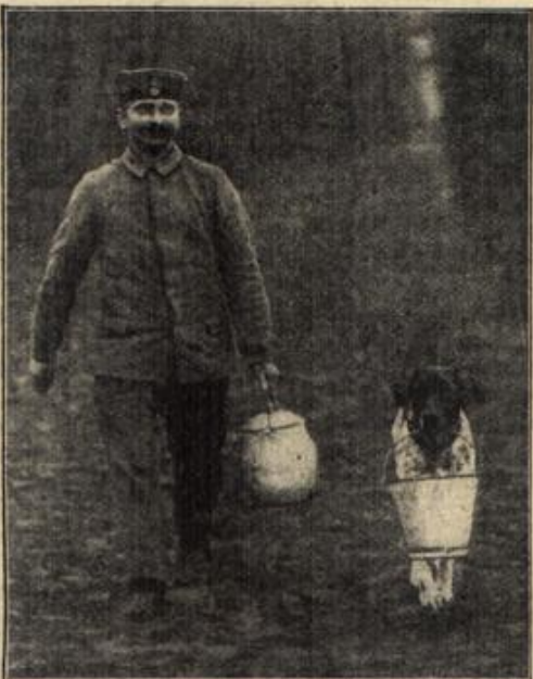
Deutscher Landwehrmann mit dem zum Tragen abgerichteten „Kompagniehund“ bei der Rückkehr vom Einkauf.

Kirschkresse. Saure Kirschen werden mit Zucker und ganz wenig Wasser weich gekocht. Die Kirschen werden mit einem Schaumlöffel aus der Brühe genommen und die Brühe dann mit wenig Kartoffelmehl verdicke. Statt des Kartoffelmehles kann man auch Gelatine nehmen. — Auf das halbe Liter Saft rechnet man 6 bis 7 Blatt rote Gelatine.