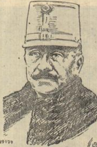
General v. Pfanzger-Baltin, der Führer der österreichisch-ungarischen Armeegruppe, die die Bukowina besetzte.

Darum frisch hinaus! Und schaut euch mal die Wiesen etwas genauer an. Den Löwenzahn, Taraxacum officinale , im Volksmunde vielfach Kettenblume genannt, weil die kleinen Kinder aus den hohlen Stengeln Ketten zu verfertigen wissen, beachten wir zuerst. Seine Blätter, gebleicht, geben einen gesunden, feinschmeckenden Salat, den wir nicht nur hin und wieder auf dem