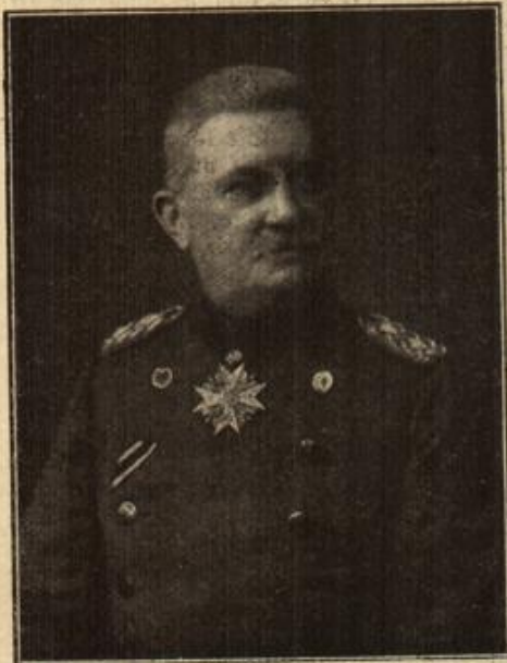
Der neue Generalfeldmarschall v. Bülow, Führer einer deutschen Armee im Westen.

„Im Felde, da ist der Mann noch was wert, Da wird das Herz noch gewogen, Da tritt kein anderer für ihn ein, Auf sich selber steht er da ganz allein.“