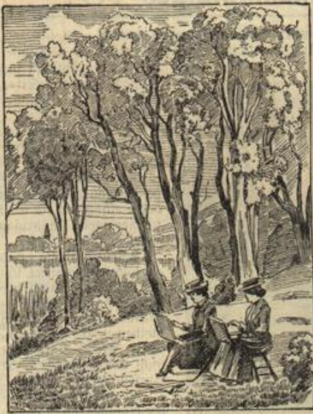
Wo ist der neugierige Zuschauer?