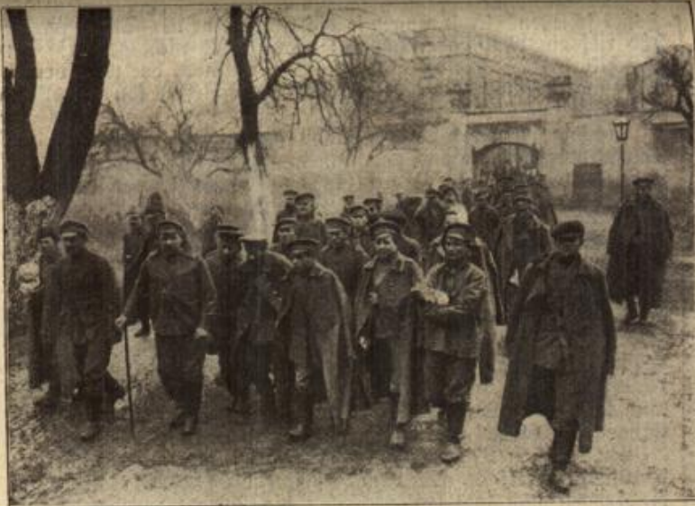
Verwundete Russen werden in ein deutsches Lazarett gebracht.

Uniform schien er auch einen ganz andern Menschen angezogen zu haben; seine Haltung und sein Auftreten hatte etwas viel Selbstbewußteres, Entschiedeneres. Baleska konnte es nicht lassen, ihn sofort wieder zu reden: „Was werden denn Sie für Heldentaten vollbringen?“ lachte sie ihn an. „Sie, der doch immer jedem Würmlein aus dem Wege ging, um es nicht zu zertreten?“