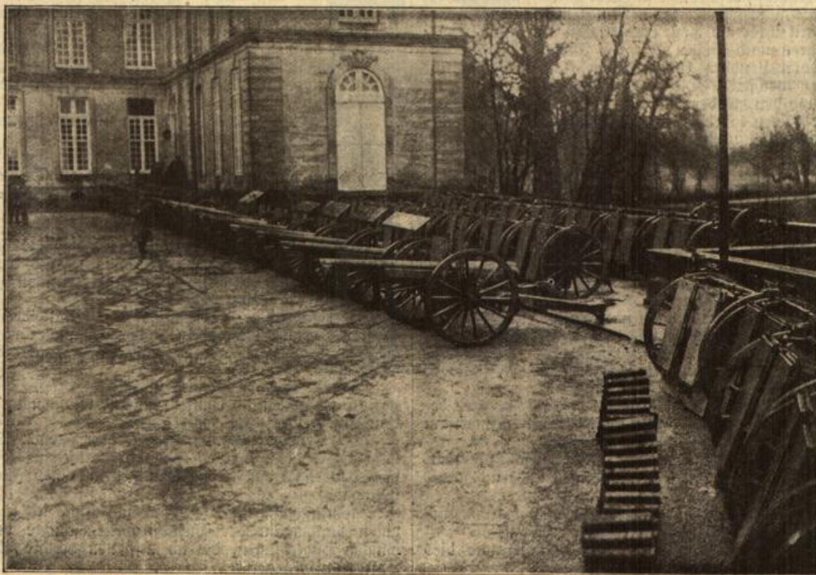
Deutsche Kriegsbeute in den Kämpfen bei Soissons und Craonac. (Mit Text.)