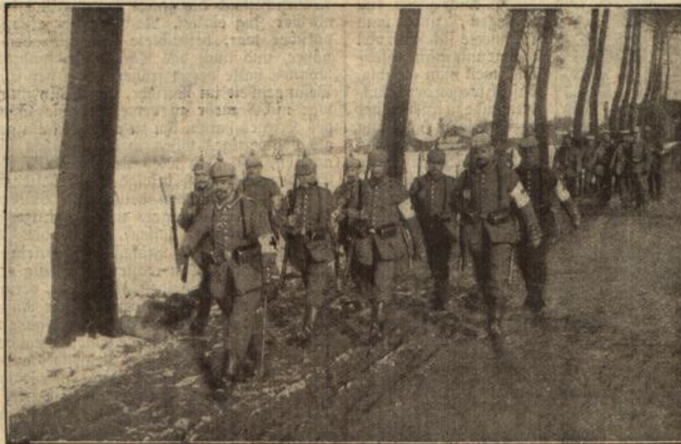
Sanitätskolonne auf dem Marsch zum Schlachtfeld. (Mit Text.)

Eine Sanitätskolonne auf dem Marsch zum Schlachtfeld. Unter Bild ist eine Aufnahme vom Kriegsschauplatz und zeigt, wie eine Sanitätskolonne nach Beendigung des Gefechts zum Abziehen auf das Schlachtfeld begibt.