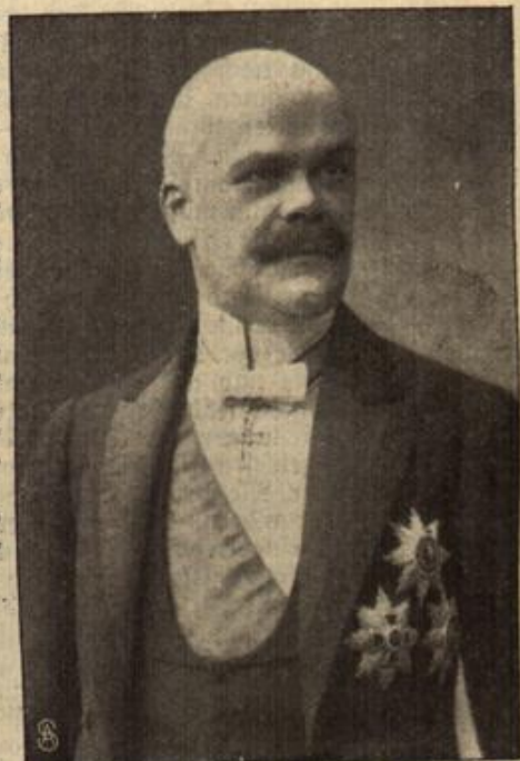
Dr. Ernst v. Koerber, der neue österreich-ungarische Finanzminister. (Mit Text.)

Der Professor und seine Frau, die jetzt wie-