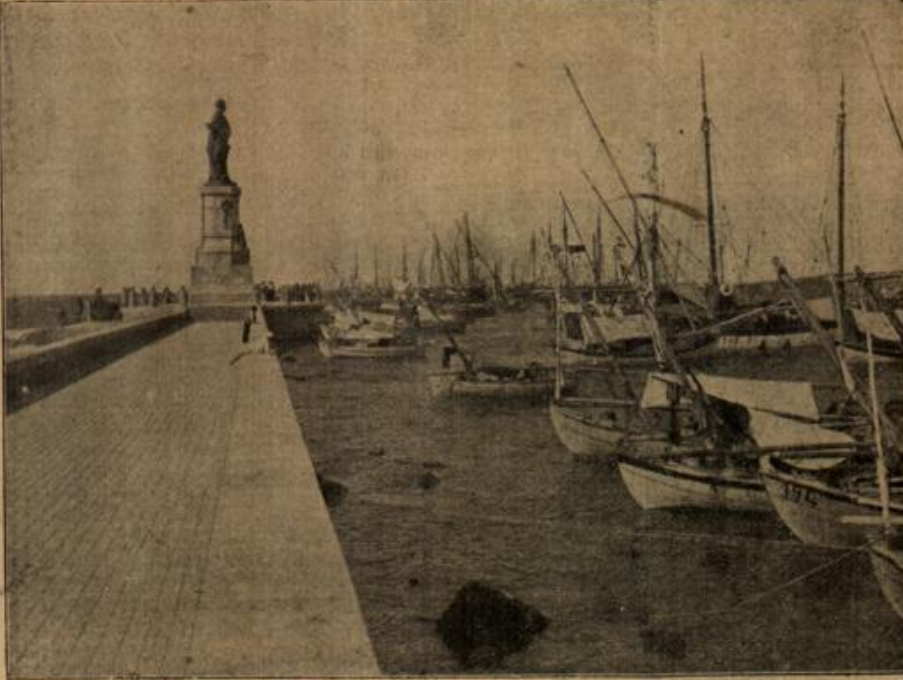
Hafenmole von Port Said mit dem Denkmal Lefieps, Erbauer des Suezkanals.

„Wer ist dieser Guido?“ fragte Alice die Tante. „Wie, du hast von ihm noch nicht gehört? Es ist der Baron v. Brandhorst, ein alter Freund und Schulkamerad meines Gatten, ein ausgezeichnete Archäologe.“