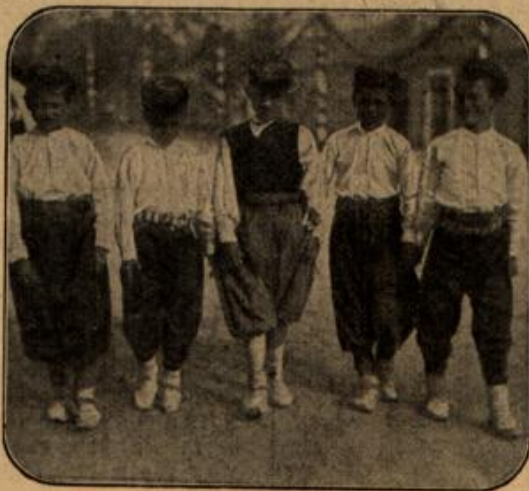
Montenegrinische Knaben in Nationaltracht.

Sie öffnete die Glastür, die in das Empfangszimmer führte, und ließ die Halberstarke in der Nähe des Feuers Platz nehmen. Dann erzählte sie ihrer Kusine, daß ihr Gatte auf einer Reise ab-