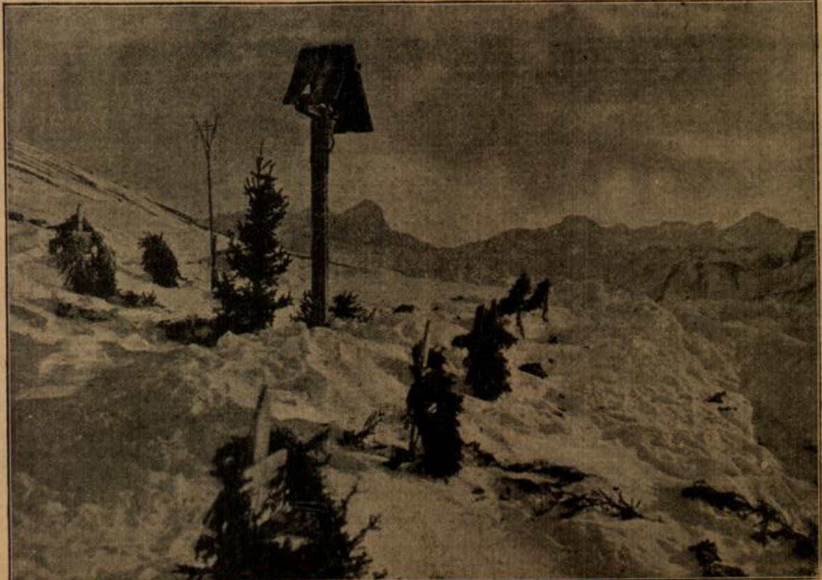
Ein Kriegerfriedhof im Hochgebirge.

Frau v. Vollrath war inzwischen abgereist, was von Alice sehr bedauert wurde. Meta konnte nicht umhin, zu bemerken, daß ihre Kusine in der letzten Zeit auffallend blaß und still geworden war. Meta glaubte ihre frühere Beobachtung bestätigt zu finden, daß diese Ehe nicht besonders glücklich war. Es fehlte die Übereinstimmung der Neigungen, des Geschmacks. Die junge Frau litt offenbar unter dem einseitigen Leben, sie war ein Wesen, das für den Glanz und Flitter des Weltlebens paßte. Die zurückgezogene Existenz, zu der ihr Gatte sie zwang, lastete schwer auf ihrem Gemüt. Ob auch der Freiherr darunter litt,