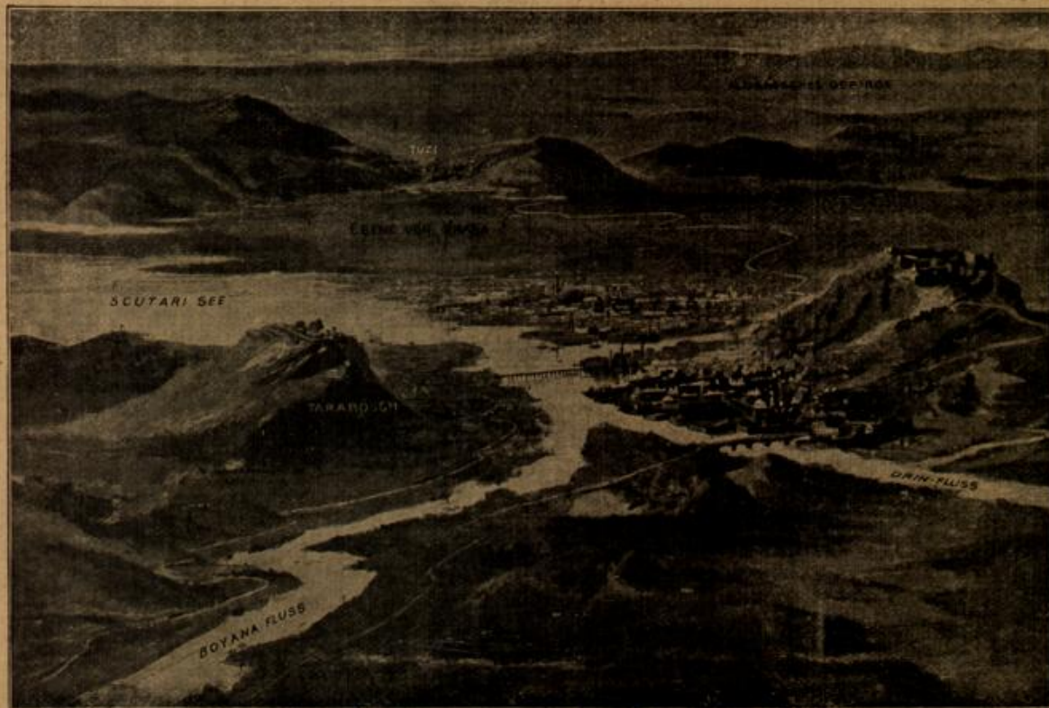
Das Tal von Scutari mit dem Tarabosch. (Mit Text.)

Den hauptsächlichsten Gesprächsstoff des Abends bildeten die Ausgrabungen. Der Freiherr erzählte davon, und die Damen hörten ihm zu. Wenn dieser Gegenstand erschöpft war, entstand gewöhnlich eine lange Pau'e. Die junge Frau schien an dieser gelehrten Unterhaltung wenig Geschmack zu finden, denn Meta bemerkte einige Male, daß sie verstoßen gähnte, und einmal war sie sogar nahe daran, einzuschlafen. Das junge Mädchen empfand Mitleid mit ihr und nahm am nächsten Abend die neuesten illustrierten Zeitschriften zur Hand, um die Unterhaltung auf etwas andres zu bringen. Für den Inhalt dieser zeigte die Kusine auch so reges