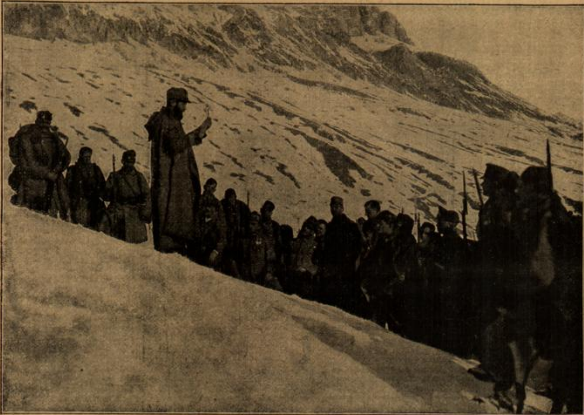
Vom Kriegsschauplatz an der italienischen Grenze: Gebet vor dem Angriff.

Durch die Ankunft des Hausherrn hatte die einsam gelegene Besichtigung mehr Leben erhalten. Der Freiherr war fast den ganzen