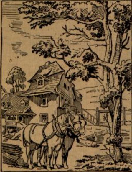
Wo ist der Fuhrmann?