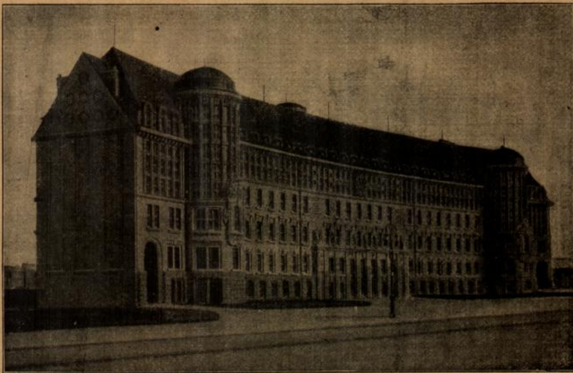
Die Deutsche Bucherei in Leipzig. (Mit Text.)

und nicht völlig aus sich heraustreten lassen. „Er liebt sie nicht,“ dachte Meta, „oder lieben sie sich beide nicht, und handelt es sich nur um eine Vermunftehe?“