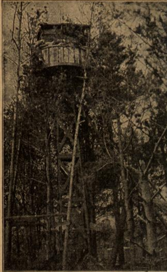
In den Nokitnosümpfen: Versteckter Beobachtungsposten bei den deutschen Stellungen in der Gegend von Pinst.

Meta trat von der Tür zurück, denn die Diskretion verbot ihr, noch mehr mit anzuhören. Es handelte sich offenbar um ihre eigene Person. Sie entfernte sich so leise, daß man ihren Schritt nicht vernehmen konnte.