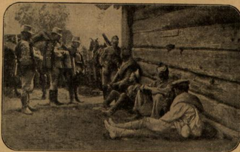
Von österreichisch-ungarischen Soldaten eingebrachte russische Gefangene.

Es wurde keine Silbe zwischen ihnen gewechselt. Am Parktor trafen sie mit Alice zusammen, die sie dort erwartete. Als sie die beiden kommen sah, lief sie ihnen entgegen und rief: