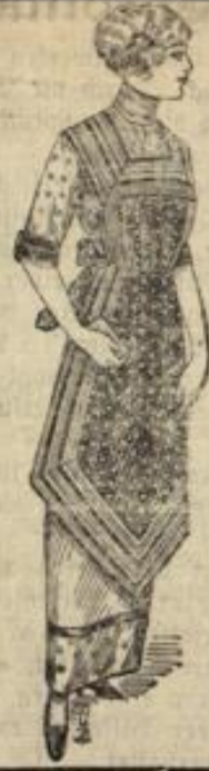
Zierschürzen in weiß und bunt die neuesten Formen.