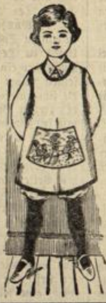
Knabenschürze in allen Größen und jeder Preislage.