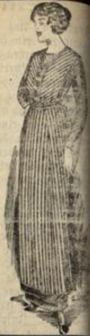
Blusenschürze in weiß, schwarz farbig in groß. Ausw.