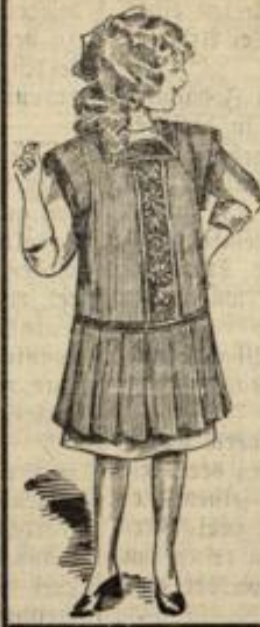
Kinderschürzen stets das Neueste! in allen Qualitäten.