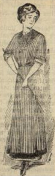
Kleiderschürze mit und ohne Ärmel in allen Preislagen.