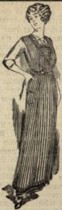
Blusenschürzen in allen Farben und Formen höchst preisw.