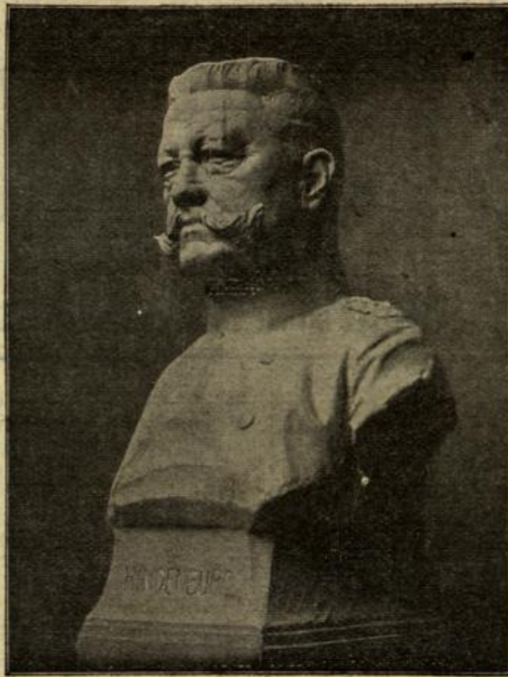
Generalfeldmarschall v. Hindenburg.

Georgs Hoffnung, dem eigentümlichen Fremden wieder zu ge- genen, erfüllte sich zunächst nicht.