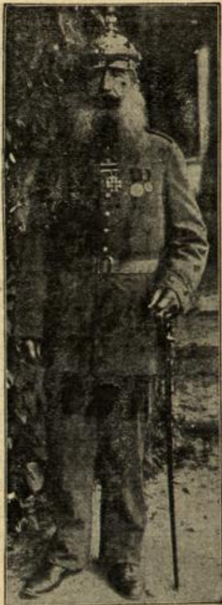
Ein 70jähr. Kriegsfreiwilliger, Ritter des Eisernen Kreuzes.

Generalfeldmarschall v. Hindenburg. Zum Jahrestag der Schlacht von Tannenberg am 28. August.