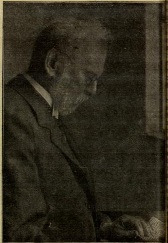
Wirkl. Geh. Rat Professor Dr. Paul Ehrlich. (Mit Text.)

Der Mann im grauen Ulster mit der Brille war kein anderer als William Jenkins! Er hatte genau dieselbe Gestalt und Größe, und je mehr Georg nachdachte, desto mehr Ähnlichkeit kam er heraus, trotz der sorgfältigen Verkleidung und der Flüchtigkeit der Bewegung. William Jenkins reiste als Privat- gelehrter John Burlington aus Buffalo mit ihm auf demselben Schiff, und vielleicht, ja höchst wahrscheinlich war er, Georg Homann, der einzige, der ihn