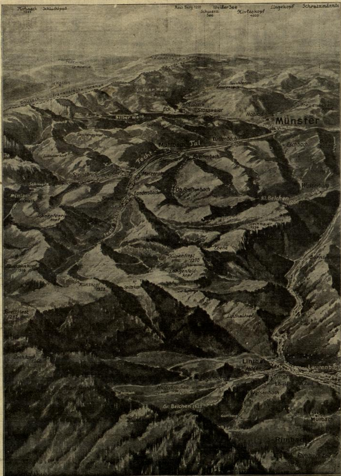
Der Schauplatz der Kämpfe in den mittleren Vogesen. Gezeichnet von Walter Emmerleben.

Und wenn nun das Unglück wollte, daß einer jener englischen Kreuzer des holländischen Passagierbootes ansichtig wurde und es durchsuchte? Lag es nicht nahe, daß jener die Gelegenheit