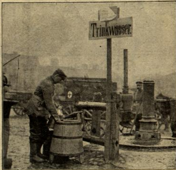
Zur Trinkwasserversorgung der deutschen Truppen in Rußisch-Polen.