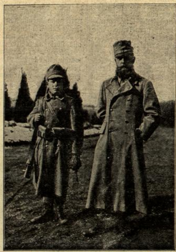
Erzherzog Joseph Ferdinand und sein jüngster Soldat. (Mit Text.)

An der Liesel war das Abenteuer fast spurlos vorübergegangen. Sie hatte ganz andere Gedanken; der Fröschling hatte seine Dichtung weg und damit gut. Aber ein wenig mußte sie doch lachen, als sie ihn jetzt so eilig und empört den Weg hinunterstolpern sah, wobei seine schlotterigen Gliedmaßen wie fremde Gegenstände um ihn herumslappten. Doch gleich wurde sie wieder ernst und wandte sich der Arbeit wieder zu. Da sah sie neben am Begrände