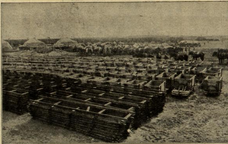
Der Wiederaufbau Ostpreußens. (Mit Text.)

Ein vor größeren Truppenburgen auf dem Marktplatz einer polnischen Stadt aufgestelltes Gefäß mit bakterienfreiem Trinkwasser.