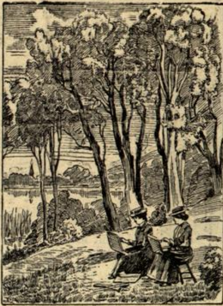
Wo ist der neugierige Zuschauer?

der ins Dasein zurückrief. „Die Liesel,“ schraubte er, halb im Lachen und halb im Jorrit, „die Liesel ist schuld dran, daß der gelbe Galgenvogel gefangen ist. Und der Liesel, Hirschwirt, hast es zu danken, daß dein Bub noch gesund vor dir steht.“