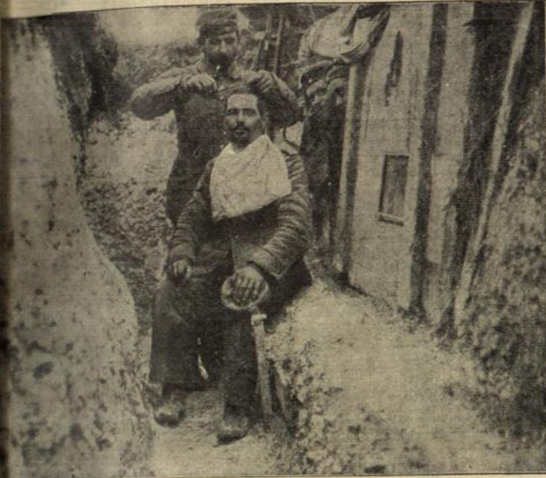
Ein Schützengrabenidyll bei Reims.

... äußern. So weichlich die verwöhnte Frau mit ihrer Tochter Gesundheit und Lebensverhältnissen war, die nach ihren Wünschen einzurichten liebte, so hart war sie, sich um andere Leute handelte, selbst um ihre kleinen erben. Da war sie bald mit den Worten Verweichlichung, undankung und so weiter bei der Hand.