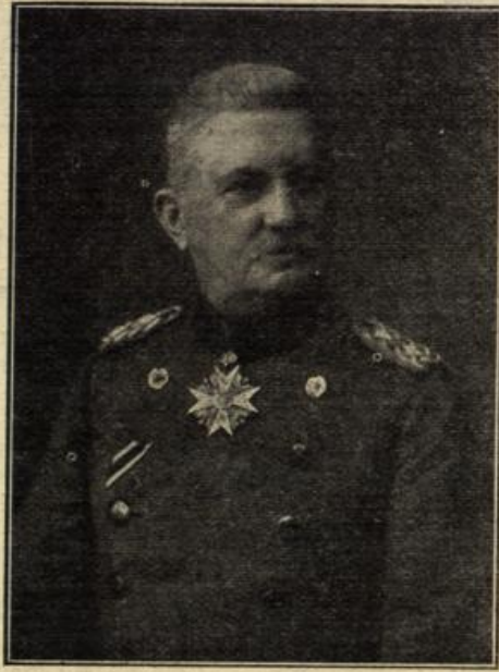
Der neue Generalfeldmarschall v. Bülow, Führer einer deutschen Armee im Westen.

Dann fuhr der Schwiegervater wohl auch mit einem dazwischen: „Wenn Richard nun Kavallerieoffizier geworden wäre, dann hätte Melanie das Wohnen in einer kleinen Stadt geblüht — irgendwo muß doch eine Frau mit dem Mann wohnen, den sie liebt.“