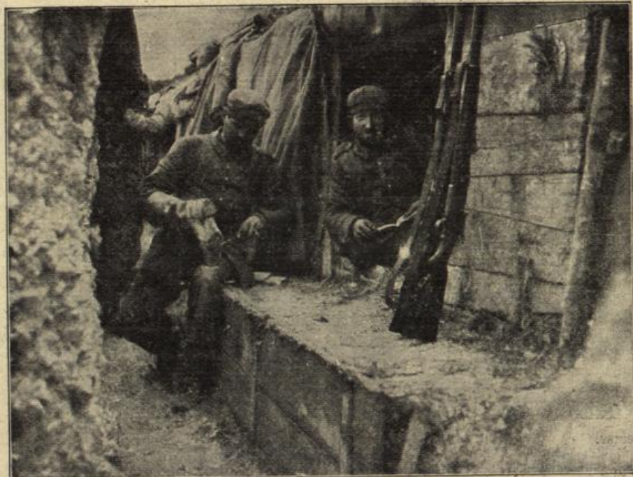
Ruhepause in einem deutschen Schützengraben bei Reims. Rechts Wohn- und Schlafraum.