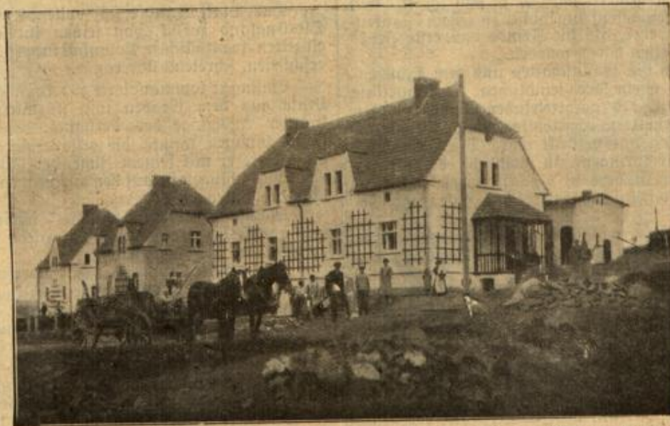
Die Kriegerheimstätten-Kolonie in Reichenbach (Oberlausitz): Wohnstätten der Kolonie, welche aus Einfamilienhäusern besteht.

„Profit, Häuptling!“ sagte Salmuth, wobei er sein dickes, unförmliches Glas an jenes des Hauptmanns klingen ließ. „Und dann gehe ich erst noch mal die Posten ab!“ — „Recht so!“ entgegnete der andere schon gähnend. „Aber ich hoffe, daß alles in Ordnung ist und Sie sich dann gleichfalls auf's Ohr legen können!“