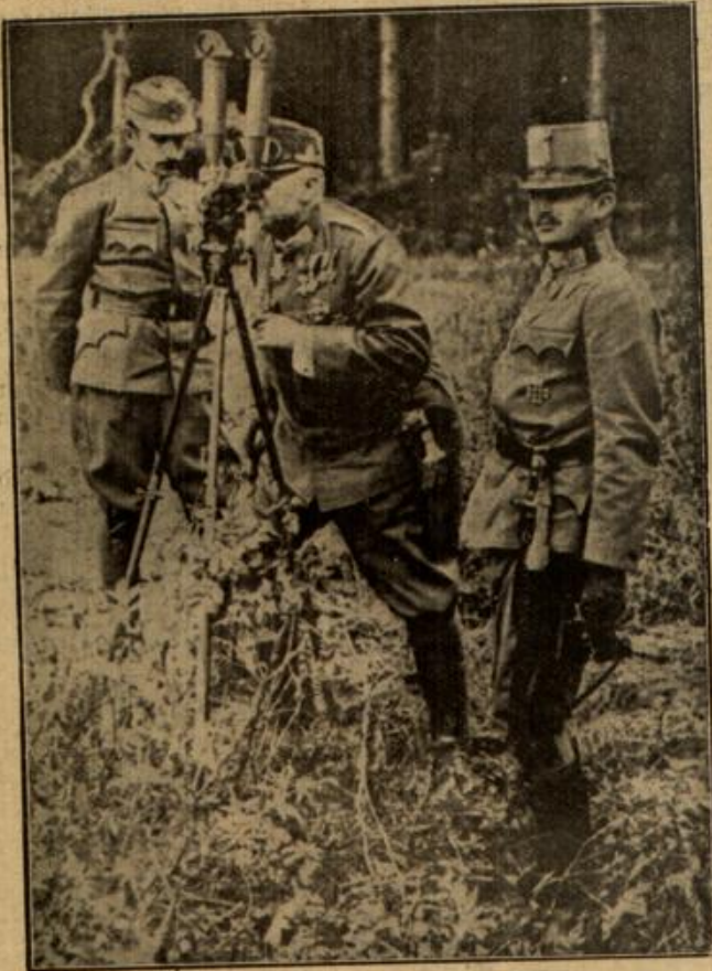
Der König von Bulgarien und der österreichisch-ungarische Thronfolger in der Kampffront.

Der König von Bulgarien und der österreichisch-ungarische Thronfolger in der Kampffront. Unser Bild zeigt den