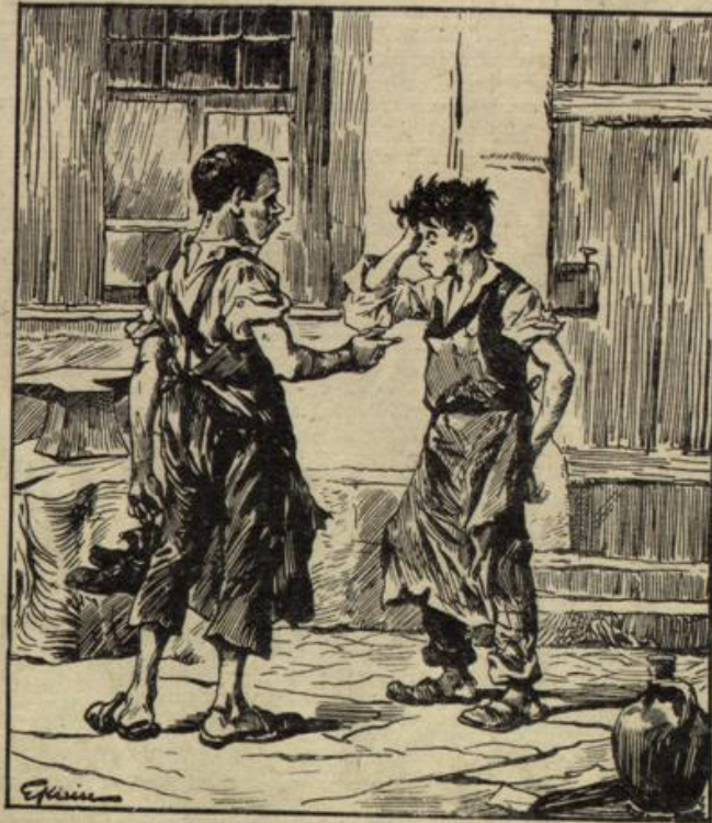
Lehrbursche (zum andern): Was war denn eben los, Friße; lagen der Meister und die Meisterin sich in den Haaren? — Ja ... aber in den meinigen!

Rehniert unter Verantwortlichkeit von Karl Theodor Senger in Stuttgart, gedruckt und herausgegeben von der Union Deutsche Verlagsgesellschaft in Stuttgart.