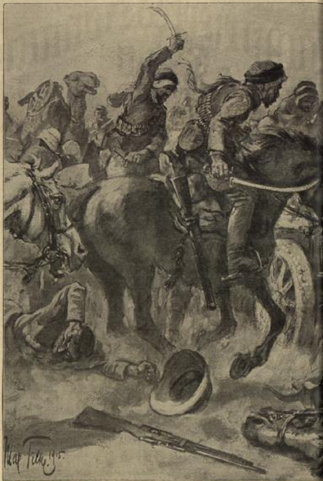
Von den Kämpfen in Mesopotamien: Die Engländer werden bei Ktesiphon von freiwilliger türkischer Reiterei angegriffen.

„Sedgwick“, hatte er gesagt, „vielleicht gibt es noch eine Möglichkeit für Sie, dem Arm der strafenden Gerechtigkeit zu entkommen. Gegen die