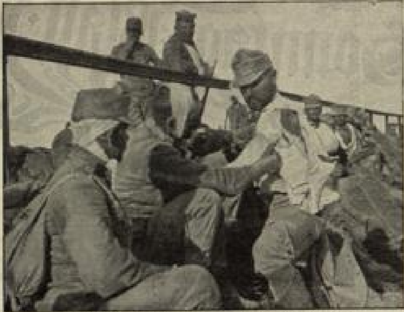
Heilberliche Hilfeleistung deutscher Seemannsleute. (S. 154) Von Otto-Friedrich Schmitt, Berlin.

„Ich habe auf dem Dampfer „Kronprinz“, der Sonnabend nach Stettin abfährt, eine Kajüte genommen,“ fuhr er fort. „Ein wichtiger Geschäft erfordert dort dringend meine Anwesenheit auf einige Zeit. Ich werde also hinfahren. — Wenn ich wiederkomme, Rätche, sind vielleicht alle Wunden vernarbt. Weinst du nicht?“