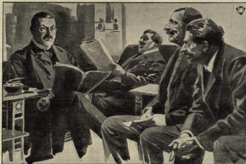
Arzt (großtunend): Neulich habe ich einen äußerst komplizierten Beinbruch geheilt, der Mann wurde darauf Schnellläufer. — Wohl als Sie mit der Rechnung kamen?