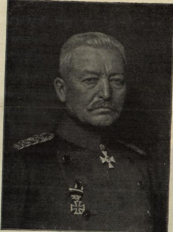
General Freiherr v. Scheffer-Bohabel, erfolgreicher deutscher Heerführer im Osten. (E. 156)

„Bitte, gib mir doch eine ordentliche Antwort!“ sagte Käthe gereizt. „Was ist da weiter zu antworten?“ murmelte Melanie ungnädig. „Natürlich! Ich will ihn ja heiraten!“ „Würdest du sehr unglücklich werden, wenn das nicht geschähe?“ Melanie schleuderte ihr Buch zu Boden. „Wie dumm du fragst! Er liebt mich doch, ist freigebig und reich.“ „Trotzdem hast du dich seinetwegen nicht ein bißchen geändert.“