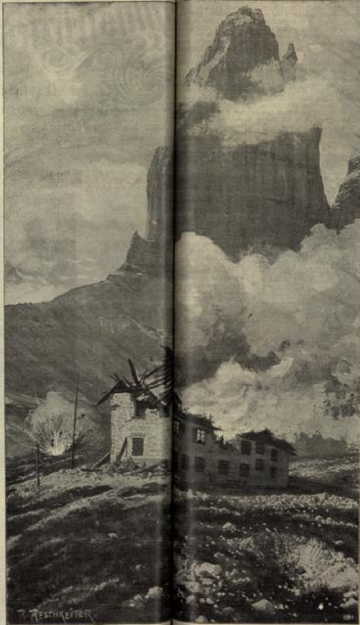
Waldschneise der Perle von K. Schmitt. (S. 154)