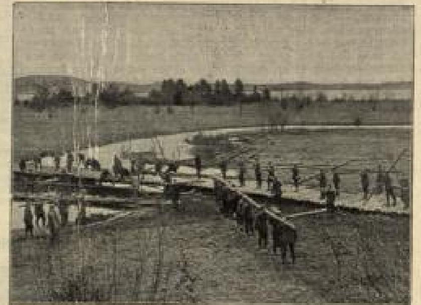
Deutsche Armierungstruppen bei der Errichtung einer Campstelle in Rußland. (S. 154) Von Carl Schmitt, Berlin.

„Mama, weinst du so höchstlich um Onkel Krant?“ fragte sie endlich im Tone des Zornes.