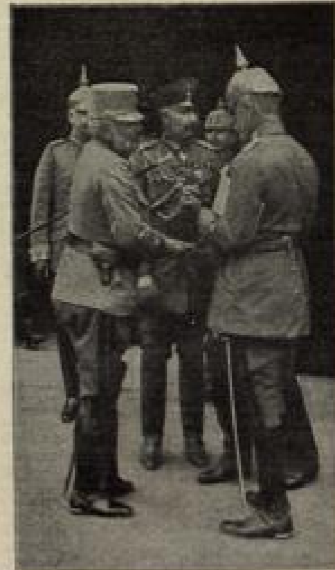
Kaiser Wilhelm und Kaiser Friedrich III im Felde. (S. 154)

Alice stand hinter ihr und legte unerbittlich die schwarzen Lederschuhe, die wie Schlangen um Melanies Kopf herumflohen, wieder in ihre richtige Lage zurück. Sie sah dabei sehr nachdenklich aus.