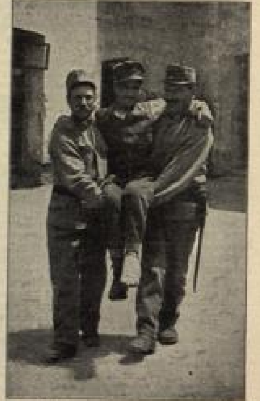
Oberwächler - wachende Soldaten tragen einen verwundeten Kameraden auf ein transportfähiges Fahrzeug. (S. 154) Von C. Schmitt, Berlin.

Aber sie kam nicht dazu, denn jetzt sprach Melanie: „Ich bin wirklich froh, daß die Geschichte ein Ende hat,