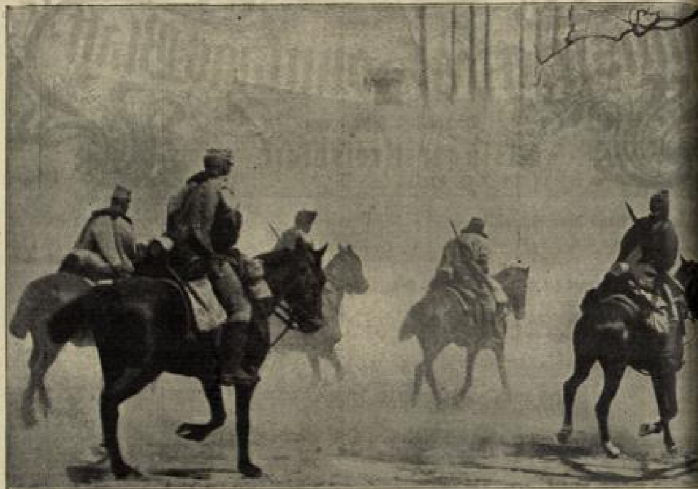
Militäre Streife durch den Wald. (S. 128)

Hintergründe fanden auf einem langen, rechteckigen Rasenplatz eine Anzahl Lebensbäume, wie Soldaten standen sie dort, einer neben dem anderen in einer Reihe. Die ersten hatten eine erschauende Größe, dann wurden sie kleiner bis zum letzten, der nicht größer war als ein halbwüchsiges Kind. Sie waren offenbar noch und noch geschnitten worden.