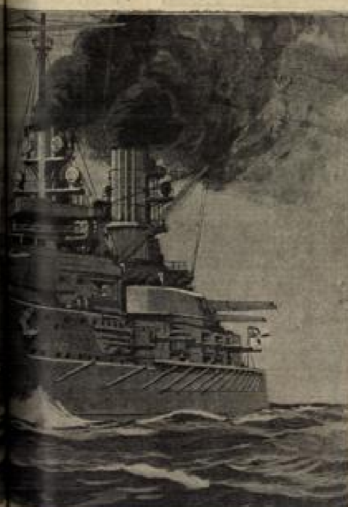
Das erste Panzerkreuz. (S. 129)

ein Juden über das alte Gesicht, die tausend Fältchen darin bewegten sich, die matten Augen bligten wie blaue Perlen.