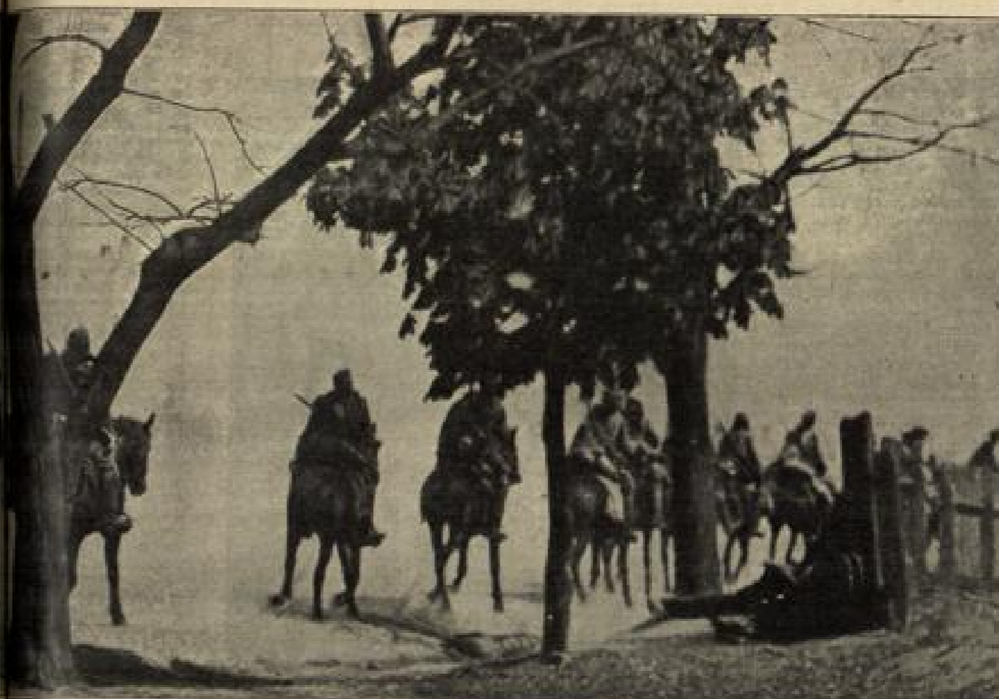
Militäre Streife durch den Wald. (S. 128)

Das sollte ein Versprechen sein, aber statt des Dankes ging