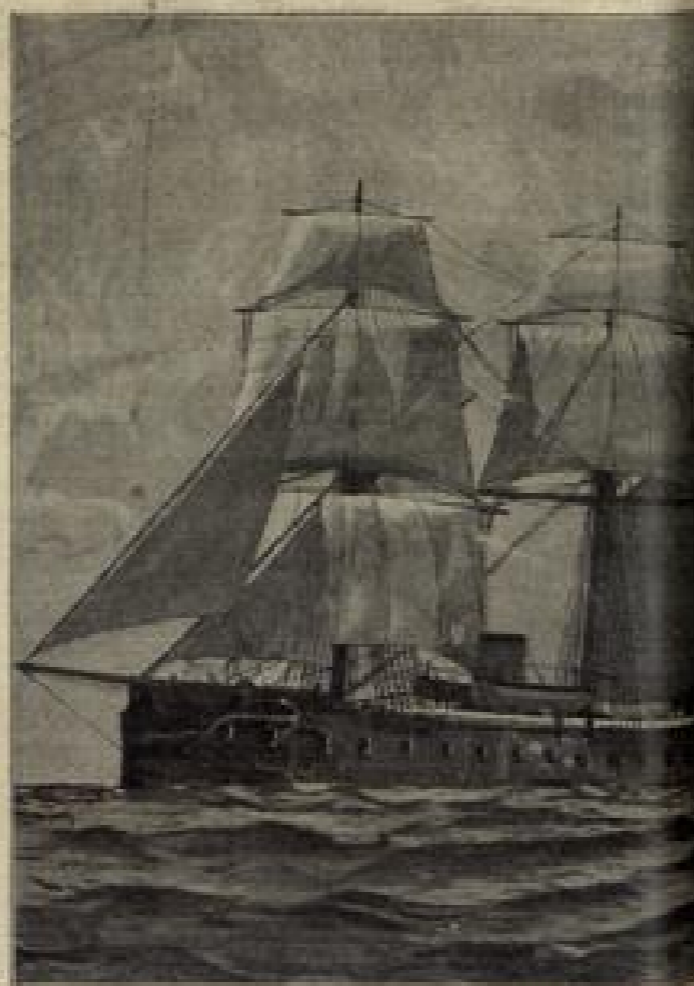
Das erste Panzerkreuz. (S. 129)