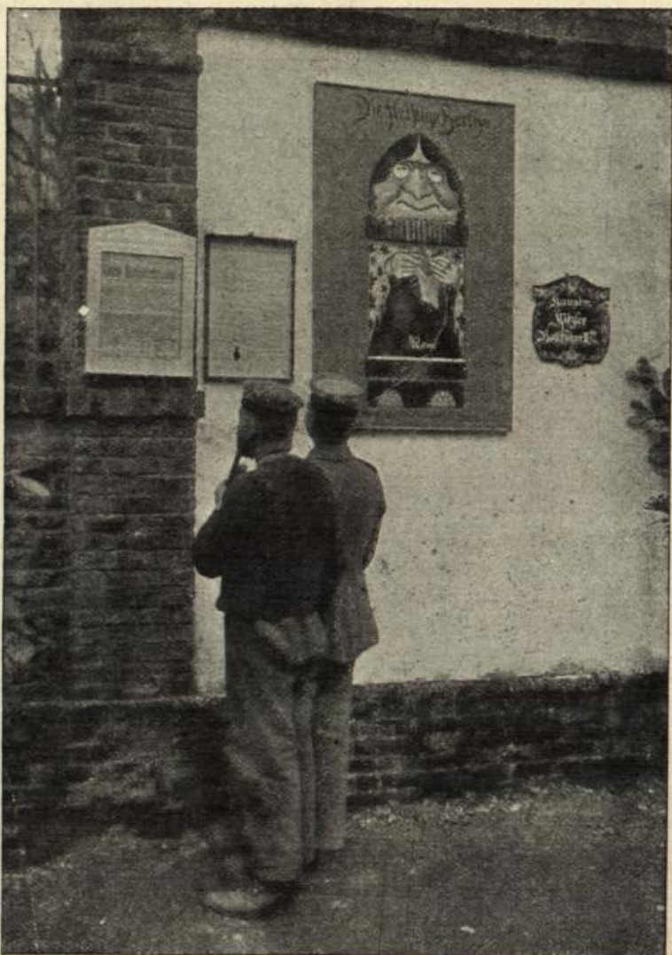
Die „fleißige Berta“ am Quartier des Bataillonskommandeurs.

Redigiert unter Verantwortlichkeit von Th. Freund in Stuttgart, gedruckt und von der Union Deutsche Verlagsgesellschaft in Stuttgart.