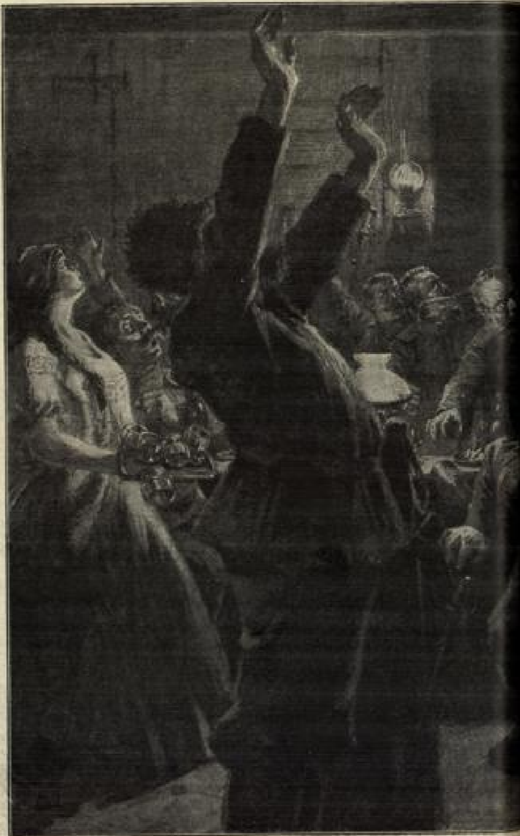
Überrumpfung eines russischen...

Er mußte sich zusammennehmen, als er hinausging, nicht taumelte. In seinen Knien war eine seltsame Schwere. Er war froh, als er auf der Straße stand und sich den