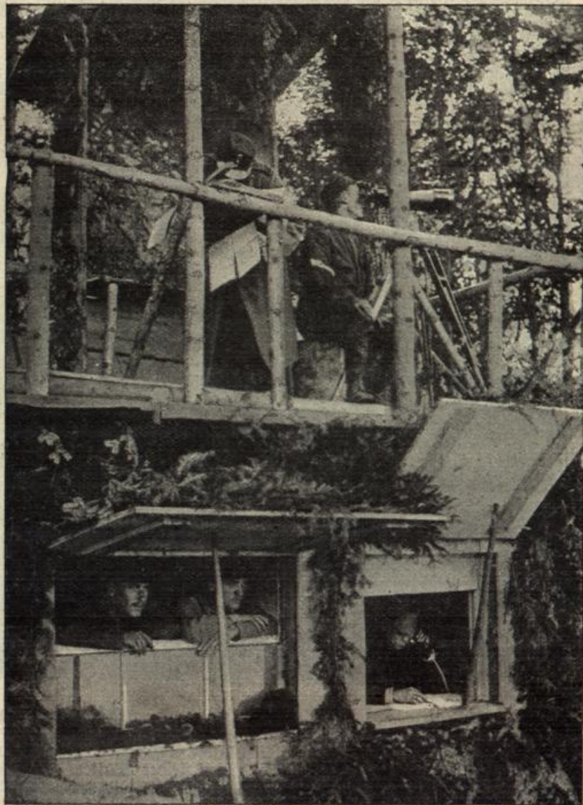
Ein maskierter Beobachtungsposten mit Telefonverbindung in der Schweiz. (S. 88)