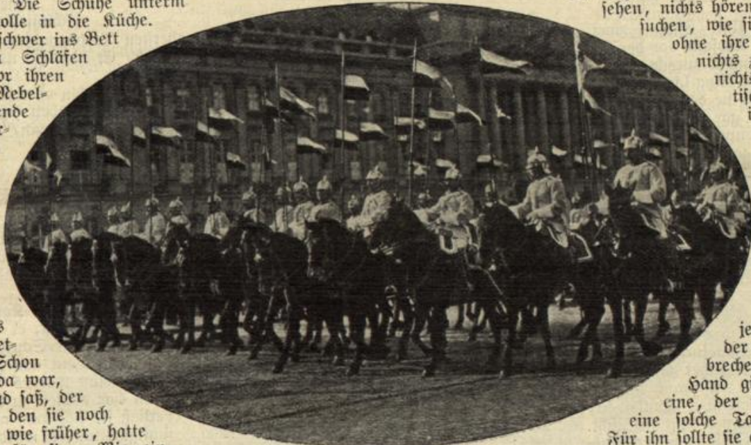
Parade preussischer Kürassiere in Brüssel. (S. 80)

Hadte sie jemand gerufen? Sie richtete sich verchlafen in die Höhe. Wie lange hatte sie geschlafen? Es war ja noch dunkel. Wer hatte sie denn so plötzlich in die Höhe gerissen?