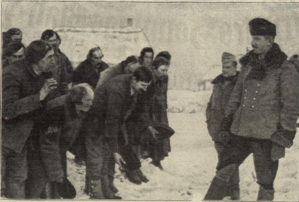
Unterwürfiger Empfang österreichisch-ungarischer Truppen in einem polnischen Dorfe. (S. 60)