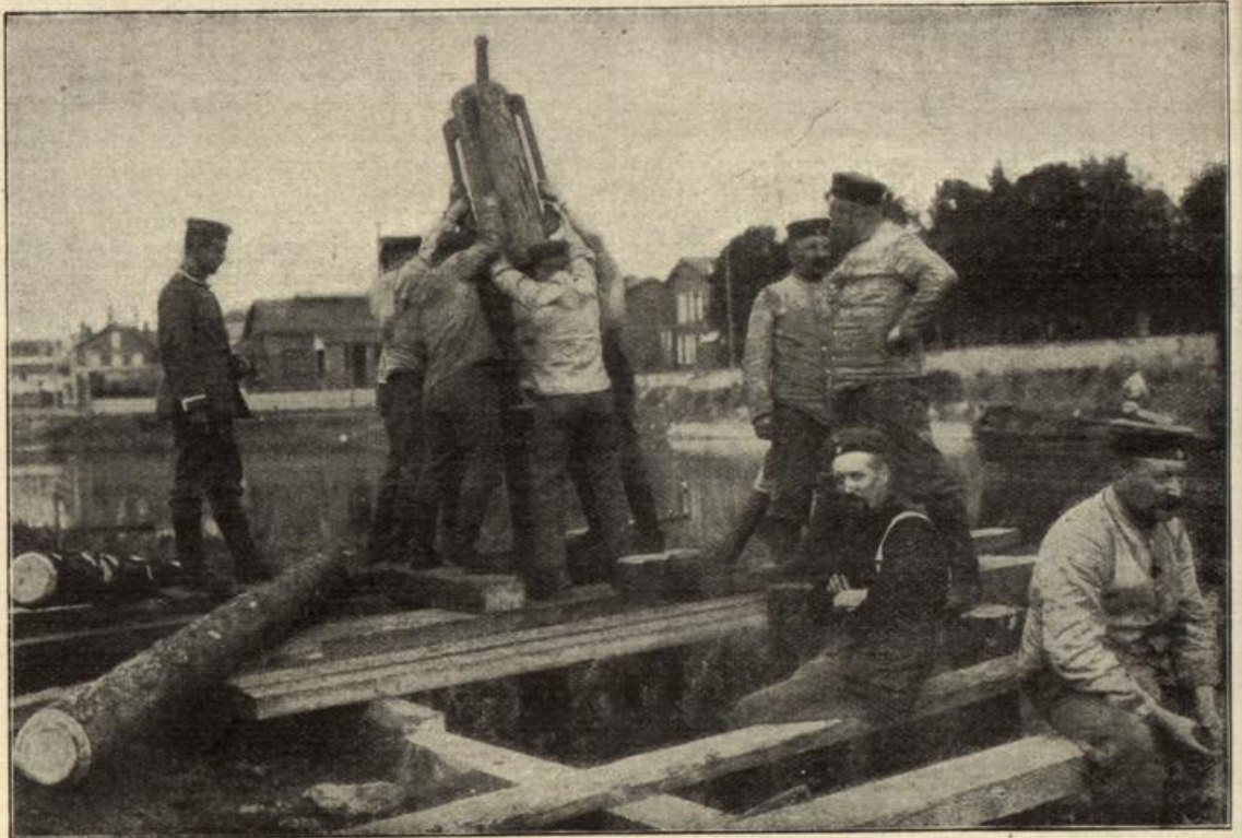
Deutsche Pioniere beim Brückenbau an der Maas. (S. 23)

bringen des Abendessens ihren Mieter tot auf dem Boden, sei ihr die Bedeutung jenes dumpfen Krachens klar. „Sie rechnen darauf, den Mörder zu entdecken?“ Escherott machte eine nicht sehr zuversichtliche Schüttelbewegung. „Wenn uns das Glück hold ist, gnädige Frau! Vorläufig