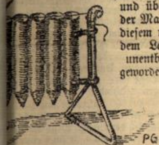
Form zum Gießen von Kerzen.

Der vielen in unser Wirtschafts- und Erbsleben tief einschneidenden Begleitenden des Krieges ist das Steigen des Petroleumpreises und überhaupt der Mangel an diesem uns auf dem Lande so unentbehrlich gewordenen Öle.