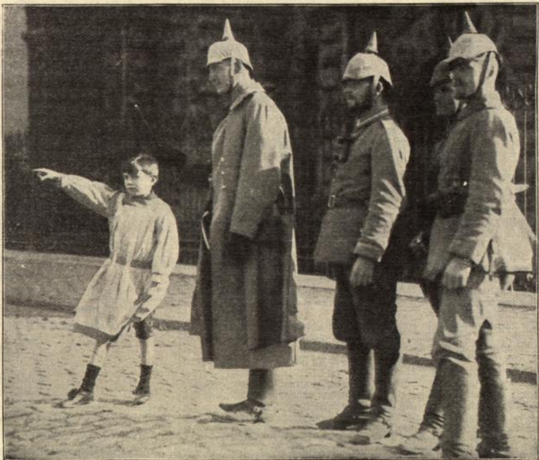
Deutsche Kavalleristen fragen einen französischen Knaben nach dem Wege.