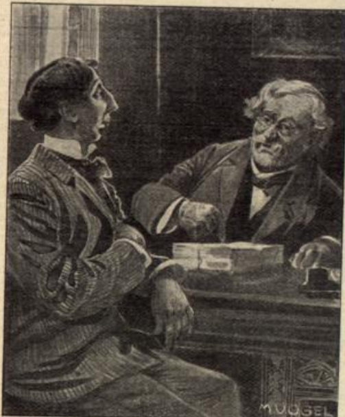
Dichter: In diese Verse legte ich mein Herz. Redakteur (auf einen Fleck im Manuskript an- spielend): So, so, Sie haben wohl ein — Fettherz?