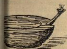
Dochtlampe des Altertums.

benutzen eine Mischung von einem Öleum und zwei Teilen Rüßöl, denen großes Stück Kampfer zugefügt wird bewirkt, daß die Flamme größer und d. Auch in den Laternen der Fahr- diese Mischung gern gebraucht der Reinheit des Rüßöls muß man die Mischung modifizieren, auch ist sie für Rundbrenner nicht geeignet, da das schwere Öl zu langsam in dem Rundbrennerdocht sich einsaugt.