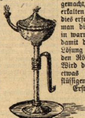
Abbildung 2. Dochtlampe des Altertums.

Es ist durch sein strahlendes, auf weite Entfernungen hin wirkendes, angenehmes Licht dazu berufen, überall dort zur Anschaffung einer hervorragenden Beleuchtung zu dienen, wo weder Gas noch Elek-