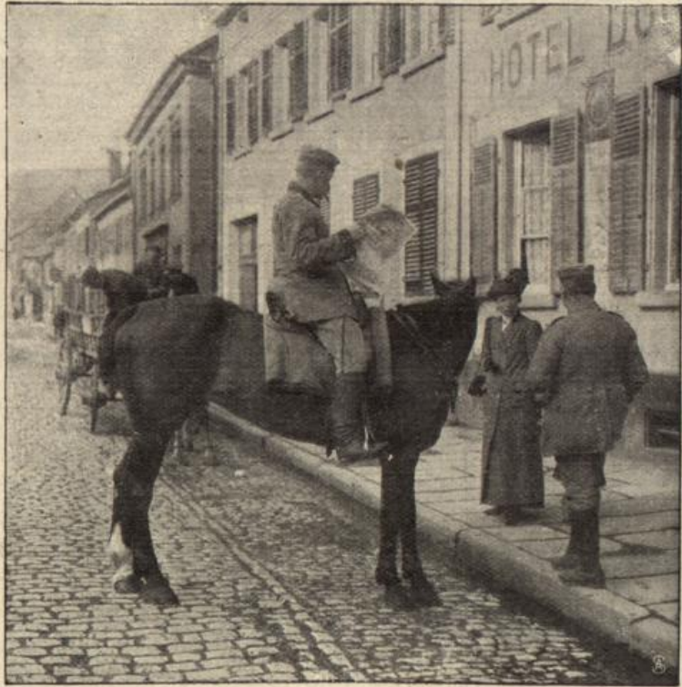
Gute Nachrichten. (S. 23)

„Am gestrigen Abend. Ein alleinstehender Mann, der als Ingenieur Paul Dingmer gemeldet war, wurde in der Wirtin mit einer Schußwunde im Kopf tot aufgefunden, nachdem er kurz vorher den Besuch eines Unbekannten hatte. Ein Selbstmord scheint ausgeschlossen, weil