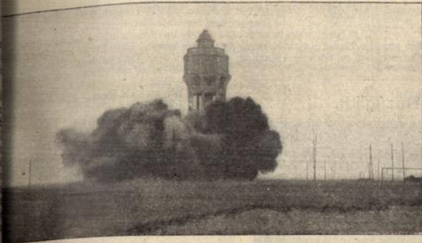
Sprengung des Wasserturms in Zebrügge.