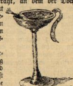
Abbildung 4. Ländliche Küchenlampe.