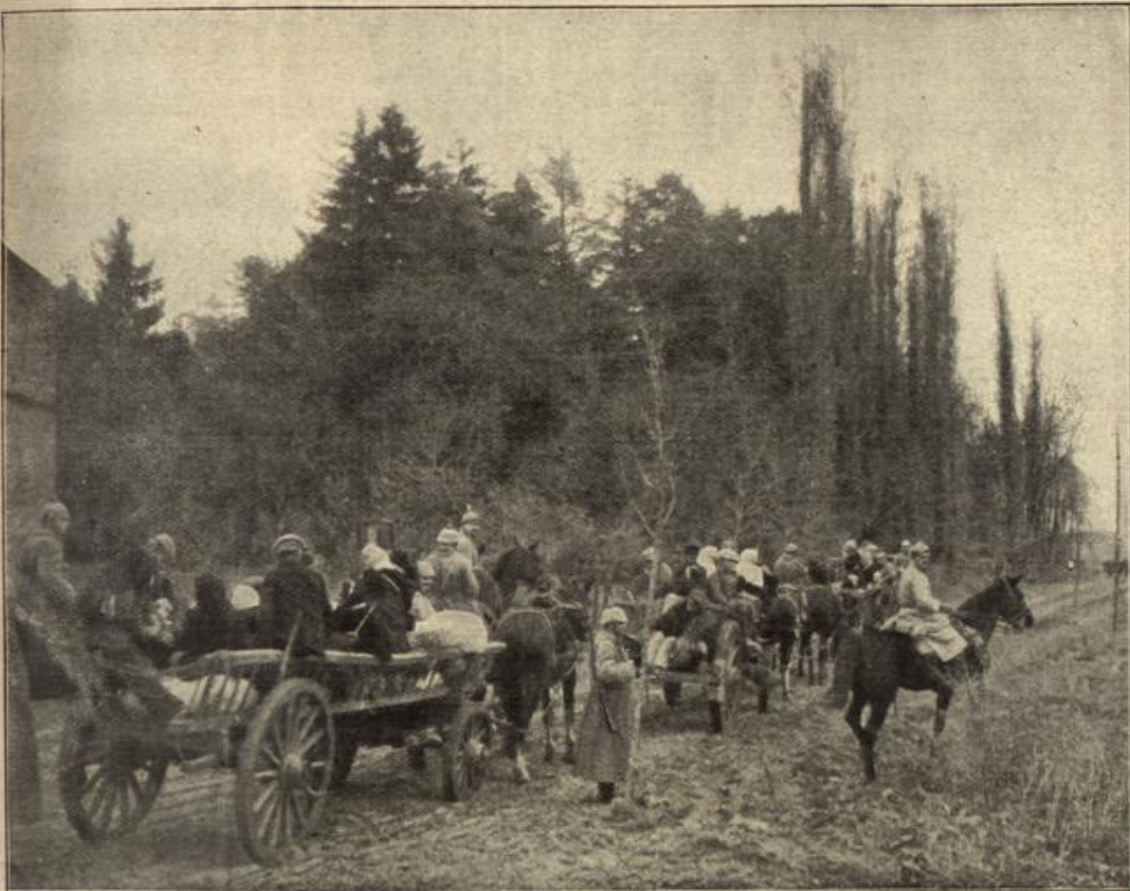
Französische Einwohner werden von den Deutschen in Sicherheit gebracht. (S. 23)

Entschluß durchzuführen. Denn nie hatte sie ihn so er- schöpft und elend ausse- hend gefunden wie in dieser Nacht. Er ent- kleidete sich hastig, und wie ein halb unter- drücktes Stöh- nen kam es aus seiner Brust, als er sich auf seinem Lager ausstreckte. Ein paar Minuten lang warf er sich noch her- um wie einer, den körperliche oder seelische Schmerzen nicht zur Ruhe kommen lassen, dann aber ver- rieten seine tiefen Atem- züge, daß er eingeschlafen sei, und auch Frau Luzie be- mühte sich nun nach Kräften, den Schläm- mer herbeizu-