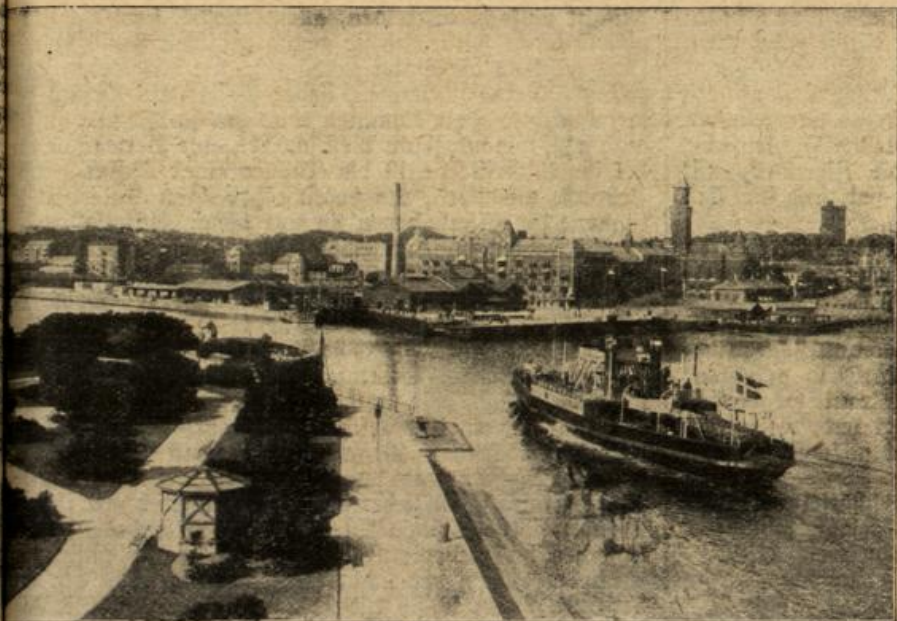
Die schwedische Hafenstadt Gelsingborg. (Mit Text.)

er hat a frie ; so h in ne Dorg schen gefe sich Wier schme sen. Gr mit b gene sch fertig komm vor, ein beim Dori fährt ist so gar Angst auf Nicht ahne er se und er sei schon hinter uf de und sln d ngen t hat gepe ngen a hat quie