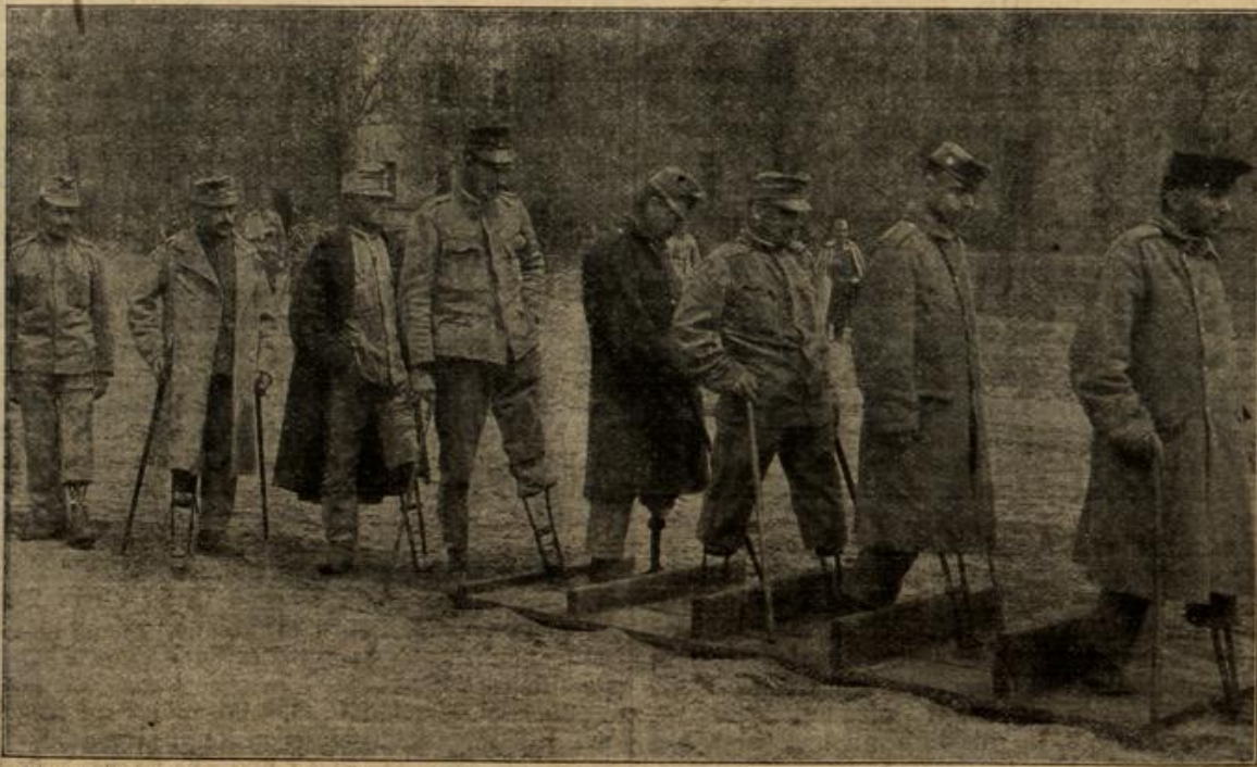
Österreichisch-ungarische Kriegsverletzte im Kriegslazarett in Drest-Litowsk bei Gehübungen mit Hindernissen.

neuem unlöslich an sie band. — — — Der Herrmeister Luzius sah vor dem breiten Schreibtisch seines Es war Spätnachmittag und Feiertag — Weih- tag! Die Flügeltüren nach dem Salon standen weit von seinem Platz aus sah er auf die schöne Edeltanne, des großen Zimmers stand, nur mit weißen Wachs-