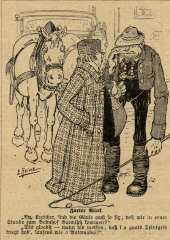
„Na, Rutscher, sind die Wäule noch so fig, daß wir in einer Stunde zum Bahnhof Garmisch kommen?“ „Dds glaubst — wann die merken, daß i a guats Trinkgeld kriegt hob', laufens wie a Automabul!“

Bei ausgedehnten Verbrennungen ist das Leben des Verletzten gefährdet, und zwar weniger durch die Verletzung an sich, sondern durch die Gefahr einer Herzschwäche und Lungenentzündung. Bis zur Ankunft des Arztes aber reiche man dem Patienten reichlich Wein oder Grog.