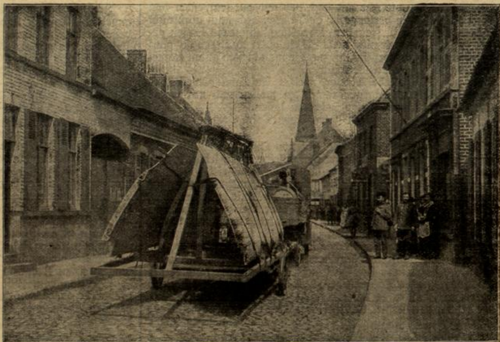
Beförderung eines zerlegten deutschen Flugzeugs mittels Automobils durch eine Ortschaft des westlichen Kriegsschauplatzes.

auf dem Wagen hoden blieben. kommt schon so nach Mitternacht sein, wie die Zigeuner auf einem freien Plaze, mitten im halt gemacht haben. Da ist der Franz rasch abgesprungen und vorsichtig hinter ein dichtes sch versteckt und hat abgewartet, werden wird. Zigeuner haben ein Feuer und haben sich darum ge- und die Weiber haben ange-