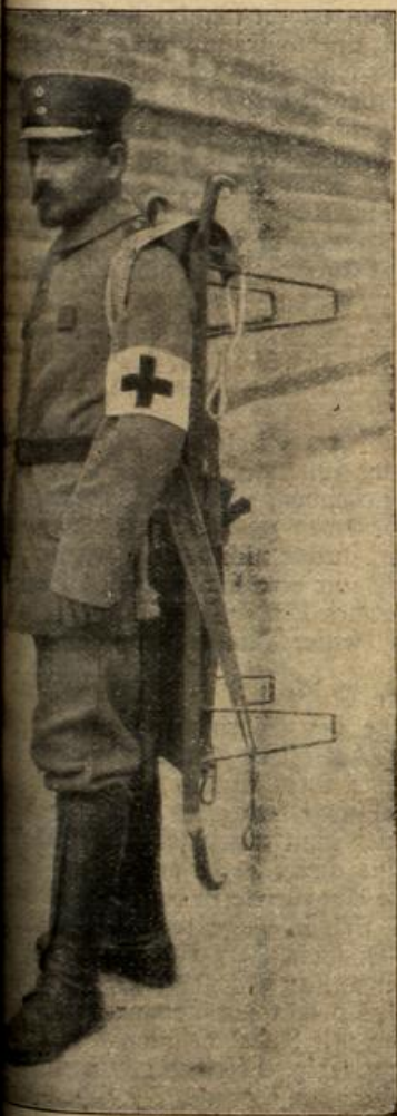
ernartige Tragbahre im deutschen Sanitätswesen. (Mit Text.)

Wie er halt gar keinen Ausweg find't und sein armes Bräunl schon verloren gibt, da kommt das freie Zigeunerrappl auf einmal ganz arglos auf ihn zu, bleibt dicht vor ihm stehen und schaut ihn neugierig an mit seinen klugen, vernünftigen Augen. Da ist dem Fichtenfranz ein rettender Einfall gekommen. Umsonst hat er nicht drei