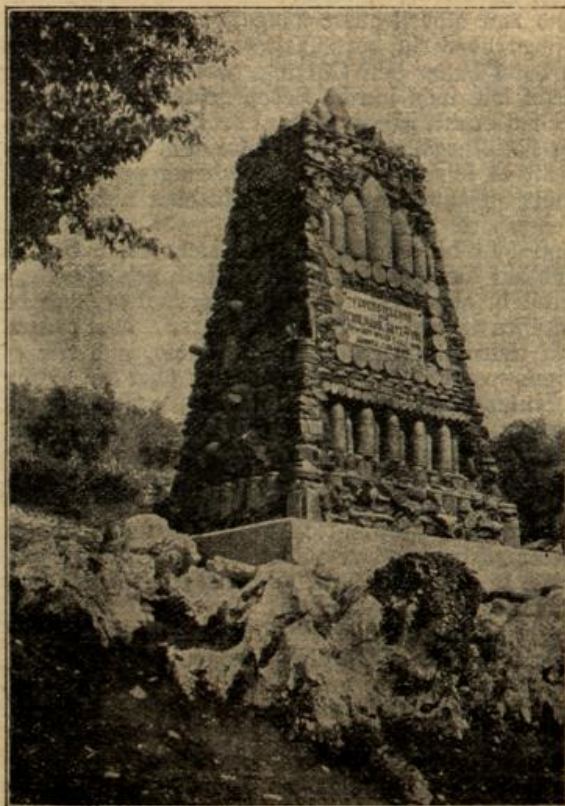
Ein Denkmal der italienischen Bundestreue, errichtet aus italienischen Blindgängern und Geschloßhrensgräben an der österreichisch-italienischen Kampffront.

Da hat er sich aber für einen andern Vorgang jetzt mehr interessiert. Auf Kosten der Stadt ist vor dem Hirschen ein großes Faß Bier angeschlagen worden, um die erhitzten und sehr durstigen Feuerwehrrleute zu laben und zu stärken. — Diese