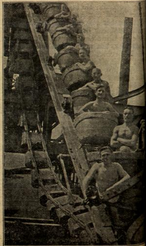
Sommerfreuden auf dem östlichen Kriegsschauplatz.

So saßt denn der Fichtenfranz einen andern Plan. Geschickt, wie ein Fichtapl, springt er nun hinten auf und fährt mit, und es war die höchste Zeit, denn es ist schon wieder in Galopp bergab gangen, da hätt' er können nicht mehr nachlaufen. Fest hat er sich an beiden Seiten angehalten, und geduckt hat er sich, soviel er konnt, damit seine braunen Reizegenossen nix von seiner Anmerkert haben. Wenn dann die Fahrt durch Silberbach wollte er die Pferdediebe gehörig hineinlegen. Witten Ring wollt' er Feuer und Hilfe schreien, so laut er hat und dann mochten sich die Zigeuner freuen, denn die