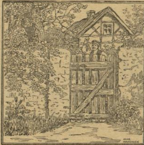
Wo ist der kleine Obstdieb?