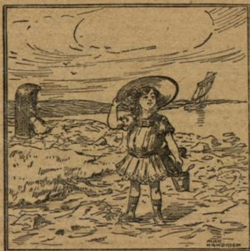
Wo bleibt heute mein Spielgefährte?

Auch die in der Schale abzukochenden Kartoffeln sollte man abends vor dem Kochen mit einer harten Bürste sehr sauber reinigen, in der Mitte einen halbfingerebreiten Ring der Schale abschälen und sie über Nacht in Essigwasser einweichen. In der Schale abgekochte alte Kartoffeln sind jetzt gar nicht mehr ansehnlich für den Tisch, sie zeigen oft grünliche Flecken und graue Streifen. Will man sie dennoch aus Ersparnis so kochen, so ziehe man ihnen noch heiß die Schale recht dünn ab und lege sie in einen Tiegel, in dem man etwas frische Butter mit Petersilie und einem Löffel Wasser dünsten ließ. Man schwenkt sie wenige Minuten in dieser Mischung und bringt sie dann recht heiß zur Tafel. Sie sehen dann gut aus und schmecken vorzüglich. Dies eignet sich aber nur für eine feste, nicht sehr mehligte Kartoffelsorte. Von mehligten Kartoffeln, die grau kochen und sehr fade schmecken, sollte man lieber Kartoffelbrei oder in der Pfanne gebadene Kartoffeln, sowie Kartoffellöcher bereiten, die immer gern gegessen werden und nahrhaft sind.