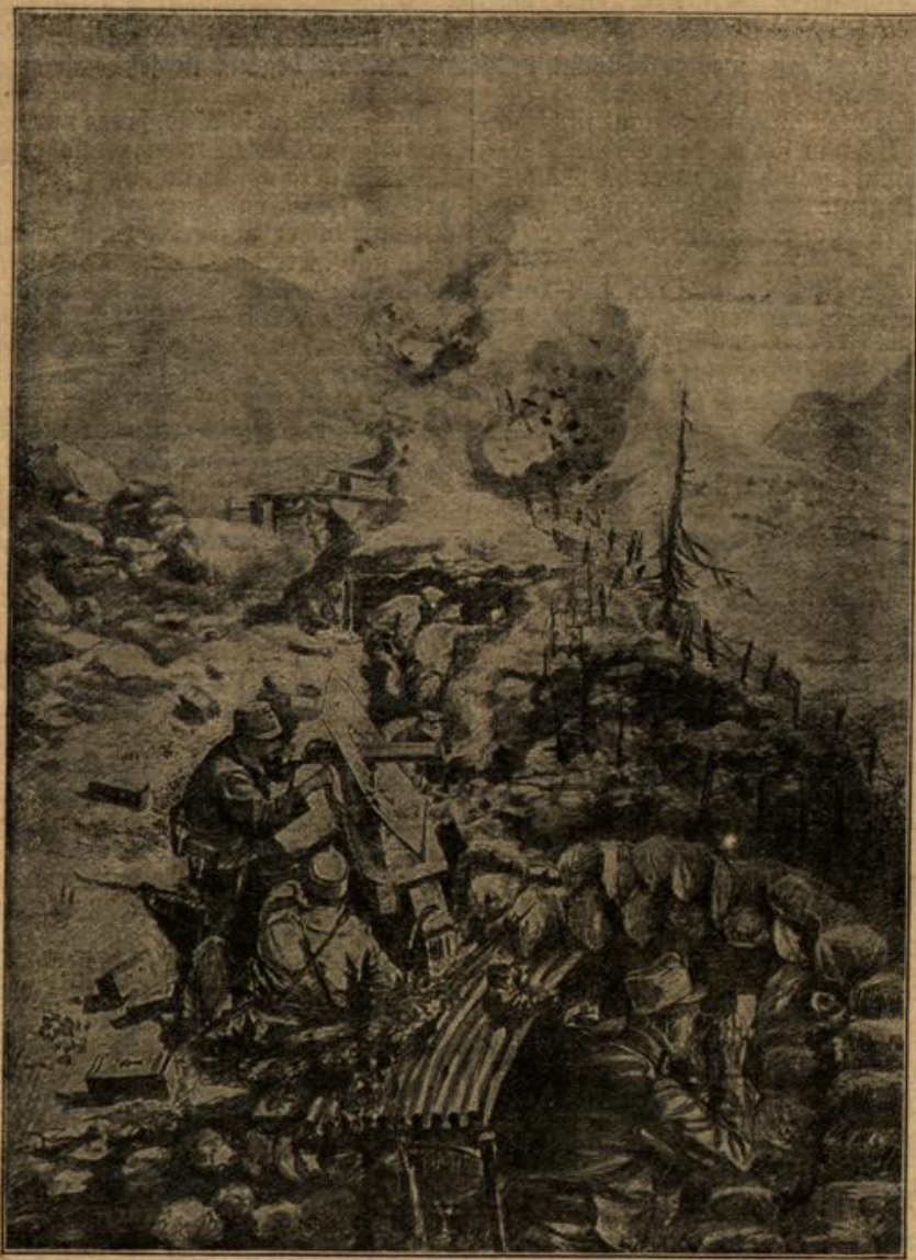
Von den großen Kämpfen in Südtirol: Österreichisch-ungarische Bergstellung im Eisföhl, gegenüber die Stellungen der Italiener. Auf dem Südtiroler Kriegsschauplatz gezeichnet von Franz Kleinmayer, Kriegsmaler.

„Gar nicht! Wovor denn auch?“ Ihre kleine, kühle Hand glitt in die große, sich ihr entgegenstreckende und jetzt lächelte sie!