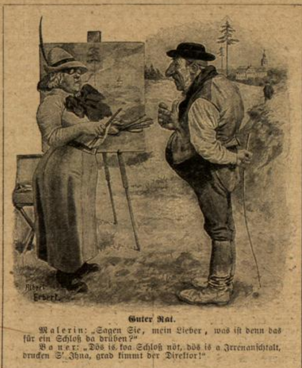
Guter Rat. Malerin: „Sagen Sie, mein Lieber, was ist denn das für ein Schloß da drüben?“ Bauer: „Dds is 'saa Schloß not, dds is a Jereenan'schtalt, druden S' Jhna, grad stimmt der Direktor!“

Bei nervösem Herzklopfen sach der Fehler gemacht, den an Salmiakgeist oder Essig zu lassen. Das erregt den Nerven und verschlimmert dessen Zweckmäßig ist es, Gesicht und abgestandenem Wasser zu höchstens einen Senfteig oder auf die Herzgegend zu bringen. leicht reicht man ein Brausepulver Petroleum dünn zu bestreichen. Die Farbe streicht sich dann dünn auf und springt infolgedessen nicht so leicht ab wie die