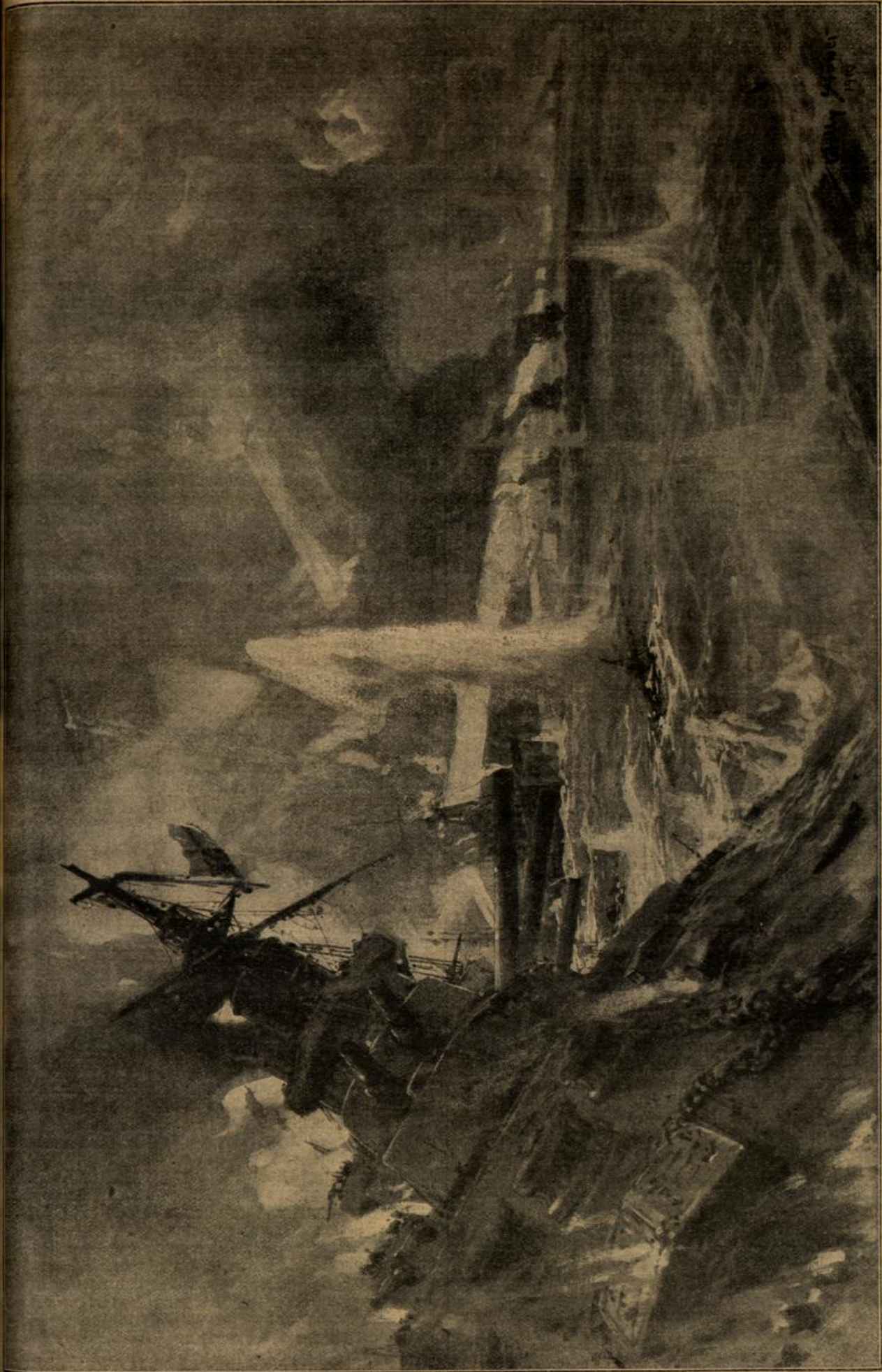
Die Seeschlacht vor dem Hagerraf am 31. Mai 1916. Vernichtung der englischen Schlachtkreuzer „Queen Mary“, „Indefatigable“ und mehrerer kleinerer Schiffe. Von Prof. Willy Stöber.