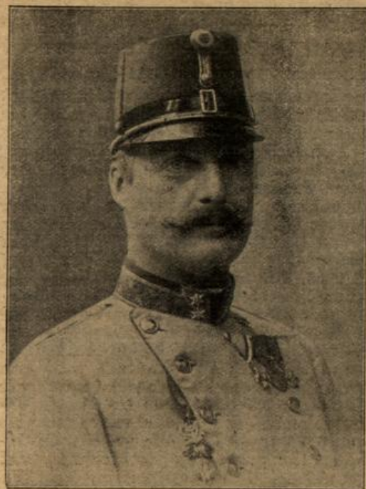
Erzherzog Leopold Salvator,