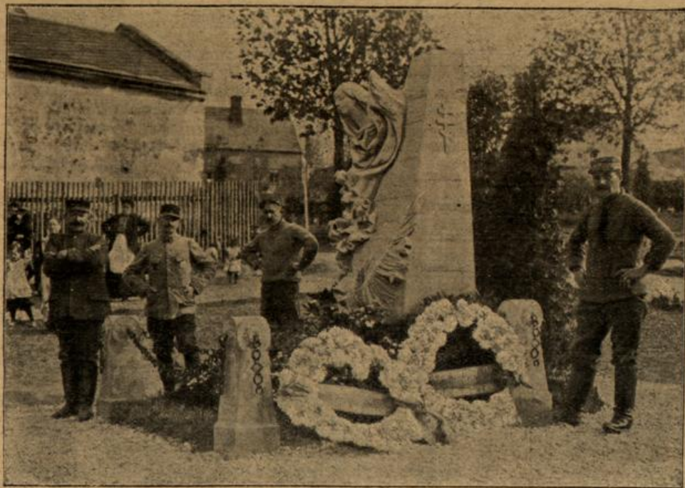
Ein Denkmal für Kriegsgefangene Russen und Franzosen in Deutschland. (Mit Text.)