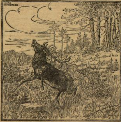
Wo ist der Jäger?

Er wendete sich nun an den berühmten Lenôtre, den Schöpfer der französischen Gartenbaukunst, der sich eines anerkannt vorzüglichen Geschmacks erfreute, und fragte ihn, wie ihm Trianon gefalle.