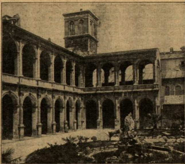
Palazzo Venezia in Rom,

Man erkannte gar bald seinen Ernst, seinen Eifer und vor allem seine Vertrautheit mit militärischen Dingen. Nach kurzer Frist schon war er Unteroffizier, dann Bataillonswachtmeister. Ganz allmählich kehrte ihm Mut und Selbstvertrauen wieder. Wenn er nun den Eltern zeigen konnte, daß er doch nicht ganz schlecht war! Jauchzend hätte er sich in die Arme stürzen mögen, um mit seinem Herzblut seine tiefen Wunden zu versiegeln. Aber es war, als wäre er gefeit. In den großen Schlachten in Belgien war seine Batterie wiederholt stark mit-