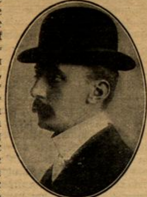
Graf Czernin, der bisherige österreich.-ungarische Gesandte in Bukarest.