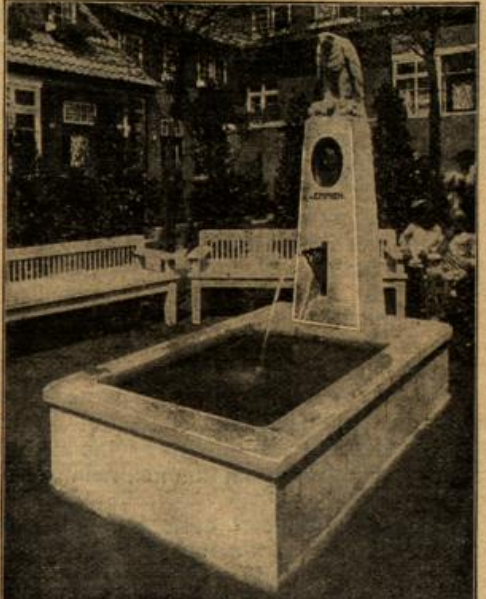
Der neue Emmichbrunnen in Hamburg.