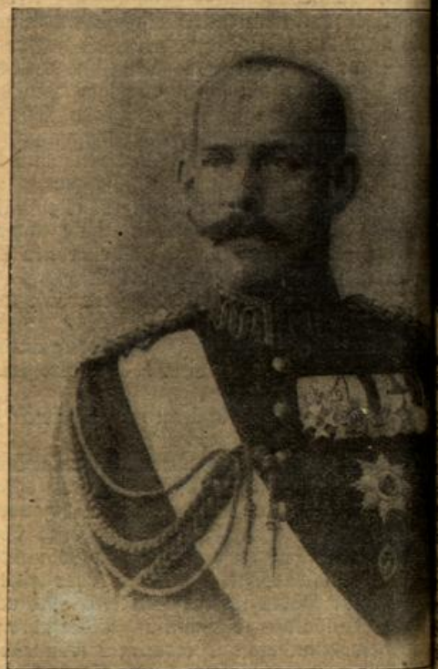
König Konstantin I. von Griechenland