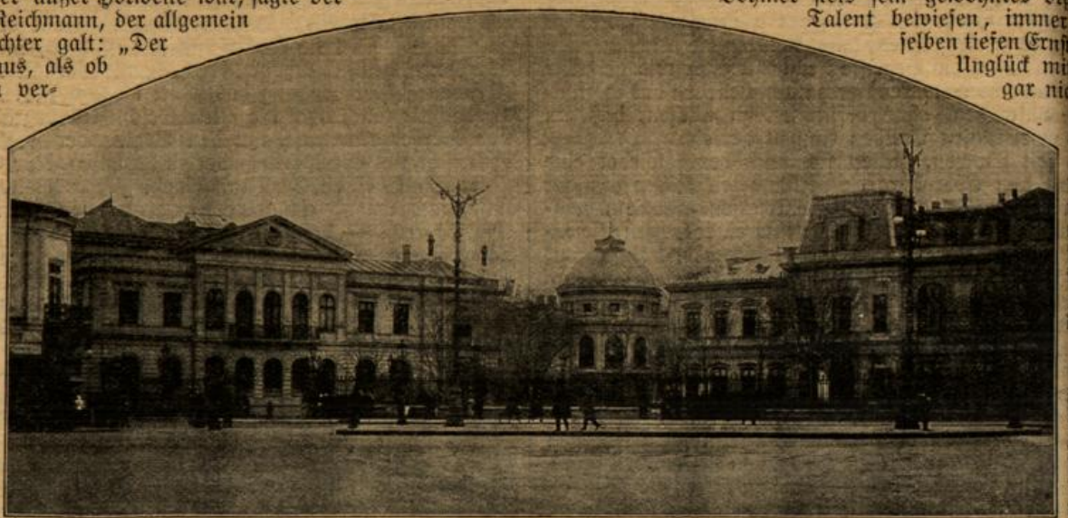
Das königliche Schloß in Bukarest, in dem der entscheidende Kronrat über den rumänischen Trennbruch unter dem Vorsitz des Königs Ferdinand stattfand.