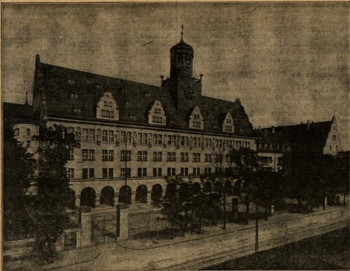
Das neue Zentraljustizgebäude in Nürnberg. (Mit Text.)

„Mit Vorsatz hab' ich ihn gemieden!“ entgegnete der Bruder.