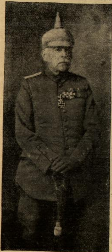
Ein 75 jähr. Ritter des Eisernen Kreuzes. (Mit Text.)

"Ja, das wundert Sie, was? Früher, als die vertrackte Brodenbahn noch nicht ging, da hatten wir öfters Logiergäste über Weihnachten und Neujahr im Hause, aber jetzt fährt ja alles in einem Saus auf den Herzenberg, um dort oben aus erster Hand in den heiligen zwölf Nächten Wotan und das wilde Heer zu belauschen und mit Becherklang, Gesang und Tanz das neue Jahr anzutreten. Das ist ja Mode geworden und das stille romantische Forsthaus mit seinem Waldeszauber ist altmodisch geworden. Aber heute werden sie froh sein, wenn sie hier unter Schlüpfen dürfen und bei dem Sturme ein Dach über dem Kopf haben. — Eben hörte ich nämlich vom Postmeister, die Strecke von hier bis zum Brodenhaus ist verweht und keine Aussicht, sie vor morgen frei zu bekommen. — Im Goldenen Anker an dem Markt richten sie auch schon die Fremdenzimmer. Also hurtig, Fräulein, in einer Viertelstunde soll der Zug fahrplanmäßig einlaufen, 'ne halbe wird's aber wohl werden, und dann sehen die Brodenfahrer die Bescherung, daß sie hier in Sella-ode den Silvesterabend feiern müssen. 's wird manchem einen Strich durch die Rechnung machen und den dicksten dem hochnasigen Brodenwirt."