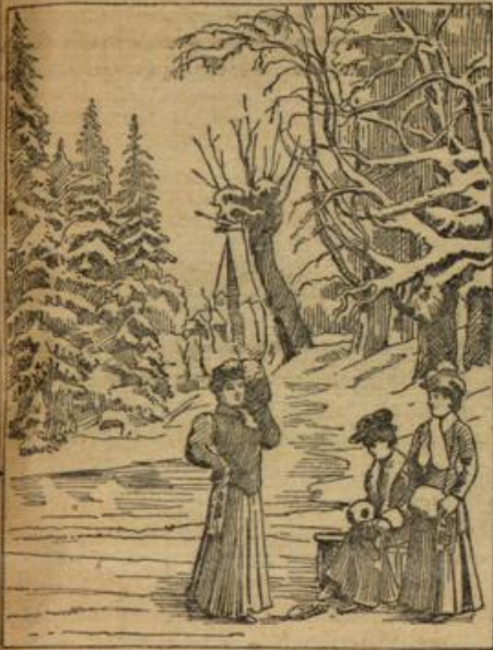
Wo ist denn der Eisbahnfahrer?

Auch kann man manchen sehen, der um Mitternacht ängstlich seinen und der Seinigen Schatten an der Wand prüft und sichtlich erleichtert aufatmet, wenn er einen Kopf zeigt, denn ein alter Aberglaube behauptet, daß man dann im nächsten Jahre nicht vom Tode bedroht sei, während ein kopfloser Schatten unbedingt den Tod der betreffenden Person bedeute.