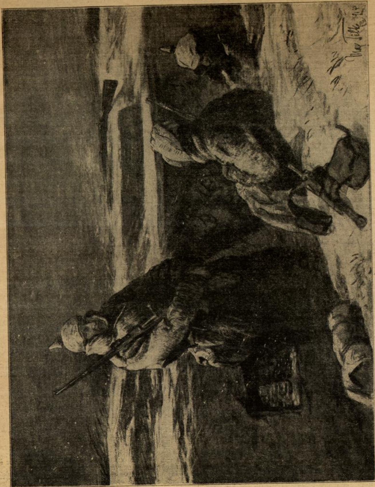
Neufahr im Schützengraben. Zeichnung von Max Tille.

„Mag sie klappern! Ich will nicht hierbleiben. Ich will zurückfahren nach Wernigerode oder Halberstadt“, rief, mit dem Fuße stampfend, die blonde Schöne, während die ältere Dame sich ergebungs-voll tiefer in ihren Pelz hüllte und den Ruff an das rechte Ohr hielt, weil's von dieser Seite schneidend herüberwehte. Der Herr runzelte leicht die Brauen und wandte sich an den