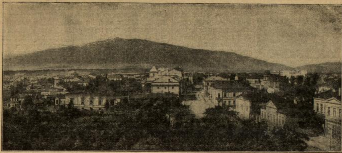
Panorama von Sofia, der Hauptstadt von Bulgarien. Im Hintergrund der 2287 Meter hohe Vitosa.

Monastir, befestigte Hauptstadt des südlichen Serbien. Die Hauptstadt eines ehemaligen türkischen Wilajets liegt in einem fast verumpften Boden, das von hohen Bergen umgeben ist und vom Tzerna, einem Nebenfluß des Wardar, durchströmt wird. — Gegen Westen bildet das Suhagora-Gebirge den Abschluß. In diesem kumpfigen und gebirgigen Land gibt es nur wenige Straßen, die bei der Beschaffenheit des Geländes besonders in militärischer Beziehung von größter Wichtigkeit sind. Alle diese Straßen schneiden sich in Monastir, das somit den Hauptmittelpunkt des Verkehrs in diesem Teile Serbiens bildet, zumal da auch die Bahn Salonik-Monastir hier endet.