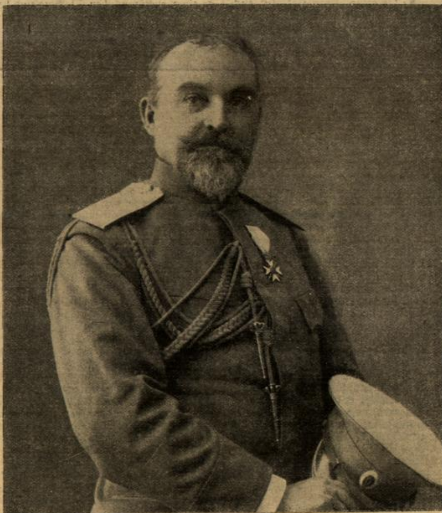
General Bojadjeff, siegreicher bulgarischer Heerführer.

Das junge Mädchen, das nun schon ein ganzes Jahr in dem Pensionat lebte, ohne sich dort selbst nach Ablauf dieser langen Zeit heimischer als am ersten Tage zu fühlen, schritt jetzt, nachdem das weißgestrichene Haus hinter der bogenförmigen Allee alter Linden verschwunden war, langsam weiter und suchte seinen Lieblingsplatz auf, den von einer dichten Lebensbaumhede umgrenzten Ausguck, von dem man einen entzückenden Fernblick über den breiten Strom bis weit hinunter auf das Häusermeer der städtischen Residenz hatte, deren Kirchtürme in die bläulichschimmernden ernen Höhenzüge wie in