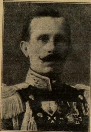
General Schetow, Oberkommandierender der bulgarischen Armee. (Mit Text.)

heim besaß! Ihr, der die traute Geselligkeit des elterlichen Pfarrhauses noch im Sinne ersehnt, erschien dieses moderne Treger geradezu als Frevel. Und empfand sie es wie eine Enttäuschung, daß heute noch Gäste kommen und reichlich Arbeit für die Hände brachten. Die halb am eheüber die trüben Gedanken das Herzweh hinweg.