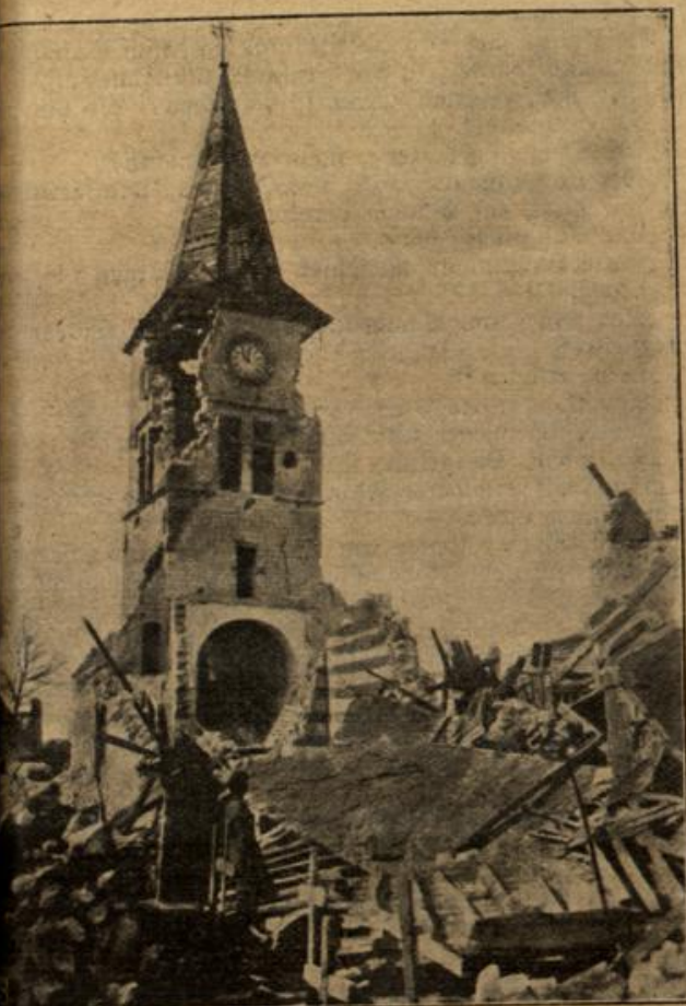
Die von den Franzosen und Engländern zerstörte Kirche von Tholus bei Arras.

uralten Sachsenreichen, von rebenumkränzten Moselbergen — und von fernem glücklichen Tagen — in denen die heilige Kunst mit der Liebe Hand in Hand gehen würde.