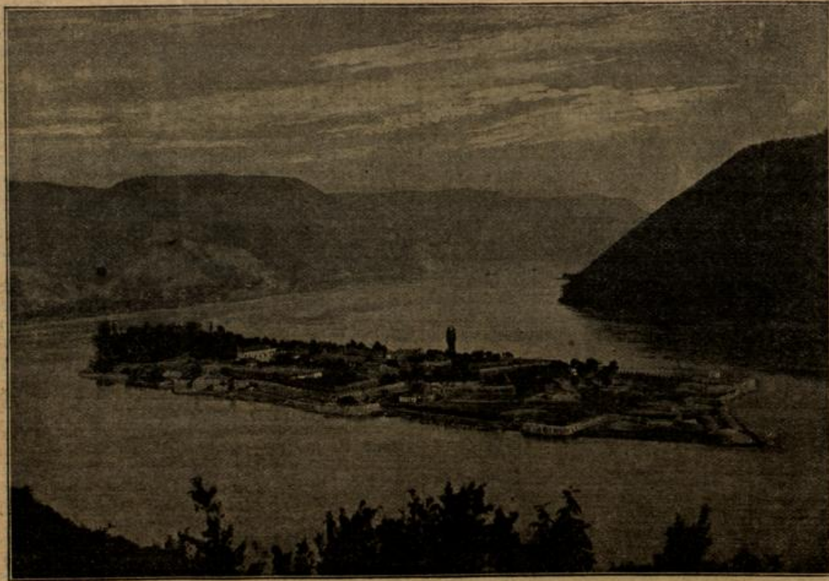
Der Schauplatz des Donauübergangs bei Drsova. (Mit Text.)

Ihm schwindelte jetzt bei dem Gedanken an seinen heißen und unbändigen Zorn und an seine fürchterliche Absicht. Er blickte dankbar zum Himmel, der in zwischen eine satte Blutröte annahm. Wie froh und glücklich mußte er sich fühlen, daß ein Mächtiger ihm nun in den