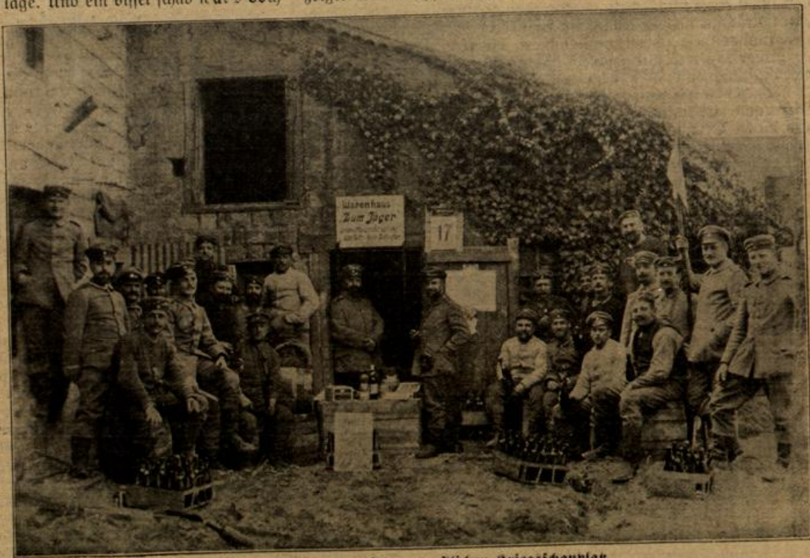
Ein „Warenhaus“ auf dem westlichen Kriegsschauplatz.