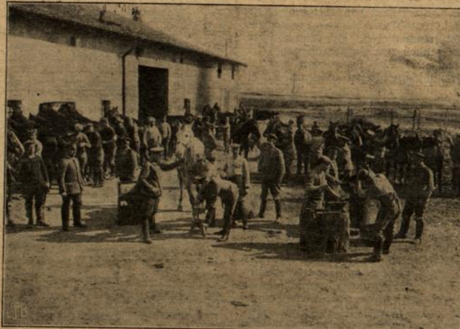
Leben und Treiben vor einer Feldschmiede an der Westfront.

wölben kann. Am nettesten sieht es aus, wenn man für die Pilzköpfe verschiedene Formen bildet, z. B. rund gewölbte, ovale oder runde becherförmige, wie sie Mutter Natur als Vorbild im Walde liefert, den flächlöpfigen Pilzen wird der Rand teils ausgefranst, teils unregelmäßig eingerissen. Dann taucht man einen recht spitzen Tuschpinsel in Emailfarbe und betupft damit ganz leicht die roten Pilzköpfe. Die Glückspilze werden dann recht zwanglos in ein mit Moos ausgepoltes Spanntörbchen oder in eine kleine Obstschlinge aus Korbgeflecht eingeklemmt, die man noch recht zierlich mit kleinen Tannenzweigen und Christrofen, Palmenzweigen usw. garniert. Ein paar farbige Bandschleifen, ein oder Fähnchen mit der Aufschrift „Frohliche Weihnachten“ beleben die anmutige Weihnachtsgabe, die dem Empfangenden gewiß doppelte Freude durch die damit verbundene „Handarbeit“ und das Zartgefühl, die diese Dinge in poetischer Form zu spenden, macht. Auch bei Postpaketen man alle Nüchternheit vermeiden. Man schlägt die Kistchen oder Pakete mit hellgrünem Seidenpapier aus, umhülle die einzelnen Päckchen ebenfalls mit Seidenpapier, verschütze sie mit bunten Seidenbändern