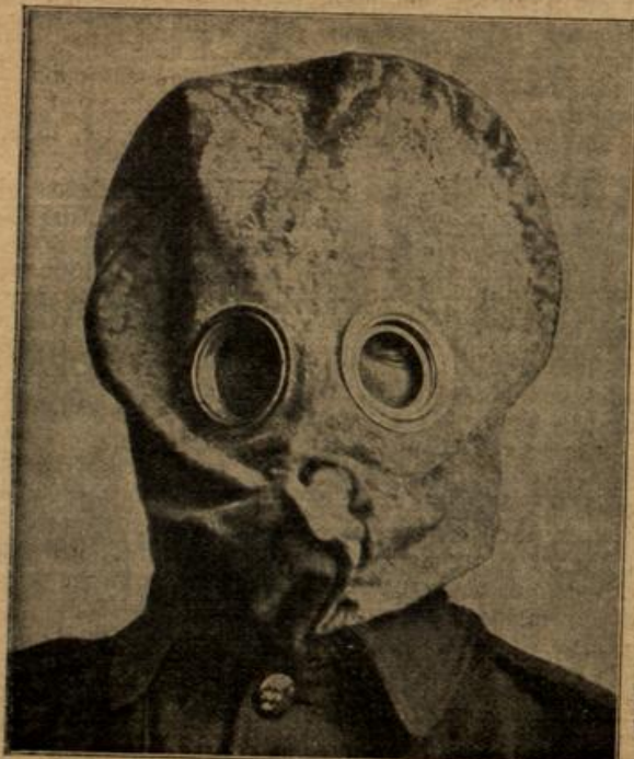
Englischer Infanterist mit einem der neuen Schutzhelme gegen betäubende Gase.

und die Füßchen, die gestern so schwer gingen, die fliegen fast über den beschwerlichen Weg. — Und nun ist Marie anläug. Ihr blonder Führer erwartet sie und führt sie durch lam hölzerne Bauten in einen schattigen Garten. — Dort sitzt, m