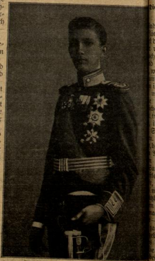
Boris, Kronprinz von Bulgarien.

(Nach einer Abbildung aus „Illustrated War News“.)