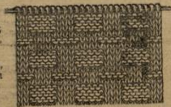
Arbeitsprobe zur Sportjade.

sch. Dann wird das Muster gestrickt, und zwar strickt man drei Touren je 3 Maschen rechts, 5 Maschen links, dann eine Tour rechts darüber, die nächste Tour wird gewechselt, dann wieder eine Tour rechts, die folgen- den wieder 3 rechts, 5 links und so bis zum Schluß. Ärmel und Ärmel- aufschläge sind nur rechts gestrickt. Zur Verwendung kam graue und weiße vierfache Sportwolle. Die Jade ist mit einer Doppelreihe weißer Perl- mutternöpfe versehen. Modell: Herold & Wilhelm, Leipzig.