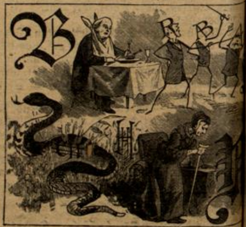
Auflösung folgt in nächster Nummer.