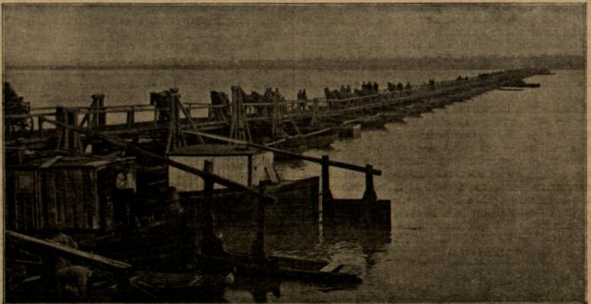
Der Übergang über die Donau. (Mit Text.)

Wie Krampfadern zogen sich die Spuren der Mißhand seiner rauhen Oberfläche hin und gaben ihm ein so abschüßliches Außeres, daß er bei diesem Anblick seine Selbstbeherrschun