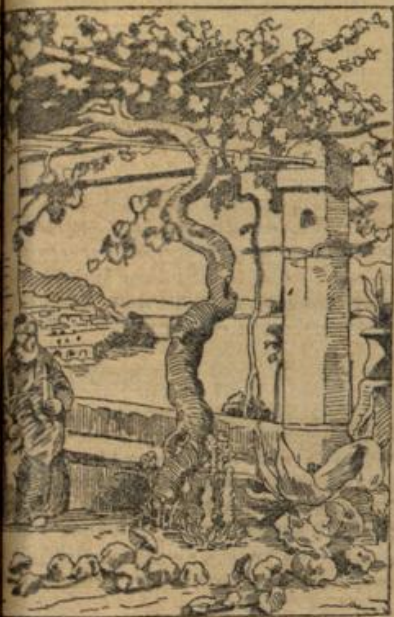
Wo ist der zweite Rindch?

Auch Hedwig kämpfte zwischen Lachen und Verdruß, und der Assessor sagte resigniert: