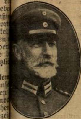
General Graf Bothmer, deutschen und österreichisch-ungarischen Truppen am Styr befehligt.

ung schien vereitelt zu sein. Denn wie er schwer die Stufen emporstieg, bemerkte er auf dem Absatz über sich schon einen Besucher, der an der Einlaß begehrte.