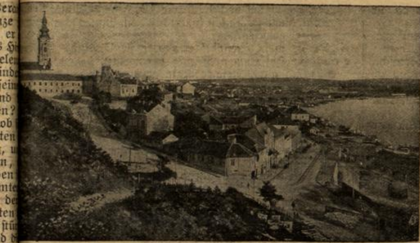
Blick auf Belgrad von der Donauseite.

und aus Furcht vor dem drohenden Aufsehen den Wagen aufreiß, um hinauszuspringen. Gerade in diesem Augenblicke aber hielt er den Wagen an, und Herbert befand sich am Balcon dem Hause stand Hedwig mit einigen Damen im Gespräche winkte ihm zu.