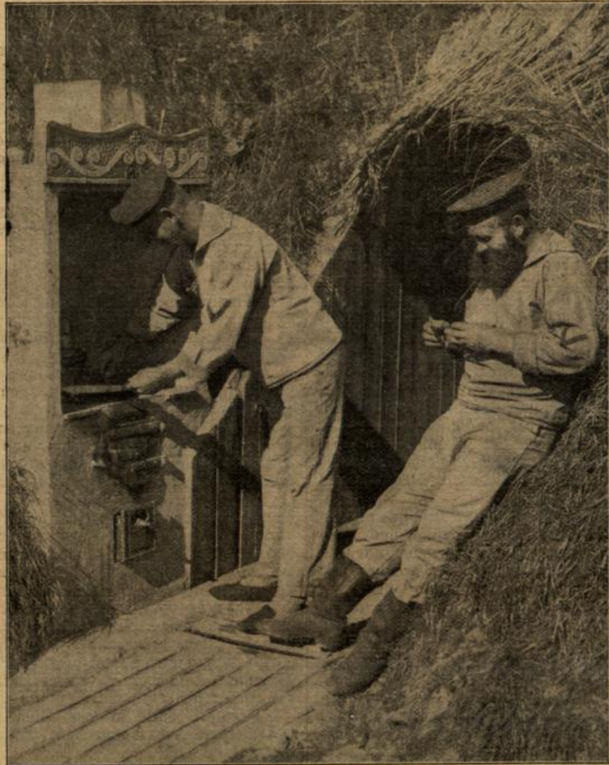
Stochherd deutscher Marinefeldaten vor einem Unterstand in den Dünen.

Mit brutalem erfaßte er den un Gegenstand seines Zornes und bearbeitete ihn mit dem daß es krachte und knallte, und er hätte sich wohl noch darum bemüht, ihm eine zusagende Form zu verleihen nicht ein zufälliger Blick aus dem Wagenfenster ihm gezei