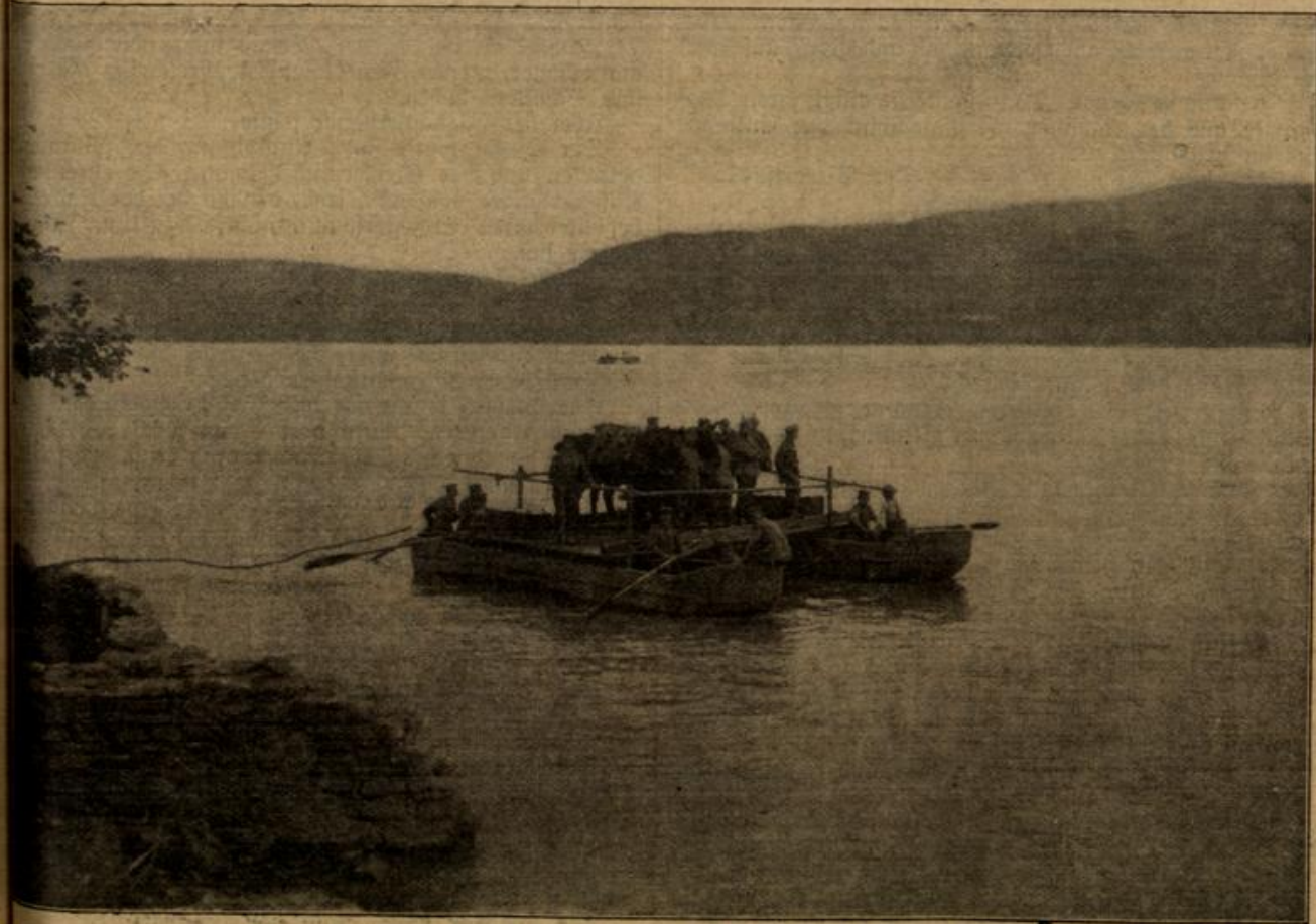
Donauübergang deutscher Truppen.

„'s war 'n gut's Jahr, heuer. Die große Scheuer ist vollgespickt, keine Garb' geht mehr rein! Und morgen ist Sichelent' in Furtmühlbach. — Zu Mittag gibt's beim Bauern G'schlachtets