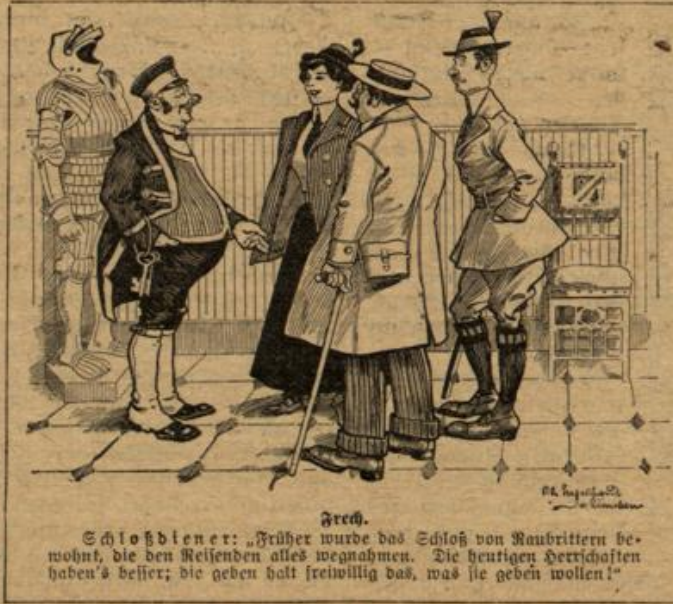
Schloßblen er: „Früher wurde das Schloß von Raubrittern bewohnt, die den Reisenden alles wegnahmen. Die heutigen Herrschaften haben's besser; die geben halt freiwillig das, was sie geben wollen!“

So wie draußen im Felde auf einem stillen Hügel oft ein Kreuzlein steht ohne Schmutz und Namen — der Vorsturm gegen den Feind ließ keine Zeit dazu, den Namen einzuschneiden —, so wie draußen oft viele beisammen liegen ohne Kreuzlein sogar; aber der Kundige weiß, hier liegen die Besten, die alles gaben, Gut und Blut, Vater und Mutter, Weib und Kind, Geld und Gut, Heimat und Herd, die königlichen Ungenannten, die alles den Brüdern und Schwestern daheim gaben, die königlichen, heiligen, namenlosen Helden des Vaterlandes.