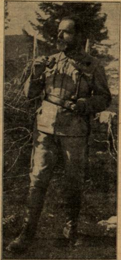
Ein Nachkomme Andreas Hofers.