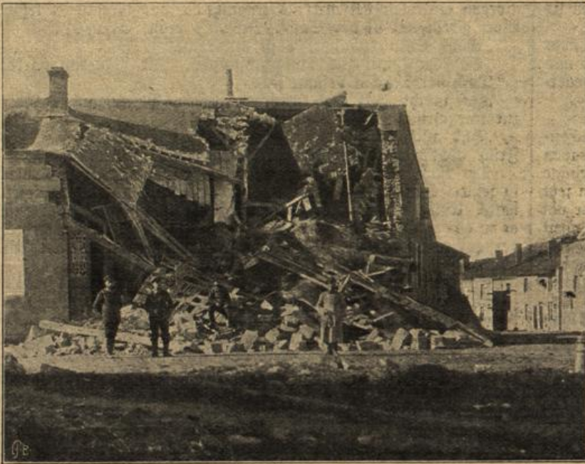
Eine Häuserreihe aus Briantes in der Champagne, an welcher die Wirkungen einiger Volltreffer zu sehen sind.