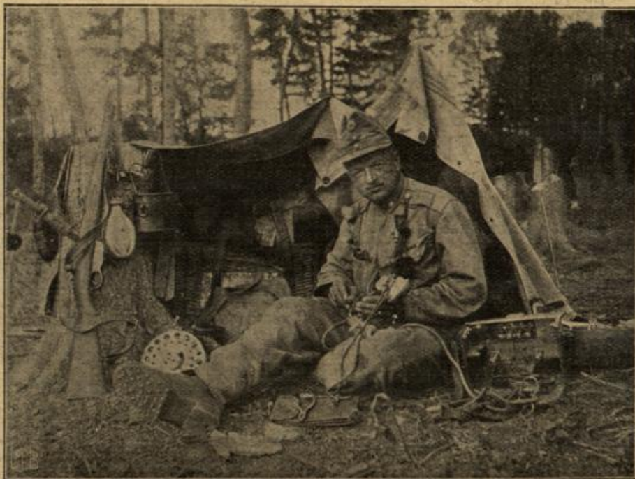
Österreichische Telephonzelle im Walde vor Pinsk. Der diensttuende Soldat ist beim Prüfen der Telephonkasetten.

Mittmeister Prinz Heinrich von Bayern , der sich gleich nach Kriegsausbruch in Frankreich durch hervorragende Tapferkeit auszeichnete. Er ist der Sohn des verstorbenen Generalfeldmarschalls Prinzen Arnulf. Die Hindenburg-Brücke in Berlin . Ungehindert durch den Krieg gehen in deutschen Landen zahlreiche große Schöpfungen ihrer Vollendung entgegen. Von den Hoch- und Tiefbauten Berlins wurde in diesen Tagen die neue Hindenburg-Brücke eingeweiht. Die dritte „Milionenbrücke“ in Berlin liegt im Zuge der Bornholmer Straße, führt über das riesige Eisenbahngelände der Stettiner Bahn und hat mit Erlaubnis des Generalfeldmarschalls von Hindenburg dessen Namen erhalten.