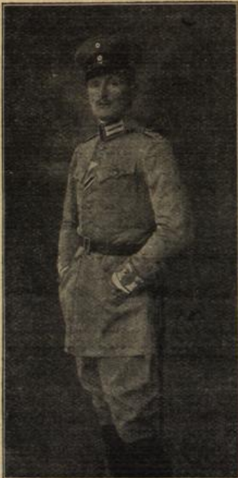
Hittmeister Prinz Heinrich von Bayern. (Mit Text.)

In den steilen Logesen wird die Post auf Eseln befördert.