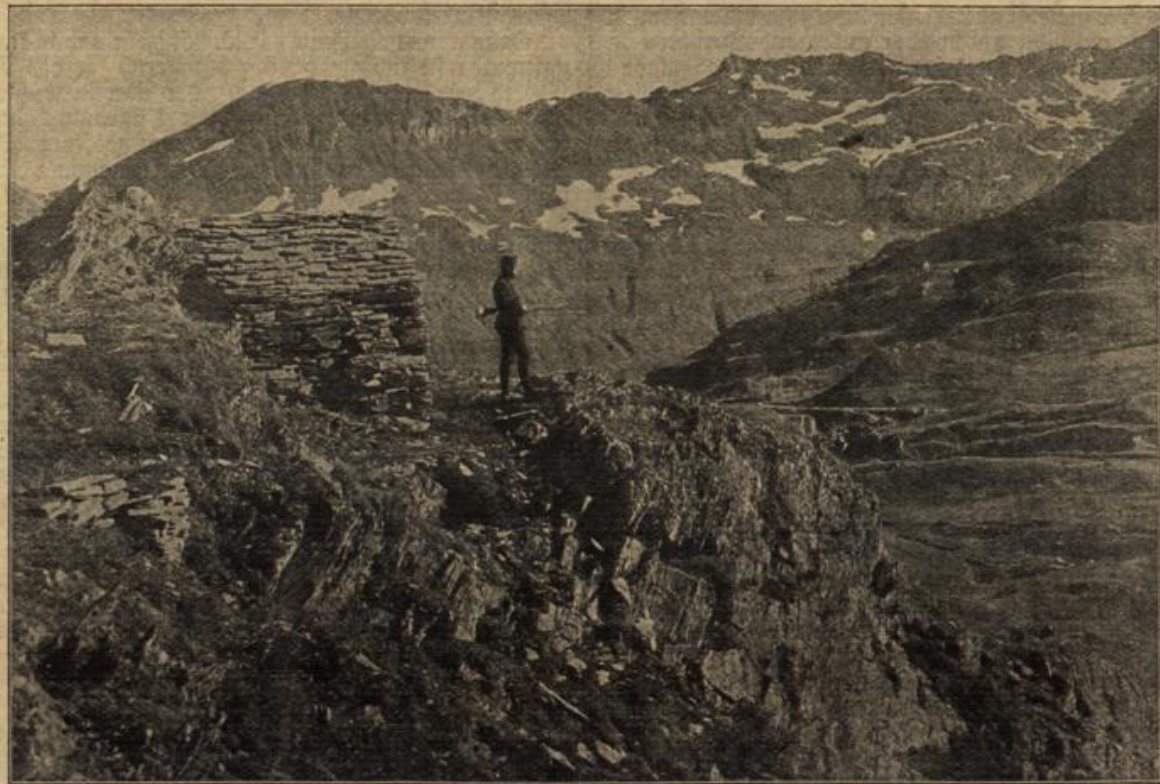
Die bewaffnete Neutralität der Schweiz: Ein schweizerischer Wachtposten im Splügenrebiet.