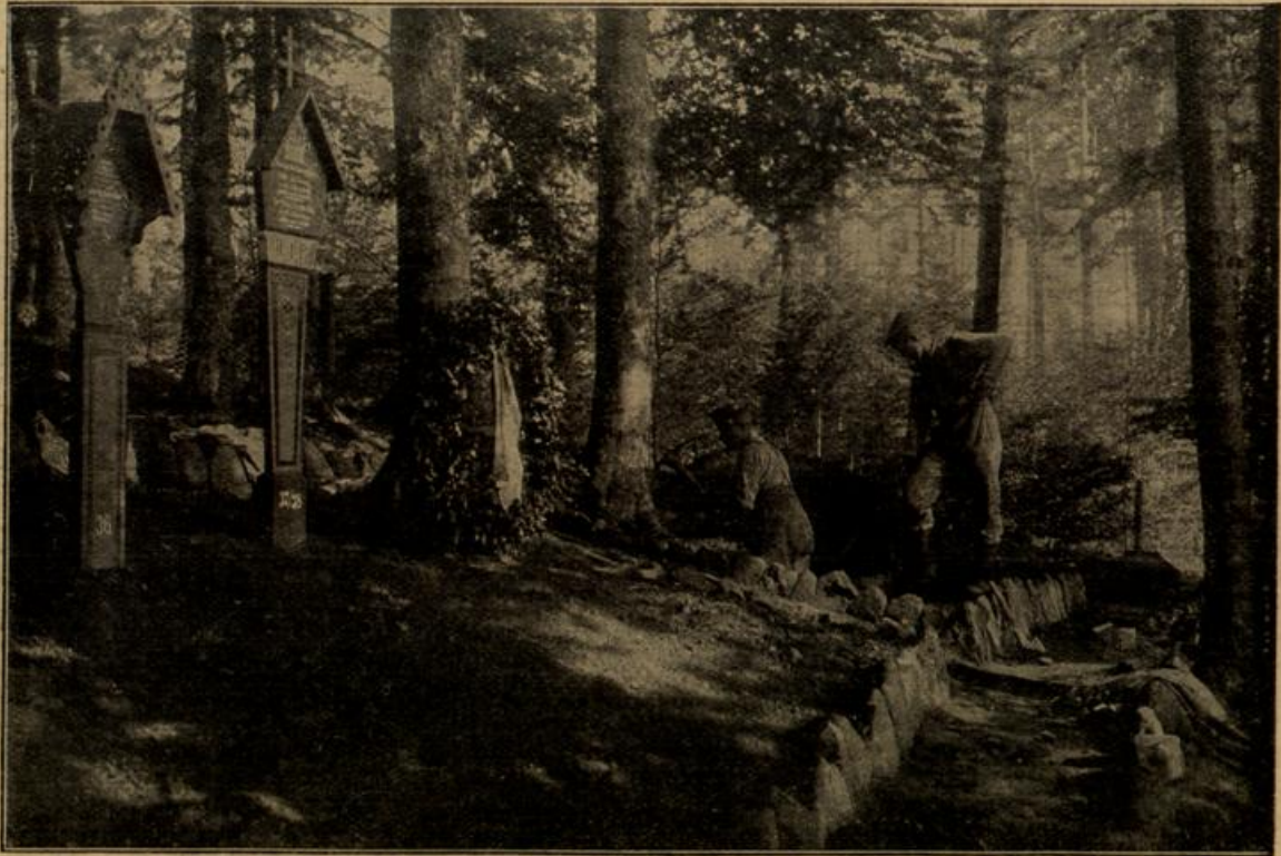
Waldfriedhof in den Vogesen, 1000 Meter vor der gegnerischen Front. H. H. Eberth, Kassel.

Schlafrock und vergnügt, und wie immer — sehr hungrig.