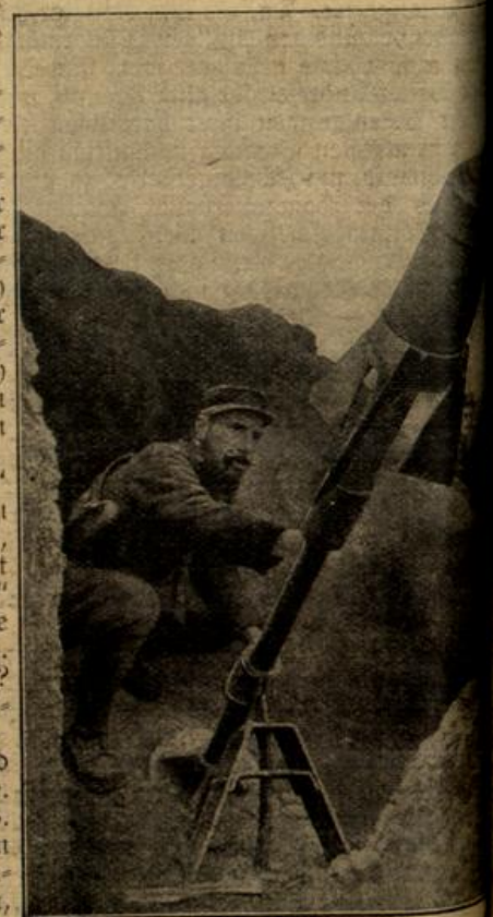
Französischer Minenwerfer für schwere

„Nun also! Wenn Sie einmal hören, daß mir Schmerz widerfahren ist, dann können Sie annehmen, daß ein Stern im Sinken ist. Das ist auch ein Aberglaube.“