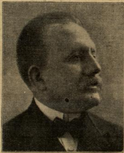
Salvatore Barzilai, der neue italienische Minister, wurde zum General-Kommissar für sämtliche eroberte Gebiete ernannt.

an? In seiner Mutter lebte der feste Glaube, daß ihr Sohn aus dem Osten