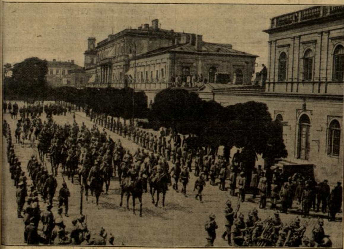
Einzug des Prinzen Leopold von Bayern in Warschau. (Mit Text.)