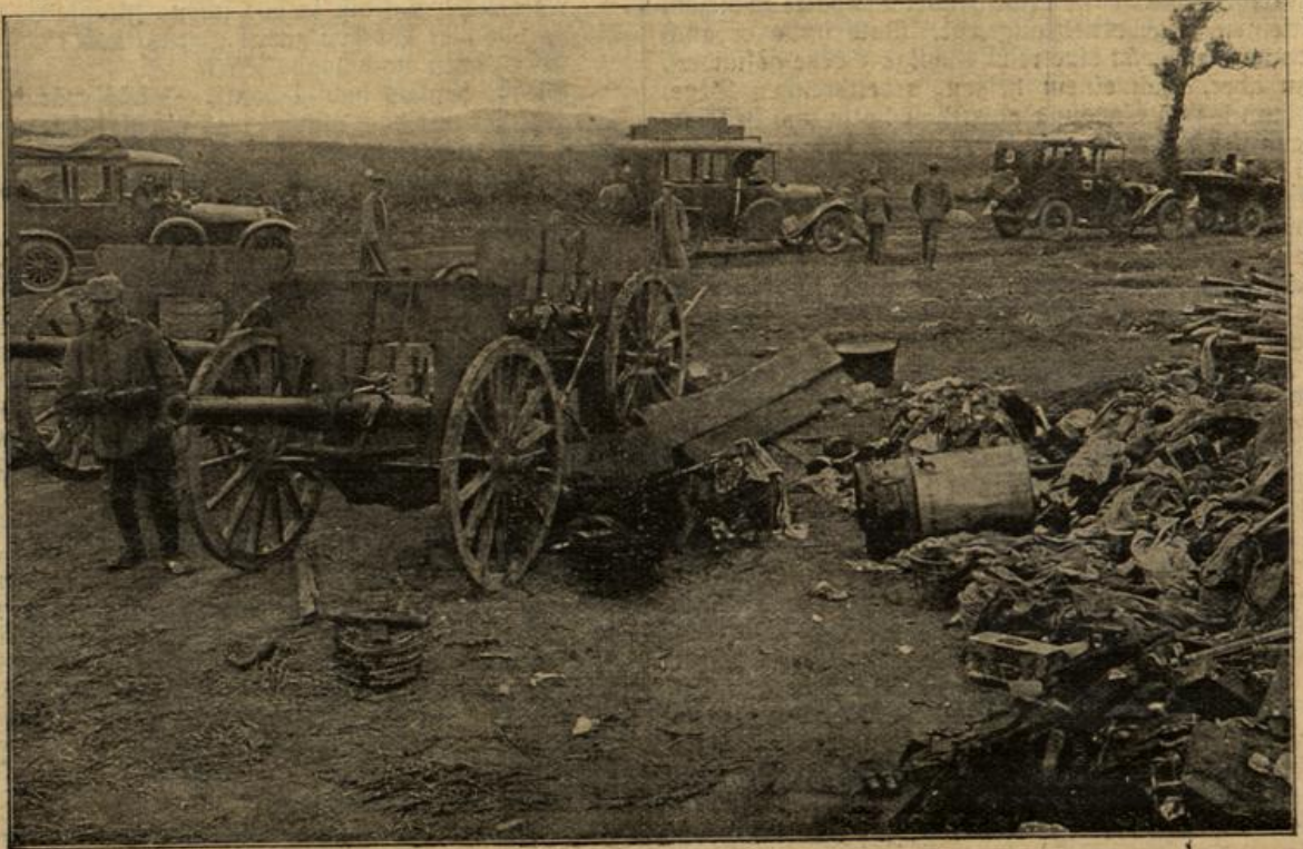
Zum fluchtartigen Rückzug der Russen bei Warschau: Russische Geschütze und Ausrüstungsgegenstände auf der Rückzugstraße gen Osten.

„Gib wenigstens acht, daß du nicht in russische Gefangenschaft geräfst!“ begann die Mutter wieder. Sie konnte ihre Gedanken nicht von den trüben Vorstellungen lösen. „Ich glaube, bei den Franzosen und bei den Engländern ist die Gefangenschaft gerade auch nicht zu empfehlen“, lachte er. „Im Gegenteil, bei den Russen ist es vielleicht noch besser. In Sibirien wird man gewiß nicht so scharf bewacht, denn wo soll man da hin? Man kennt dajelbst weder Weg noch Steg, Ortschaften gibt es nicht auf viele Meilen. Ich bin vollkommen sicher, da darf man frei herumgehen. Das ist doch ganz interessant. So billig kommt man da nicht wieder hin —“ „Hör auf, hör auf! Wenn man dich hört, sollte man denken, es wäre dein Ideal, in russische Gefangenschaft zu kommen.“