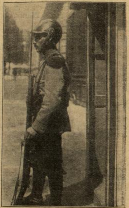
Der neue französische Stahlhelm.