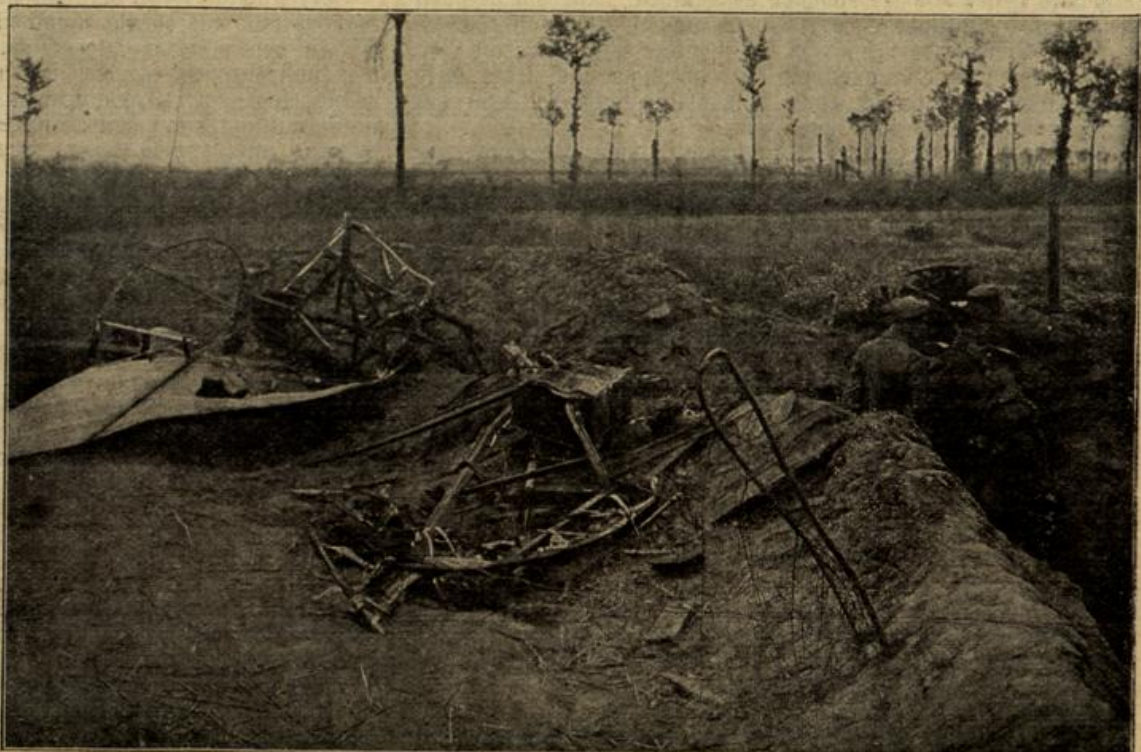
Trümmer eines von deutscher Artillerie herabgeschossenen englischen Flugzeuges. (Mit Text.)