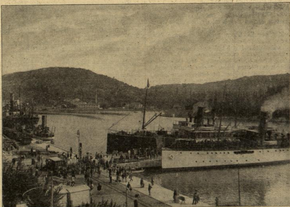
Der Hafen von Naguja-Bechia. (Mit Text.)

Sie sahen dem Vater ge- genüber. Er war in rosiger Laune, trank ihnen zu und freute sich, wenn er diese beiden jungen Menschen so lebhaft plau- dern sah. Es war, als sei ein Zwang von ihnen gewi- chen, als müßten sie sich heute näher kommen. Das Gespräch stockte keinen Augenblick. Ilse fragte nach der Mutter und den Schwestern Bern- ds, nach Buchen- felde und berührte im munteren Blauderton man- cherlei. Sie erzählte von dem letzten Winter in Genf, und daß sie gern immer in Deutsch- land leben möchte. Kaum hatte sie das ausgesprochen, wurde sie verlegen und verstümmte. „Was wird er nun von mir denken?“ fuhr es ihr durch den Sinn. „Wird er es nicht so deuten, als ob —“