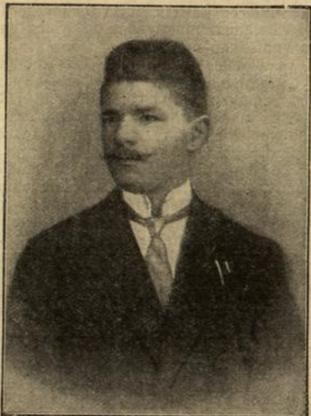
Das „Eiserne Kreuz“ für einen „Schipper“. (Mit Text.)

Der „Empress of Ireland“ durch- ragt die glatte See, die wie ein Bogen Stanniol- papier glitzert. Hinter dem schö- nen Schiff zieht ein langer und breiter Schaum- streifen her. Hier peitschen die bei- den Schrauben