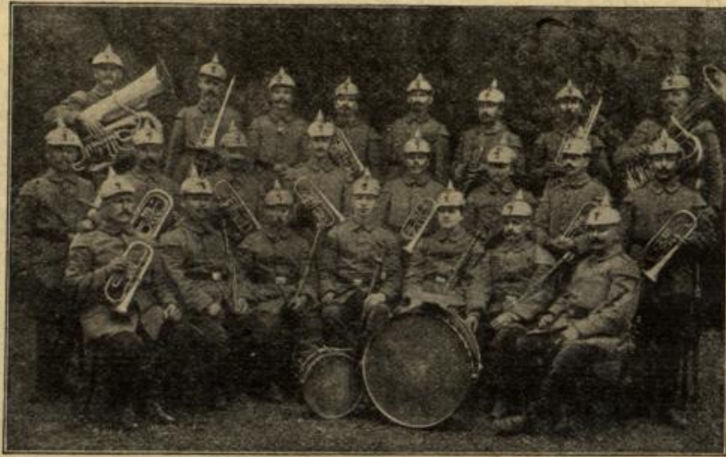
Landsturm-Kapelle Würzburg in Lütlich.

Trümmer eines von deutscher Artillerie aus 1800 m herabgeschossenen englischen Flugzeuges. Es stürzte brennend bei Frezenberg, östlich von Ypern, in einen alten englischen Schützengraben hinter der jetzigen deutschen Linie. Der Insasse, ein englischer Offizier, war tot.