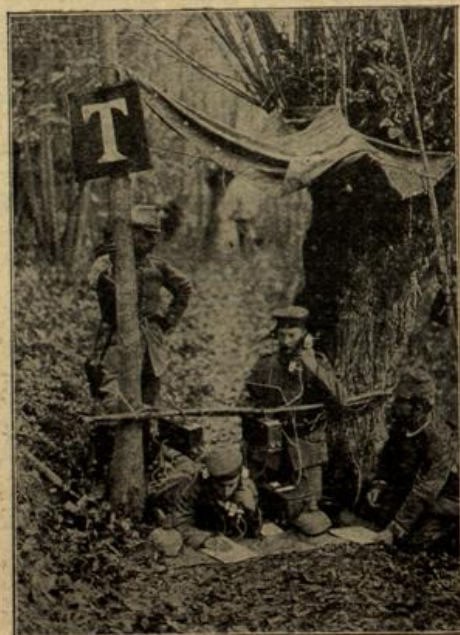
Vorgesobene Telephonstation an den Ufern der Aisne.

ben ihr. Sie war von der Bank aufgesprungen ihrem ersten Impulse folgend, fliehen. Da hielt Hand sie fest, sein dunkles Haupt beugte sich über „Ich habe Ihnen noch gar nicht Glück gewünscht, „soll ich es jetzt tun? Soll ich Ihnen sagen, was ich mir wachsen fühlte, als Sie mich unfreundlich und für- delten, als ich das Brandmal unverdienten Verdacht