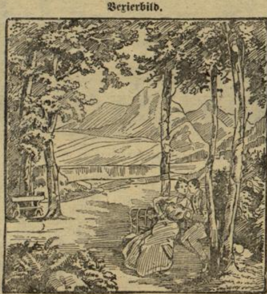
Wo ist die Eifersüchtige?

Zwei volle Jahre muß der Spargel gepflanzt sein, ehe er Erträge bringen kann. Die hervorkommenden Triebe werden an die Stäbchen geheftet, der Boden wird gehackt, bei großer Trockenheit auch tüchtig gegossen. Das Kraut wird nicht eher abgeschnitten, bevor es im Herbst well wird. Nach zwei Jahren guter Pflege können die ersten Spargel gestochen, noch besser aber gebrochen werden. Aber nicht während der ganzen Stechzeit dürfen die jungen, zweijährigen Pflanzen gestochen werden, da sonst die Pflanze nothleidend würde. Im nächsten Jahre wird sie dann kräftig genug sein, um während der ganzen Stechzeit von Mitte April bis Mitte Juni abgeerntet werden zu können. Das Spargelstechen selbst muß auch mit der nötigen Vorsicht geübt werden, da sonst leicht daneben hochkommende junge Triebe zerstoßen werden könnten. Täglich dreimal werden die Spargelbeete nachgesehen. Kurz ehe die Pflansen aus der Erde kommt, zeigt sie ihr Erscheinen dadurch an, daß sie die Erde etwas hebt. Nun wird die Erde an einer Seite vom Spargel soweit fortgewühlt, bis die Pflansen in ihrer vollen Länge freiliegt. Nun kann man sie bequem stechen oder auch abbrechen. — Nach Beendigung der Ernte wird die Anlage mit kurzem Dünger versehen und leicht untergegraben. Auch kräftige Jauchegüsse in trockenem Boden fördern die jungen Triebe sehr. Das Düngen im Sommer ist praktisch, da der Dünger bis zum Frühjahr gut verrottet ist und bei der Spargelernte nicht hinderlich wird. C. Fusch.