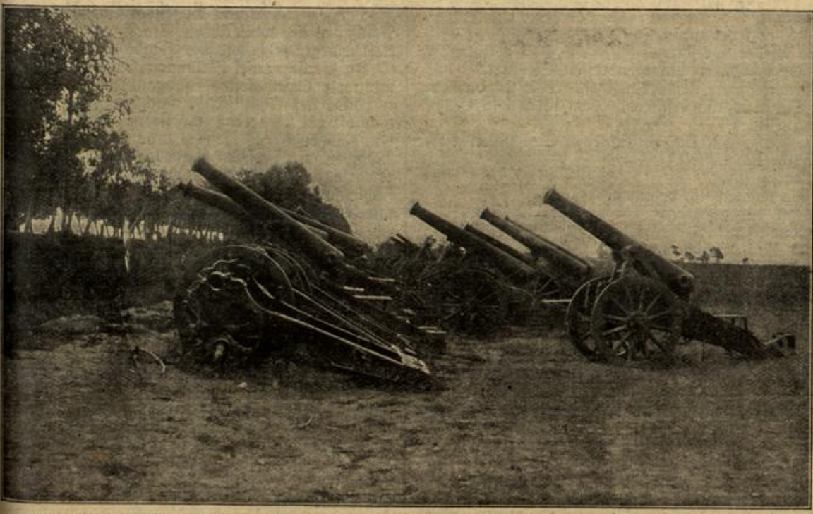
Kriegsbente aus Przemyśl: Geschütze, die den Russen bei der Wiedereroberung der galizischen Festung abgenommen wurden.