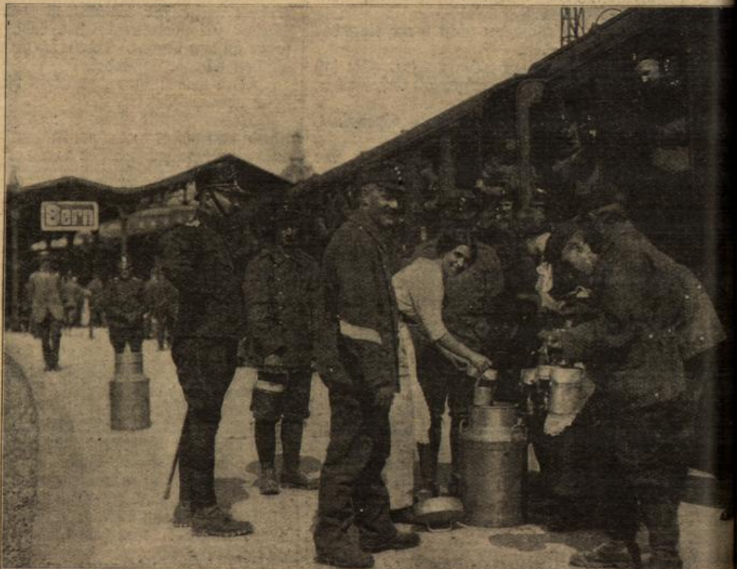
Aus der neutralen Schweiz. (Mit Text.)