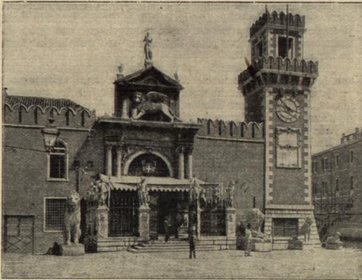
Das historische Eingangstor zum Arsenal in Venedig. (Mit Text.)