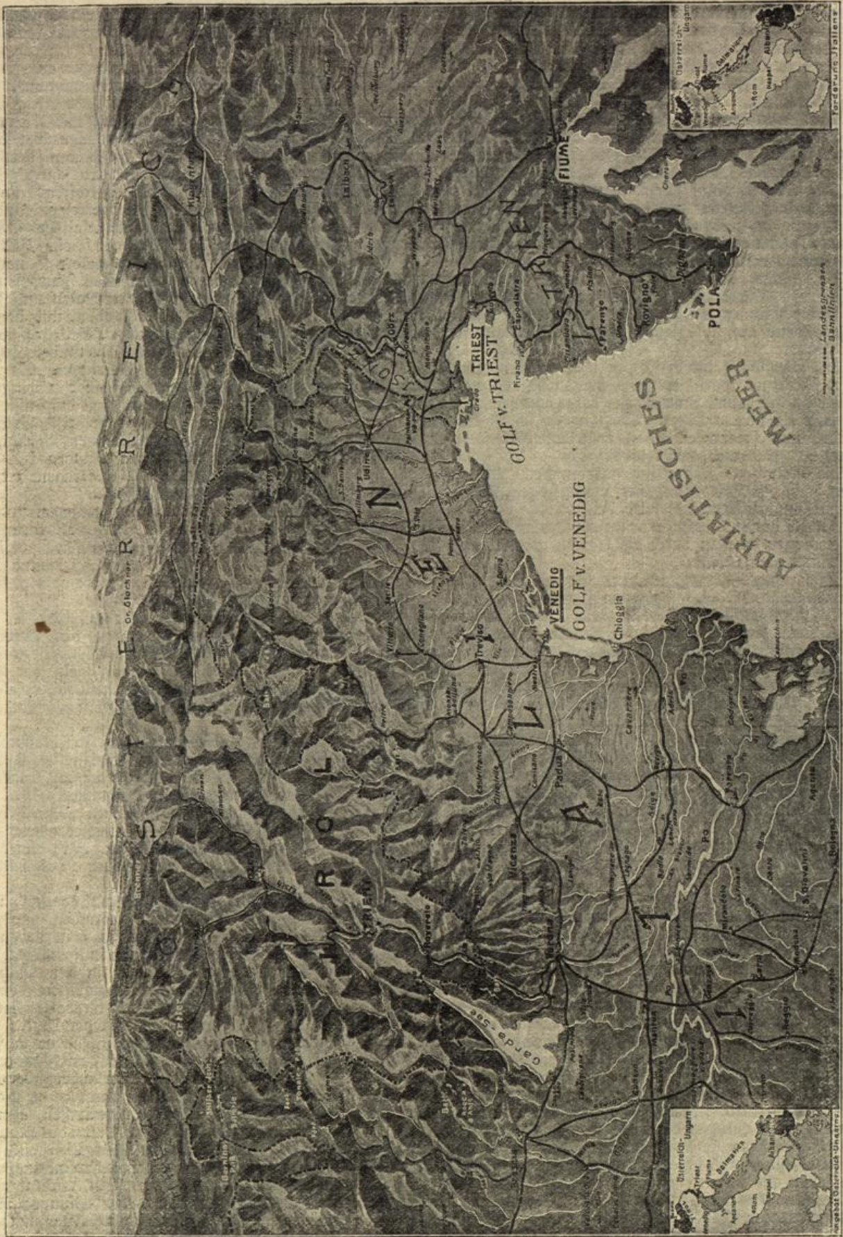
Der neue Kriegshauptplatz im Süden. Gezeichnet von Walter Gimmerleben.

und schaute die graublauen Dinger mit Echeu und Furcht an. Das waren also die Boten des Todes nager alles Unglücks und Wehs. er war er in Frankreich. Kinder, in Frankreich, in den Laude, und die Leute da waren keine Gegner,