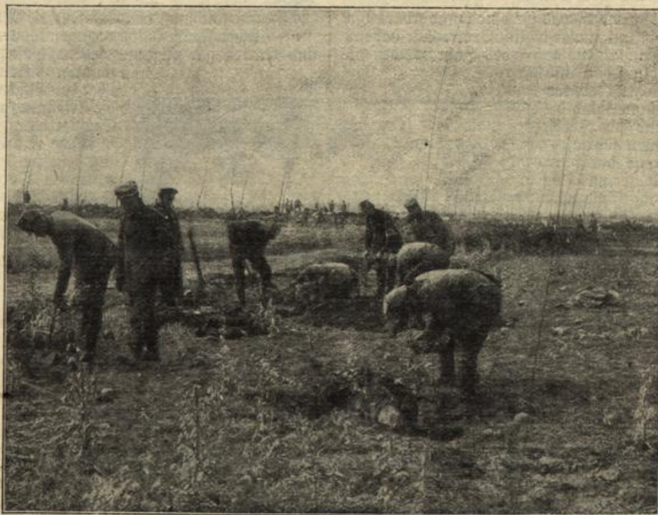
Von den flandrischen Schlachtfeldern. (Mit Text.)

Von den flandrischen Schlachtfeldern. Vor längerer Zeit gefallene französische Soldaten werden von Deutschen nach Eroberung der gegnerischen Stellungen mit Hilfe von präparierten Instrumenten und Gummihandschuhen nach der Erkennungsmarke durchsucht und dann begraben.