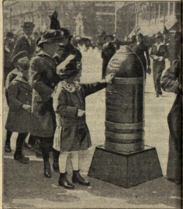
Liebesgaben-Sammelbüchsen in Budapest. (Mit Text.)

Und als er im Viehwagen neben neununddreißig Kameraden hockte und man durch die Fluren rollte, konnte man mehr singen konnte, weil die Kehlen streckten.