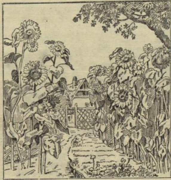
Wo steht der Gärtner?

Nun zur gleichzeitig im Innern des Hauses vorzunehmenden Bekämpfung der Ameisen. Diesen muß vorerst jede Nahrung ent- zogen werden. Alles Genießbare wird aus den Schränken ent- fernt. Dafür legt man große feuchte Schwämme mit Zuckersirup getränkt hinein. Die Ameisen werden dem Zucker nachgehen und sich in den Poren der Schwämme festsetzen. Am nächsten Morgen noch vor Tagesanbruch überbrüht man die Schwämme mit kochendem Wasser. Hierdurch werden die Insekten getötet. Wieder- holt man dieses Verfahren noch einige Male, dann wird man bald von diesen Plagegeistern, denen ja der Zugang von außen versperrt ist, befreit sein. Haben sich Ameisen auch in anderen weniger be- nutzten Räumen eingenistet, in denen keine Nahrungsmittel auf- bewahrt werden, so blendet man den Lichtzutritt mit dunkelblauem Mattan ab und legt große Stücke Kampfer aus. Nach derartig verdüsterten Räumen werden sich die Ameisen nicht hinziehen, auch ist ihnen der Kampfergeruch außerordentlich unangenehm.