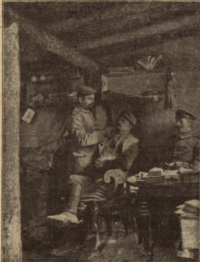
Ein langentbehrtes Vergnügen: Beim Kriegsfreizeur in einem gesicherten Unterstand bei Reims.

Der Kommandant des österreich-ungarischen Ari-Assequequartiers, Generalmajor Max Ritter von Hoca. Der Vorstand des österreichischen Kriegspressequartiers wurde kürzlich zum Generalmajor ernannt. Er wurde vom Deutschen Kaiser mit dem Eisernen Kreuz ausgezeichnet.