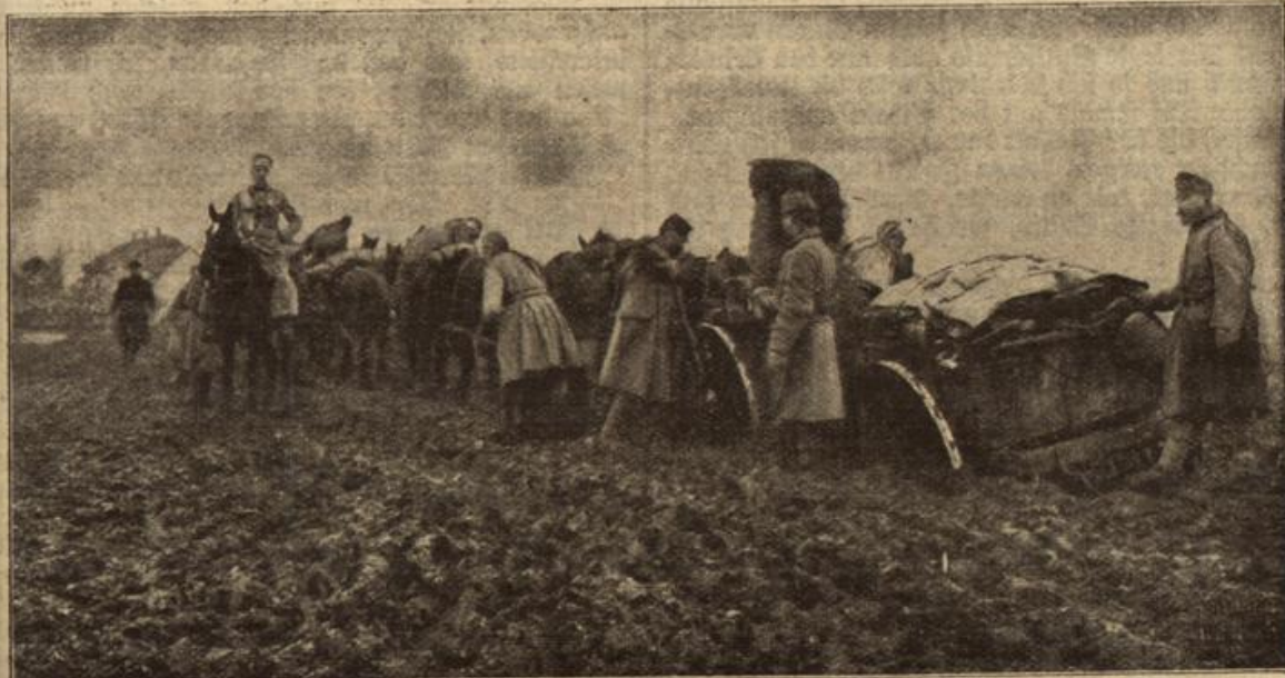
Russisches Straßenelend: Osterreichische Truppen auf unergründlichen russisch-polnischen Wegen.

„Und was meinte denn der Oheim dazu?“ fragte