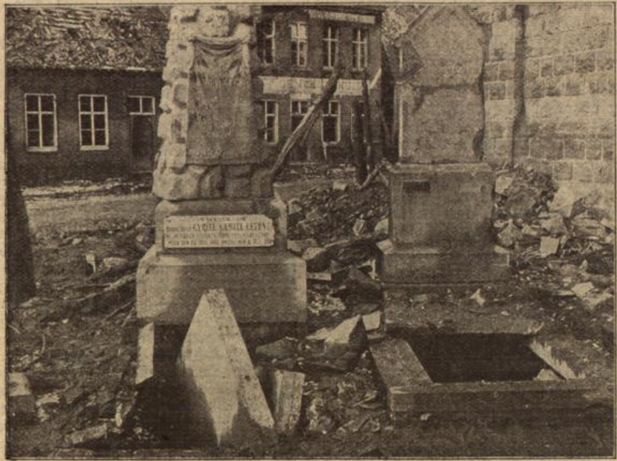
Die Schreden des Krieges: Zerschossener Kirchhof in der flandrischen Ortschaft Passchendaele.

Am nächsten Christas Mann vier Uhr auf. Nacht durch das Auge geschlossen sei Gefühle bei ihn. Er siebte seinen Mann draußen in ionst so ruhig Blut wallte ihm. Heilige rung einerjens anderen Seite Gefühl bei den ken an den Frau und er fiel, — ob