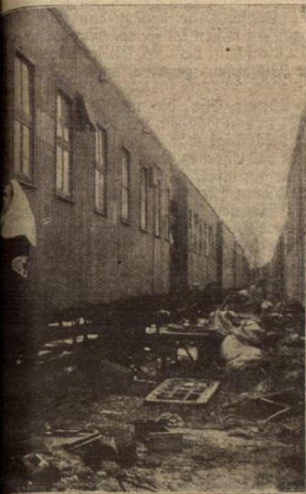
Der Winterschlacht in Moskau. (Mit Text.)

abei dachte an den n beide Sterb ch sein im An Doch r. Und ruhig er an eichgü wird hen m ächsten Mann auf. urch ha schloße ähle be fieber Mann im ruhig alle Heilige erfene Seite bei de den M nd Am — ob e sie Bater te er noch. zu or ektor, mal, daß rgute